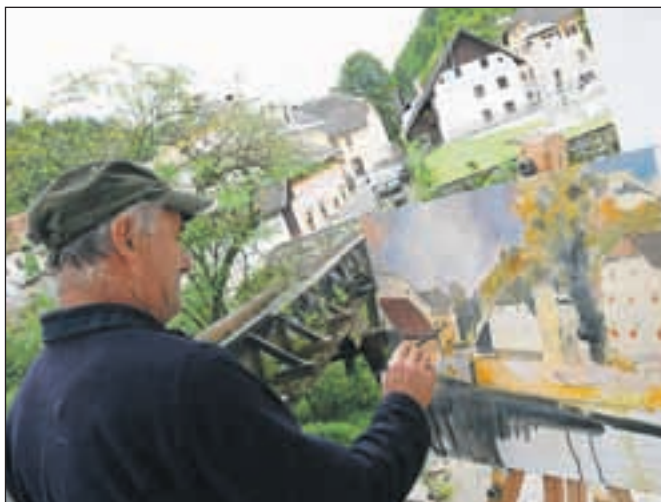
Slikarske kolonije se je udeležilo 27 slikarjev.