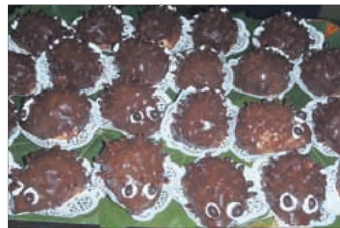
Zmagovalna sladica so po napetem glasovanju postali ježki Moje Žula.