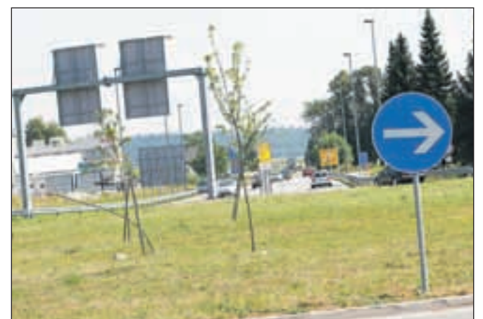
Neurejeno krožišče na državni cesti v Lescah