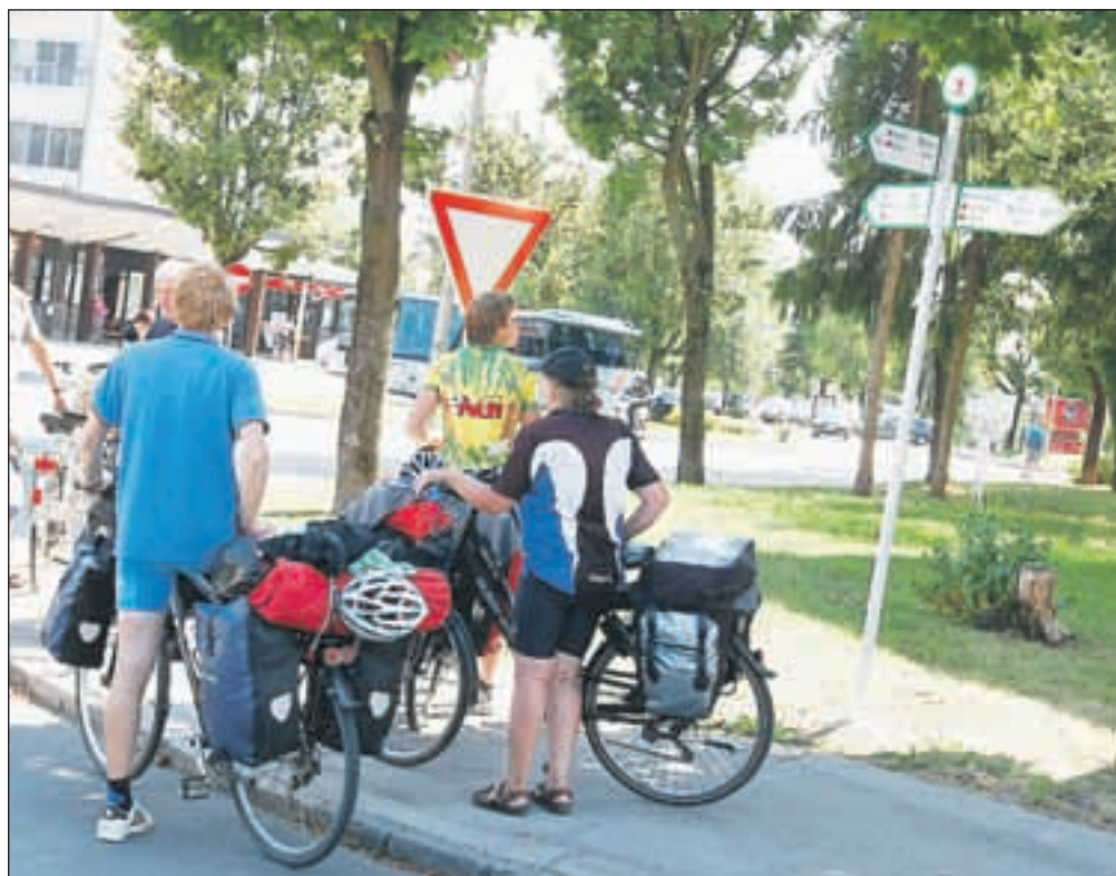
Tudi turistom, ki v Radovljico pridejo na kolesih – in teh je vedno več – bodo usmerjevalne table prišle prav.

»Na Nizozemskem samo skozi okno pogledaš, pa vidiš smerokaz. Tudi zato, ker tam kolesarjenje ni le šport, ampak način življenja. Tudi sam sem se trideset let vozil v službo s kolesom. Je najhitreje in najudobneje. Zato je na nizozemskih cestah na primer pogost pogled na žensko na kolesu, ki ima spredaj na sedežu enega otroka, zadaj drugega, pa še torbe na prtljažniku.«