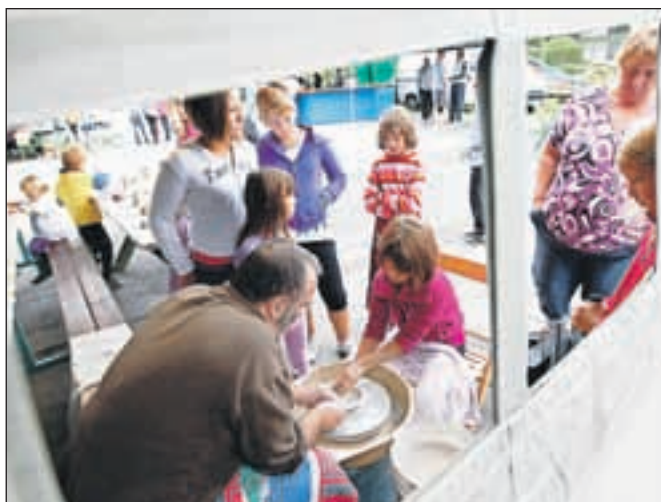
Sobotno dopoldne je bilo posvečeno likovnim delavnicam.