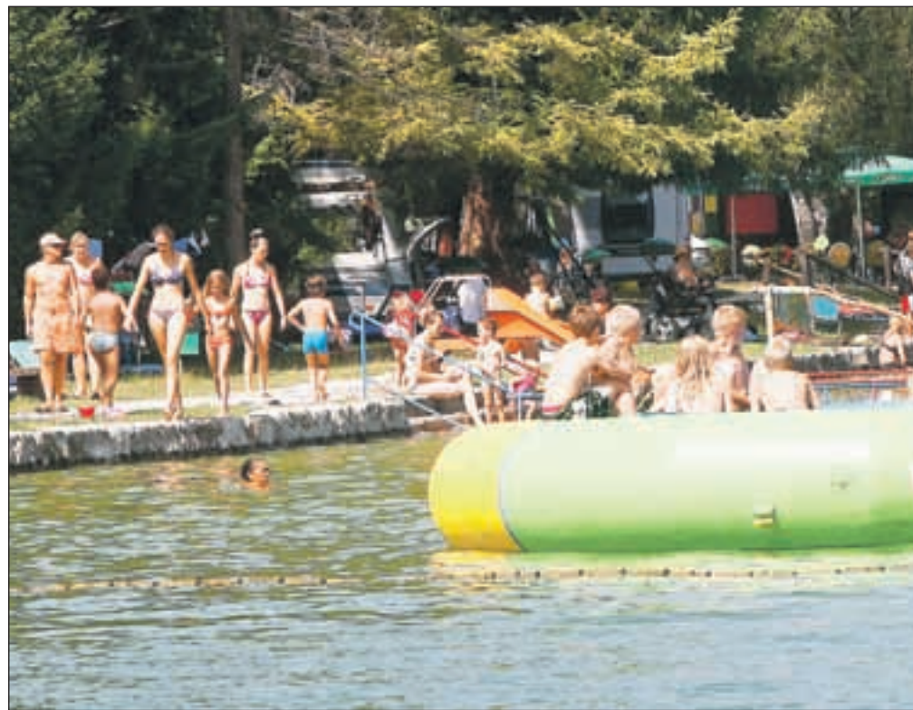
Letošnja turistična sezona bo na Šobcu v vseh ozirih rekordna.

Gašperin uspešno sezono pripisuje tudi sicer odličnemu kampu v privlačnem naravnem okolju, novim načinom trženja, ki ga uveljavljajo v zadnjem času, pa tudi splošnim trendom na področju turizma, ki se v zadnjem času spreminjajo prav Šobcu v prid. »V vsej Sloveniji letos beležijo največji padec italijanskih gostov, ki jih je pri nas tradicionalno malo, le okoli tri odstotke. Po drugi strani se vzpenja število nizozemskih turistov, ki pri nas ustvarijo največ nočitev, pa tudi splošna priljubljenost kampiranja v Evropi raste.«