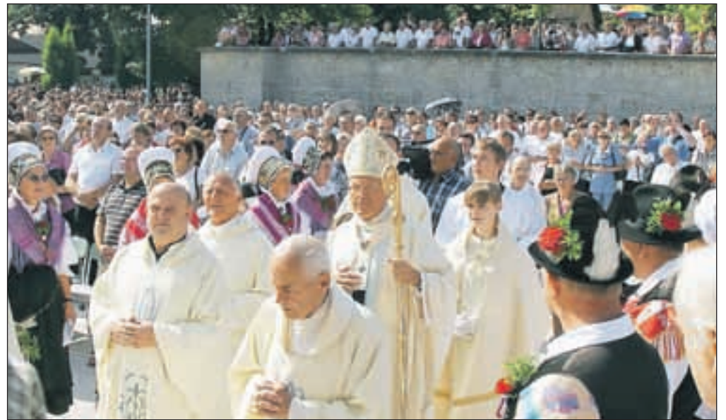
Na Brezjah je skupaj z nekaterimi sobraty pred več tisoč romarji maševal ljubljanski nadškof dr. Anton Stres.

Osrednja slovesnost v ljubljanski nadškofiji je bila na Brezjah, kamor se je po ocenah redarjev z okrog 1700 osebnimi avtomobili pripeljalo okrog 5000 romarjev. Maševal je ljubljanski nadškof metropolit dr. Anton Stres, ki je v pridigi govoril predvsem o Mariji kot materi Cerkev in njeni vzornici. »Če ne bi bilo Cerkev, ne bi bilo vere, ki jo napajamo iz istega tisočletnega verskega izročila naših prednikov. Cerkev nas tudi vzgaja k ljubezni do bližnjega. Spodbuja nas, naj pomagamo bra-