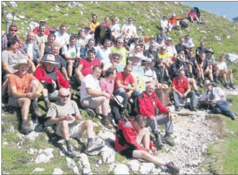
Udeleženci letošnjega pohoda na vrhu Stola

»Zelo sem zadovoljen z letošnjo številko udeležencev. Zanimiva je tudi starostna razlika in sicer od 7 do 88 let. Čez dve leti nas čaka jubilejni 40. pohod in zelo bi