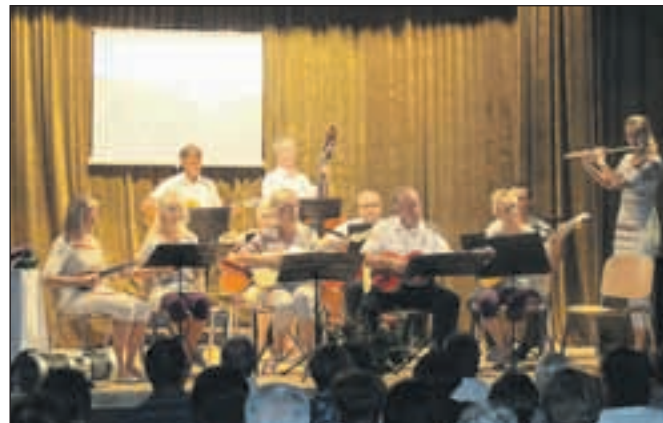
KS Ljubno 24. avgusta praznuje krajevni praznik v spomin na dan, ko so v Ljubnem pred 71 leti ustrelili pet talcev, domačinov. Tudi letos je na slovesnosti nastopil tamburaški orkester.

Ob tem pa je opozoril tudi na številne projekte, ki še niso uresničeni. »V proračunskem obdobju za leti 2013 in 2014 pričakujemo,