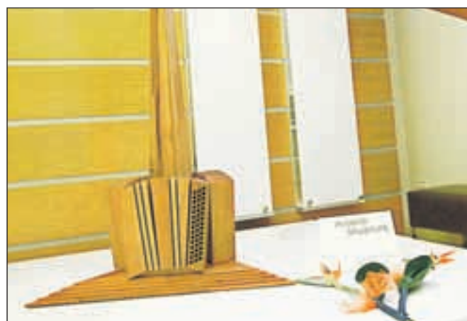
Maketa skulpture, posvečene Avsenikovi glasbi