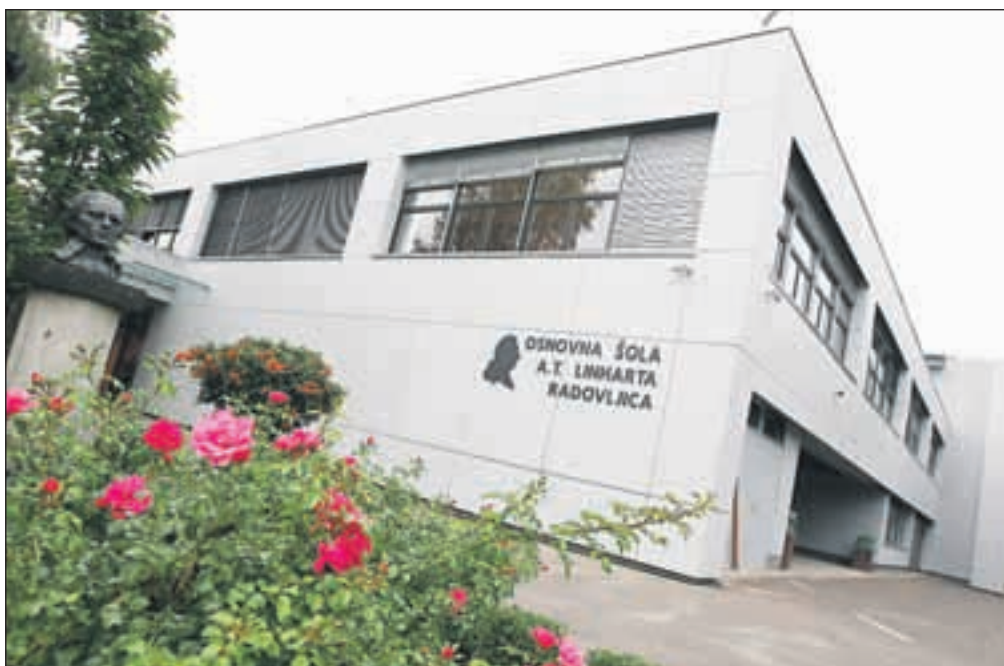
Do konca šolskih počitnic je bila končana prva faza energetske obnove osnovne šole A. T. Linhartarja. Obnovo bodo nadaljevali v prihodnjih dveh letih.

Za obnovitvena dela in vzdrževalna dela, ki so jih v času teh šolskih počitnic izvajali na osnovnih šolah, je sicer Občina Radovljica letos namenila približno 330 tisoč evrov. Med večjimi posegi so nadaljevanje zamenjave oken in energetska sanacija dela fasade OŠ Antona Tomaža Linhartarja Radovljica, obnova sanitarij na OŠ F. S. Finžgarja Lesce in v garderobi telovadnice OŠ Staneta Žagarja Lipnica, ureditev zunanega atrija v leški osnovni šoli in nadstrešnice za šolski kombi OŠ Antona Janše Radovljica. Kot pojasnjujejo na