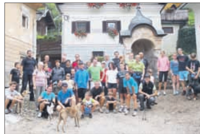
Na pot od Langusove ulice do Langusove Kamne Gorice se je odpravilo 21 pohodnikov in 23 tekačev.