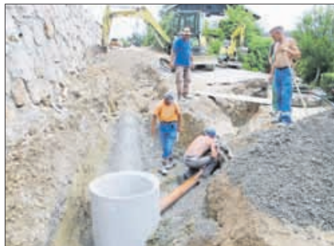
Zahtevnejši del obnove ceste v Vaze je končan. V prihodnjih letih krajanje pričakujejo dokončno sanacijo in začetek obnove ceste v Otočah.

so sedaj odprte možnosti za pripravo načrtov in izvedbo samega projekta čistilne naprave na Posavcu. Sedaj ni