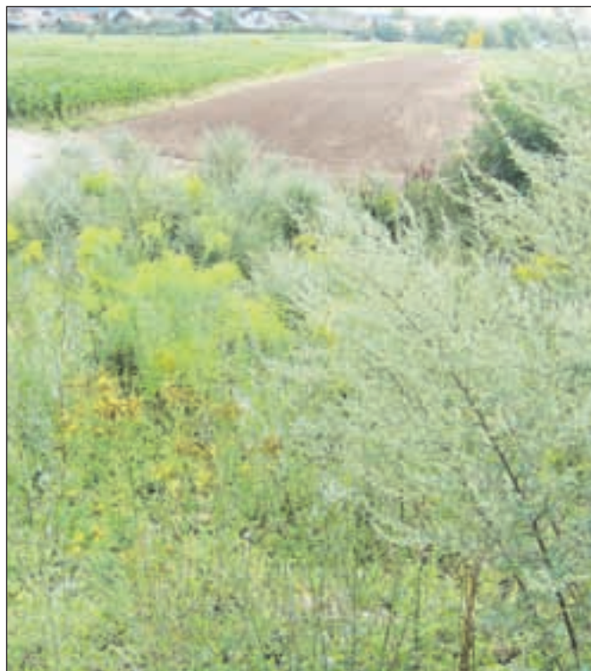
Zlata rozga (levo) in pelin

be odredi različne ukrepe zatiranja. Ne moremo pa odrediti nikakršnih ukrepov v zvezi z drugimi vrstami rastlin, čeprav se tudi za nekatere med njimi ugotavlja določena invazivnost ali alergičnost,« nam je sporočil Andrej Potočnik s Fitosanitarne inšpekcije. Omemba ambrozije v prispevku Odstranjevali invazivne rastline pod sliko zlate rozge bralce deloma zavaja. Na podlagi te slike nam prijavljajo rastišča ambrozije, čeprav gre v resnici za rastišča zlate rozge. Zlato rozgo sicer lahko uvrstimo med invazivne rastline. Med alergeni rastlinami pa niti ni vedno navedena in v tem smislu niti zdaleč ni tako nevarna kot ambrozija.«