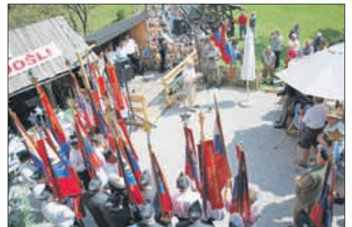
Osrednje prizorišče slovesnosti na Vodiški planini, kjer se je preteklo soboto zbralo okoli tisoč ljudi.