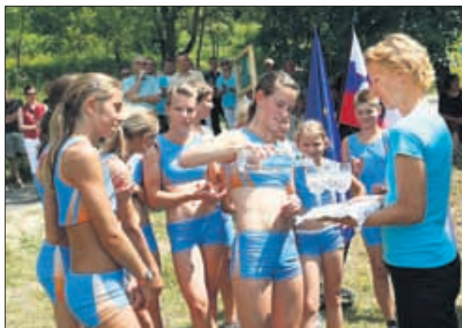
Vodo so iz vseh vasi pod Dobrčo do cerkve Sv. Lucije prinesli mladi člani Atletskega kluba Radovljica.

pozvala, naj se v čim večji meri priključijo na zgrajeni vodovodni sistem. »Vsi vemo, da je voda vir življenja in pogoj za zdravo življenje, zato vabim vse tiste vaščane, ki se še niste priključili na javni vodovod, da načrtujete tudi to investicijo, saj bo to vaša dolgoročna investicija.«