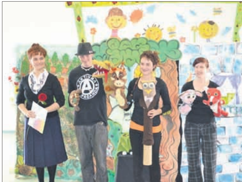
Teater Mundi s predstavo Zelenjavčkarji