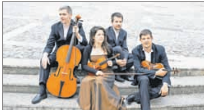
Ansambel Musica Cubicularis bo nastopil že četrtič.