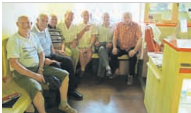
Nekdanji uslužbenci Plamena ob odprtju nove razstave

matic, kar je vodilo k industrializaciji naselja.«