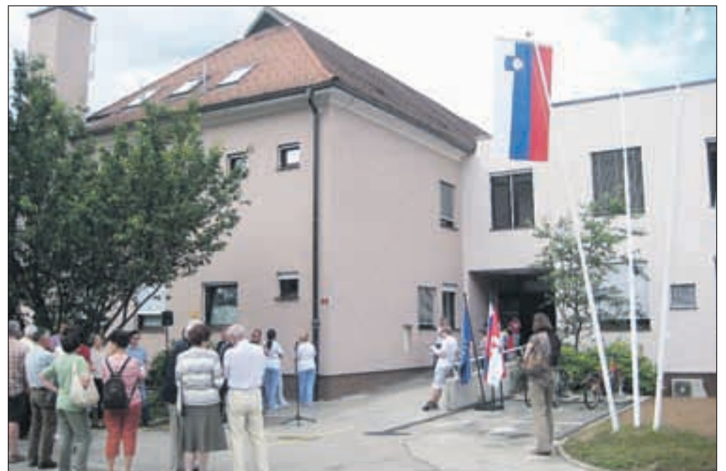
V Radovljici so zaključili energetske sanacije leta 1974 zgrajenega zdravstvenega doma.