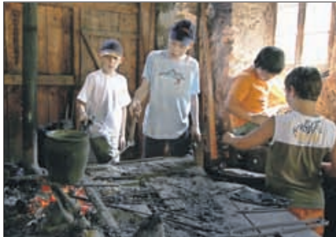
Živahno v vigenjcu Vice