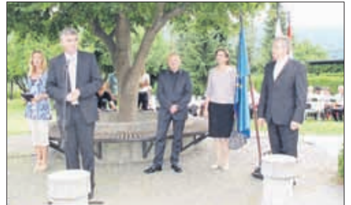
Slavnostni govornik na letošnji slovesnosti ob dnevu državnosti je bil evropski poslanec dr. Milan Zver.