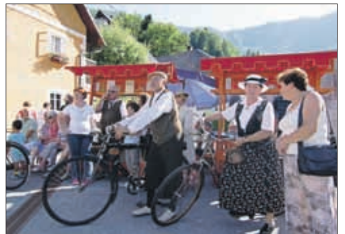
Na starih kolesih skozi Krope