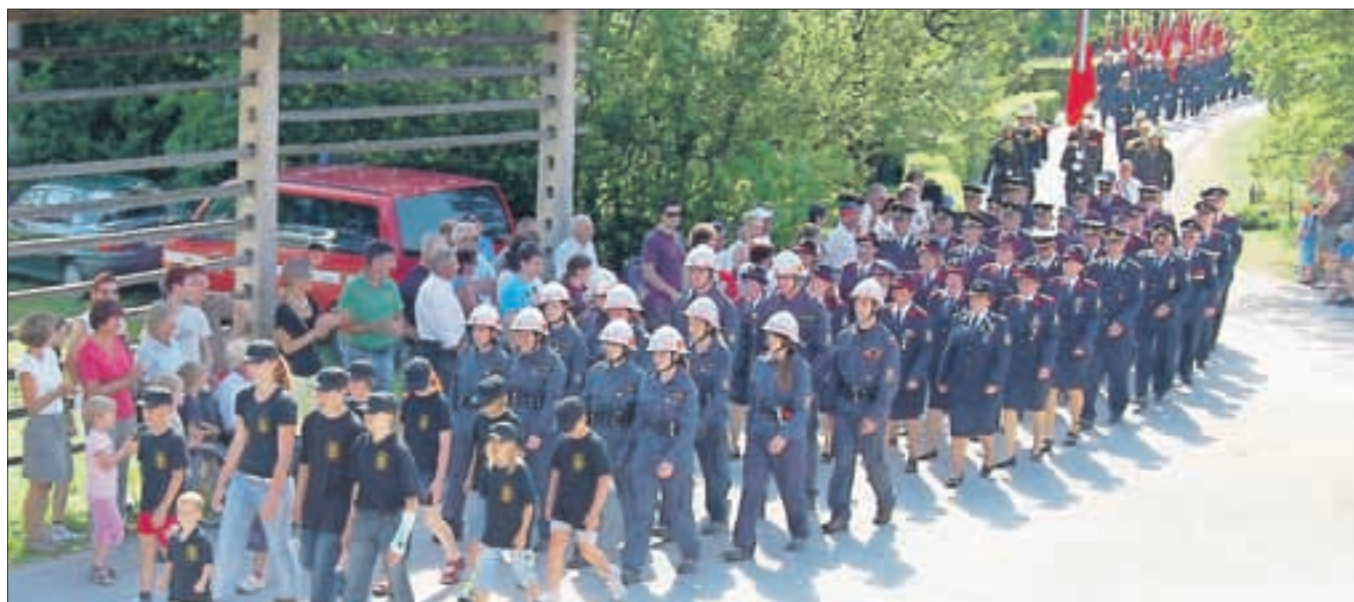
Najbolj slovesna je bila gasilska parada.

podeželsko društvo na Gorenjskem. Danes združuje blizu 300 članov in je prepoznano tako v občini kot tudi širše. Še posebej izstopajo s svojimi tekmovalnimi dosežki, saj se njihove ekipe vseskozi uvrščajo na najvišja mesta na državnem in tudi olimpijskem nivoju.