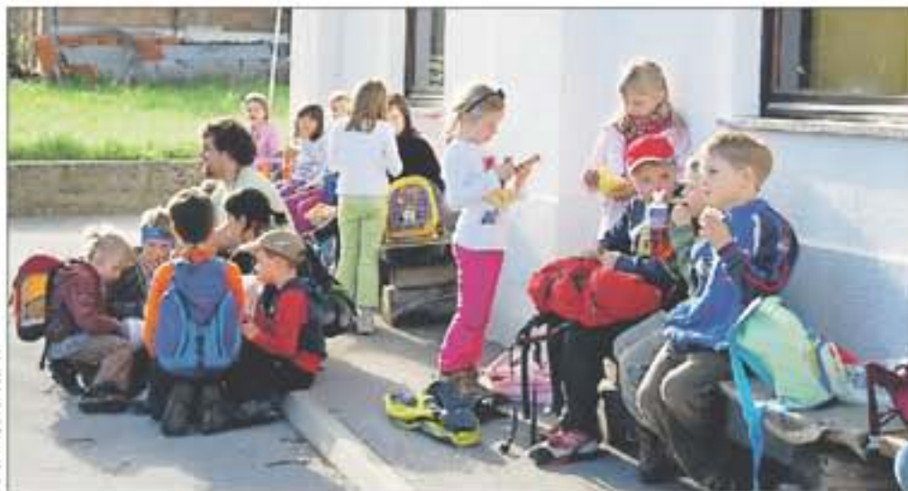
Vsi planinci so uspešno našli skriti zaklad in opravili s preizkušnjami na terenu.

Vsi planinci so uspešno našli skriti zaklad in opravili s