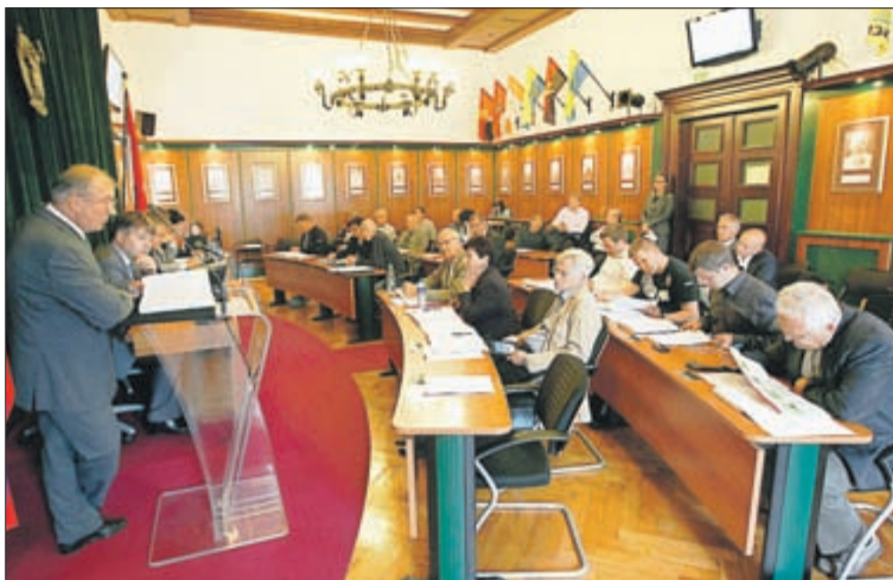
Občinski svet se je konec maja sestal na svoji 16. redni seji.

Svetniki so na zadnji seji sprejeli še osnutek sprememb in dopolnitev odloka o preoblikovanju Osnovnega zdravstva Gorenjske. Razveljavili pa so občinski pravilnik o oddajanju poslovnih prostorov in garaž v najem ter določanju najemnina, ker se zaradi neskladja z določili zakona in uredbe o stvarnem premoženju države in samoupravnih lokalnih skupnosti ne uporablja več. Zakon in uredba namreč natančno določata pogoje in način izvedbe postopka oddaje nepremičnin