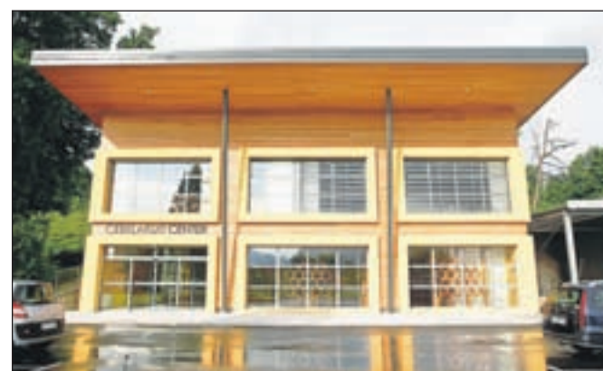
Čebelarški center v Lescah bodo odprli prihodnji mesec.

Slovesno odprtje novega čebelarško izobraževalnega centra bo v petek, 14. junija, dan kasneje pa Čebelarško društvo Radovljica pripravlja dan odprtih vrat.