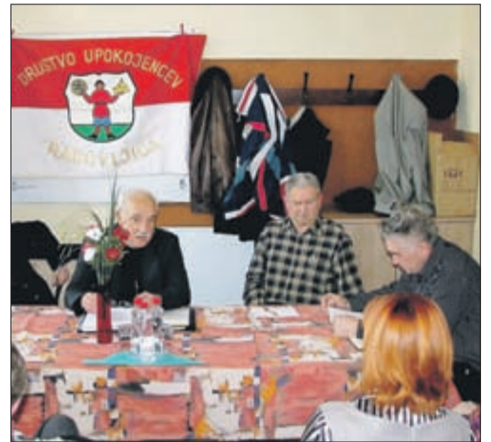
Občni zbor Društva upokojencev Radovljica

V letu 2011 so člani DU Radovljica sodelovali na strelskih in smučarskih tekmo-