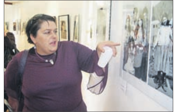
Odprtja razstave, ki je na ogled v razstavnem hodniku Radovljiške graščine, so se udeležili številni predstavniki Sintov.