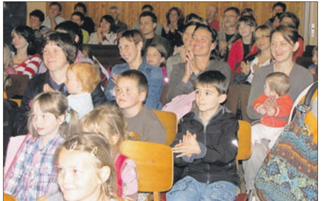
V akcijah za spodbujanje branja med mladimi je letos sodelovalo rekordno število otrok, ki so jih knjižničarji ob koncu šolskega leta povabili na tradicionalne zaključne prireditev.

»Srečanja s tujimi avtorji so zelo zelo redka in je bila to idealna priložnost za izkušnjo, prek katere otroci lah-