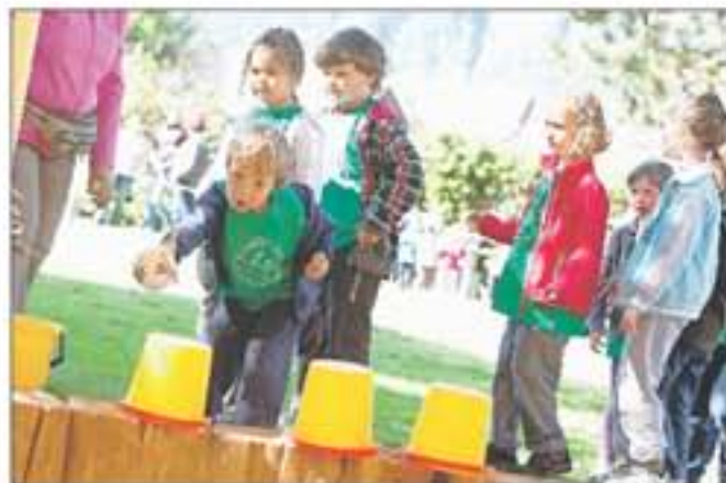
Prireditve je potekala v znamenju pomoči drug drugemu, spoštovanja, spodbujanja zdrave tekmovalnosti in povezovanja.