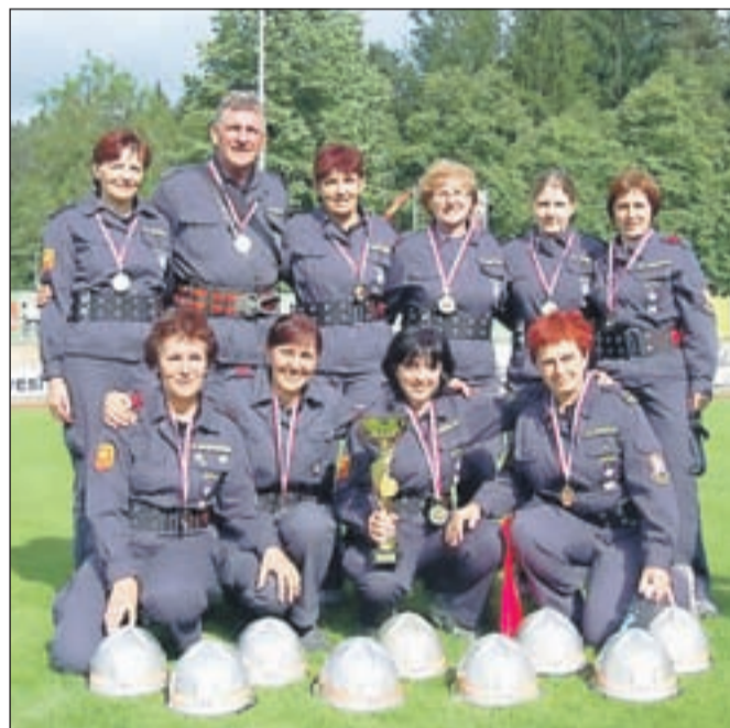
Ekipa članic B PGD Begunje je zmagala na letošnjem državnem tekmovanju v Velenju.