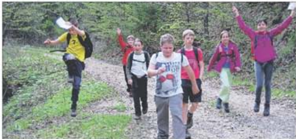
V iskanju skritega zaklada: lažja preizkušnja je bila dolga dobre tri kilometre, težja pa štiri in pol.

preizkušnjami na terenu. «Orientacija ni bila tekmovalne narave, saj je naš