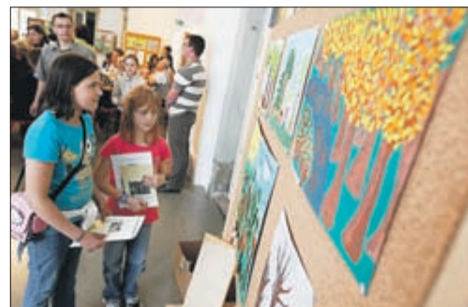
Razstava, ki je bila v avli radovljiške graščine na ogled teden dni, je pokazala, kako si gozd predstavljajo petošolci iz enajstih gorenjskih osnovnih šol.