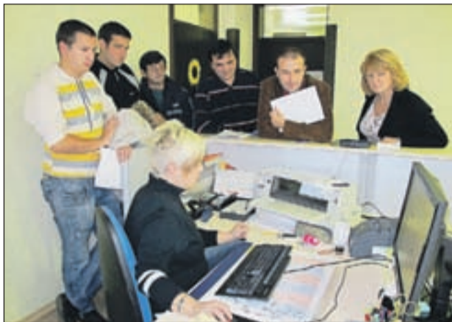
Občinski uslužbenci iz srbskega Svilajнца so si ogledali delo radovljiške občinske uprave, Upravne enote, KS Lesce in javnega podjetja Komunala.