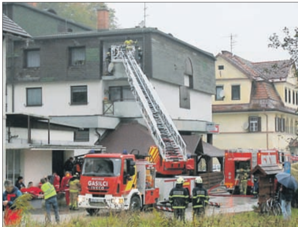
Na izjemno zahtevni vaji so poleg PGD Podnart sodelovali še PGD Ljubno, PGD Radovljica in GARS Jesenice.

Kot je povedal Bine Perič, je namen takih vaj predvsem ta, da se preveri tehnična opremljenost in taktična pripravljenost gasilskih enot, delovanje alarmiranja preko Regijskega centra za obveščanje v Kranju, delovanje radijskih postaj ter vodenje enot v večjem številu. "Po vaji sledi tudi analiza vaje, opazke in pripombe pa bodo v prihodnje upošteevane pri operativnih postopkih." Na vaji je bila predstavljena tudi 42-metrski avtolestev Gasilsko-reševalne službe