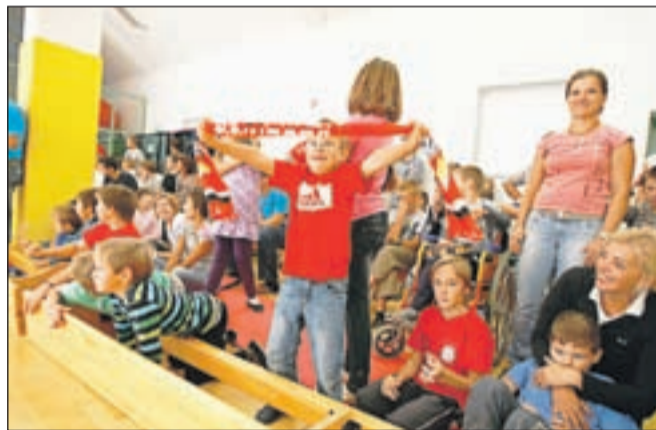
Strastni navijači HK Acroni Jesenice so tokrat enako navdušeno navijali za obe ekipi.