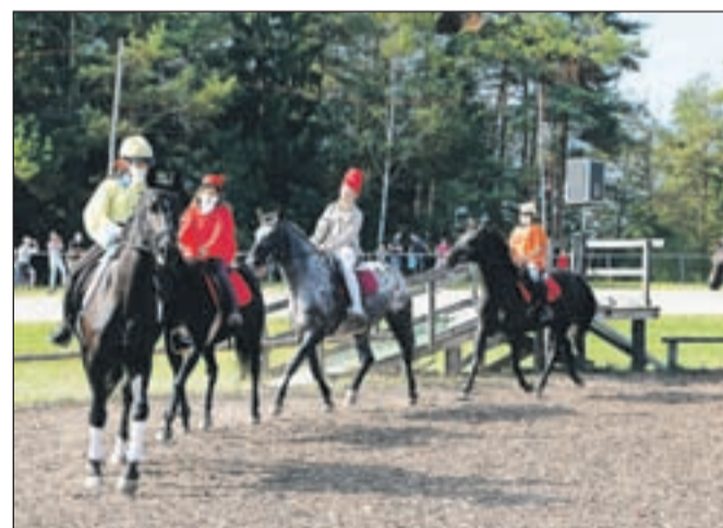
Najmlajši člani konjeniškega kluba Lesce-Bled so na prizorišče prihajali oblečeni v pravljicne kostume.