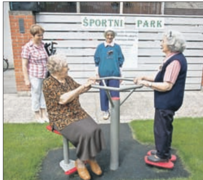
Za uporabo športnih igral vlada v domu veliko zanimanje. Stanovalci jih uporabljajo tako pod vodstvom terapevtov kot skupaj s svojci ali pa kar sami.