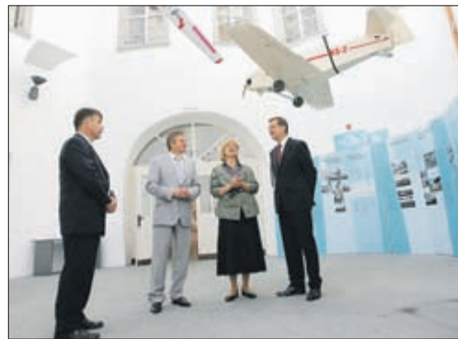
Lojze Peterle si je z zanimanjem ogledal tudi razstavo Letalstvo v modelih v Graščini.