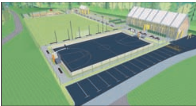
Takole naj bi bil po načrtih arhitekta Igorja Šubica, radovljčana, ki se v lastnem podjetju ukvarja z arhitekturnim projektiranjem - videti športni park na travniku med obema vasema.

store igrišča, večnamenski pokrit prostor za vadbo na orodjih, ki bo lahko služil tudi za prireditve, in manjši gostinski lokal, ki se bo delno lahko predelil tudi v volišče ali sobo za sestanke.