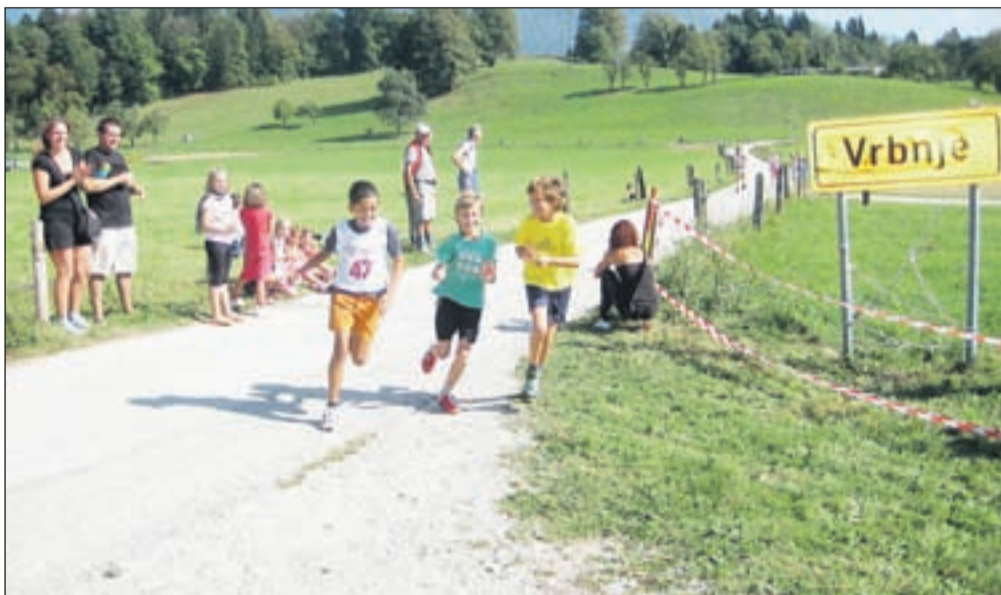
Tekaških tekmovanj se je udeležilo okoli sto športnih navdušencev. Najprej so se na tekaško progo pognali najmlajši.

"Gre za prostor, kjer se že od nekdaj zbirajo domačini dveh vasi. Ne ena ne druga za zdaj nimata prostorov z javno vsebino - ne trgovine, lokala, niti cerkve ne volišča. Zato si prizadevamo, da bi na mestu, kjer so zdaj urejena igrišča, lahko postavili racionalno zgrajen kompleks, ki bi zadovoljeval tako rekreativne kot nekatere druge javne interese in predstavljal nekakšen novi skupni center za obe vasi. Tako bi kompleks poleg igrišč na prostem vseboval tudi servisne pro-