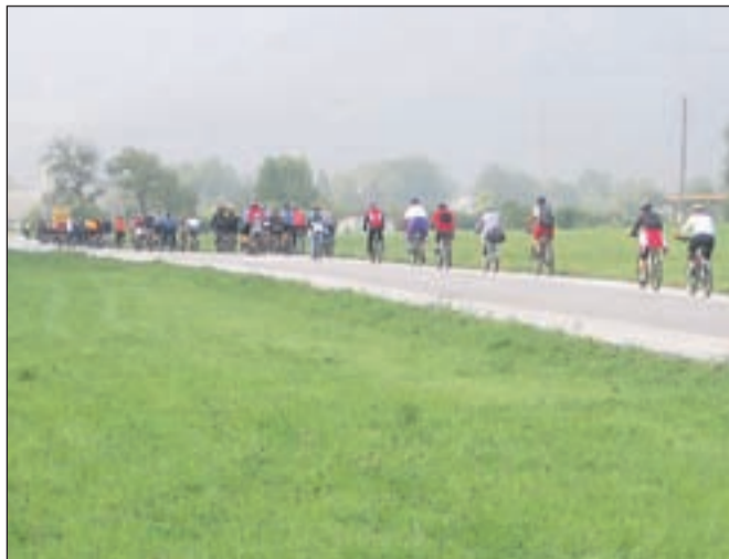
Kolona kolesarjev je bila letos še posebej dolga.