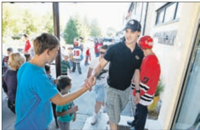
Vsa šola je bila na nogah, ko so v ponedeljek malo čez deseto jeseniški hokejisti prišli v Radovljico.