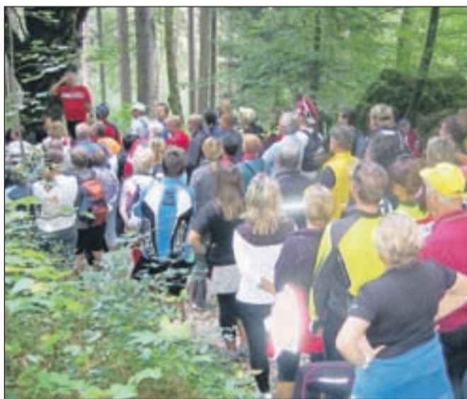
Peš po Brezjanski poti miru