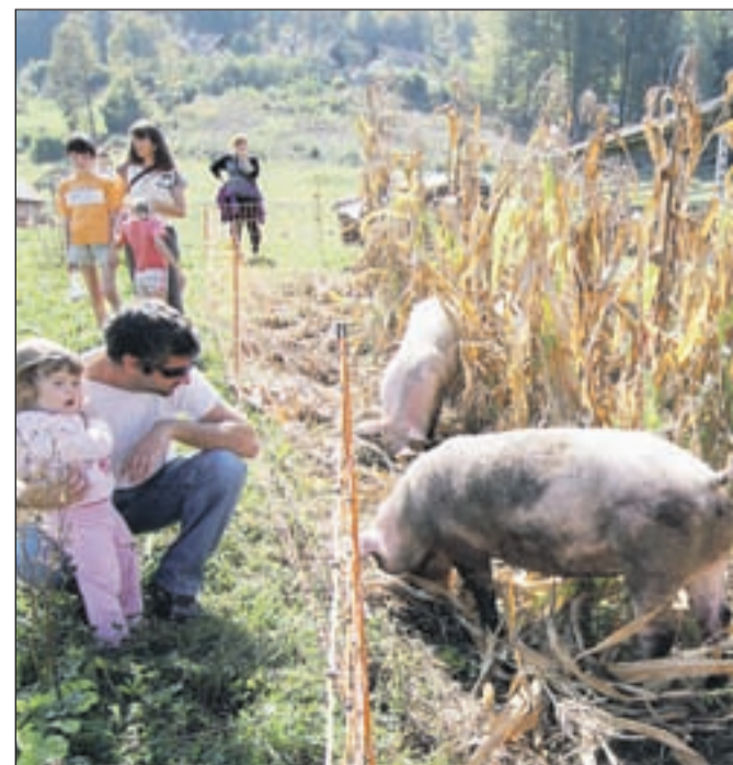
Na kmetiji si je bilo mogoče ogledati, kako in kje v skladu z ekološkim kmetovanjem bivajo živali.