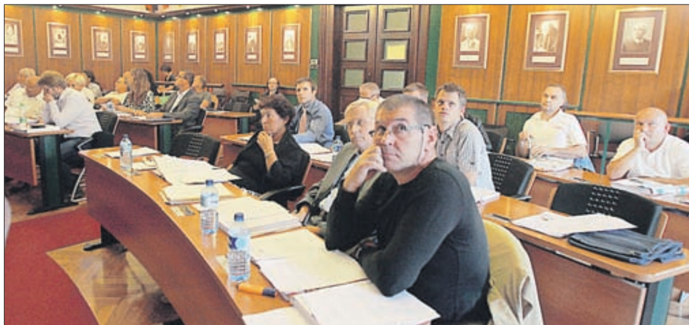
Občinski svet se je na redni seji sestal zadnjo sredo v septembru. Prihodnja seja je načrtovana za konec novembra.