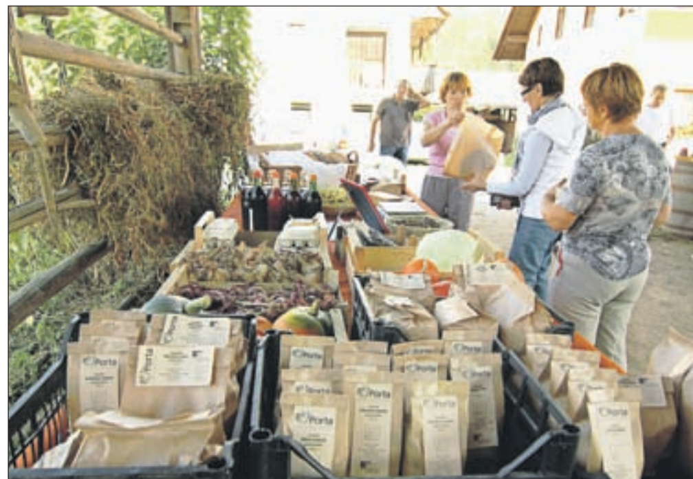
Na dnevu odprtih vrat je bilo mogoče kupiti raznobarvne pridelke ekoloških kmetij Porta iz Ovsiš in Potočnik z Brezij.

Kot je povedala Mimi Fister, zanimanje za ekološke pridelke narašča tako med potrošniki kot ponudniki, namen dneva odprtih vrat pa je ozaveščanje, izobraževanje in vpogled v delovanje ekološke kmetije. "Z orga-