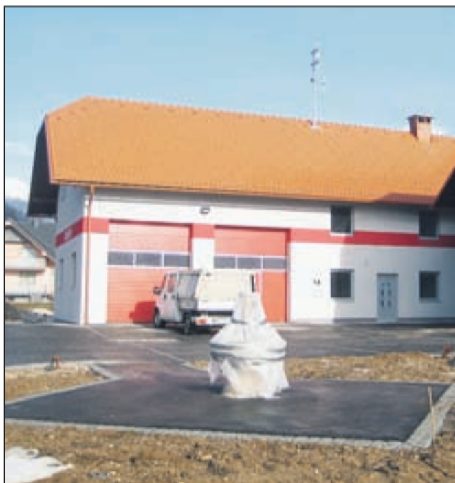
Novi gasilski dom v Mošnjah. V njem so uredili tudi informacijsko pisarno, ki bo izhodišče arheološke poti skozi vas vse do Ville rustice.