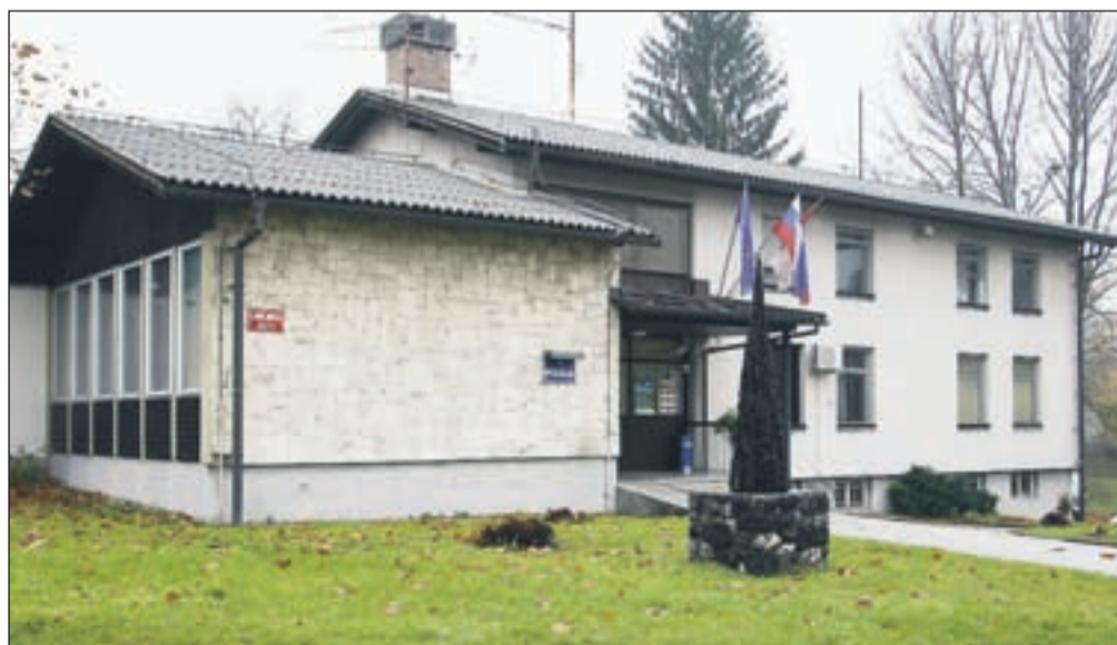
Stavba Policijske postaje Radovljica je bila zgrajena leta 1964 in je potrebna čimprejšnje celovite obnove, saj so delovni pogoji za policiste zelo slabi, neustrezni so tudi prostori za stranke.

"S sprejetjem predloga menjalne pogodbe smo zadovoljni," so odločitev vlade komentirali na Policijski upravi Kranj. "Pogodba bo namreč omogočila ureditev lastniško-pravnih razmerij za stavbo Policijske postaje Radovljica, kar bo v prihodnosti omogočilo izvedbo investicijskih vlaganj v objekt. Stavba je bila zgrajena leta 1964 in je potrebna čimprejšnje celovite obnove, saj so delovni pogoji za policiste zelo slabi, neustrezni so tudi prostori za stranke. Višina finančnih sredstev, ki bo potrebna za obnovo, bo znana v prihodnosti, ko bo izdelan natančen popis del. Čas obnove pa je seveda odvisen od finančnih možnosti proračuna RS," je sporočil tiskovni predstavnik PU Kranj Leon Keder. Z menjavo je zadovoljna tudi občina, ki je v zameno za zemljišče ob policijski postaji pridobila nekaj manj kot