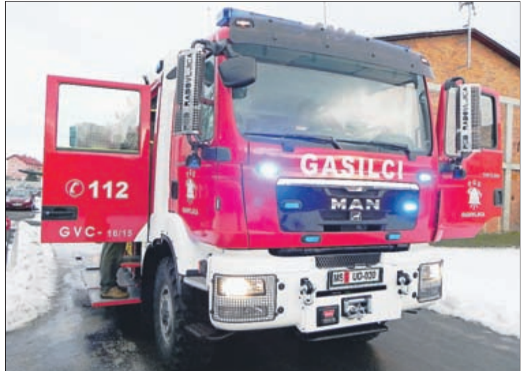
Nadgradnja vozila je izdelana tako, da je vsak še tako majhen prostor koristno uporabljen za pritrjevanje potrebne opreme.

Pred približno letom dni je Komisija, odgovorna za nakup novega vozila, pripravila javni razpis, na katerem je bilo izbrano podjetje Mettis international iz Gornje Radgone. Po vseh usklajeva-