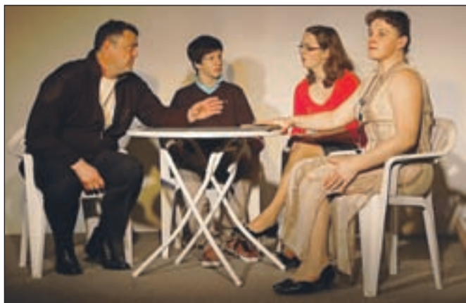
Komedijo v dveh dejanjih Bolje tič v roki kot tat na strehi si lahko znova ogledate na Dobravi v petek, 11. februarja, ob sedmih zvečer.

Amaterska igralska skupina Društva prijateljev mladine Srednja Dobrava deluje že vrsto let. Skupina je ponosna, da se kljub številnim drugim obveznostim, kot so služba, študij, družina, srečujejo enkrat na teden in "se grejo gledališče". Najnovejša igra, ki so jo naštudirali v dobrih treh mesecih, je komedija Matjaža Zupančiča Bolje tič v roki kot tat na strehi. Premiera je bila v nabito polni dvorani na Srednji Dobravi 23. januarja, 28. januarja pa je skupina že gostovala v Kropi in tudi tam napolnila veliko dvorano kroparskega kulturnega doma. Skupina ima deset članov z Dobrave, Kropo, Zaloš in Prezrenj, in je tudi generacijsko zelo pestra. V njej so tako dijaki kot upokojenci. Komedijo v dveh dejanjih si lahko znova ogledate na Dobravi v petek, 11. februarja, ob sedmih zvečer, sledijo pa tudi gostovanja na Lancovem, v Dražgošah in morda še kje. K. B.