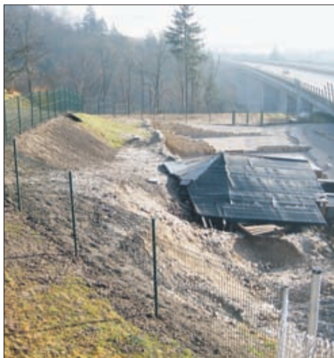
Lani so okoli arheološkega najdišča Villa rustica med vasjo in avtocesto postavili ograjo in uredili dostopne poti znotraj nje.