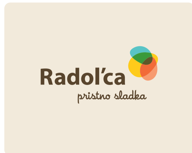
Podoba nove destinacijske znamke Radovljice

marca 2009. Dogovarjanje je trajalo leto in pol predvsem zato, ker je bilo treba uskladiti enakovredno menjavo občinske nepremičnine z državno glede na njuno velikost in vrednost."