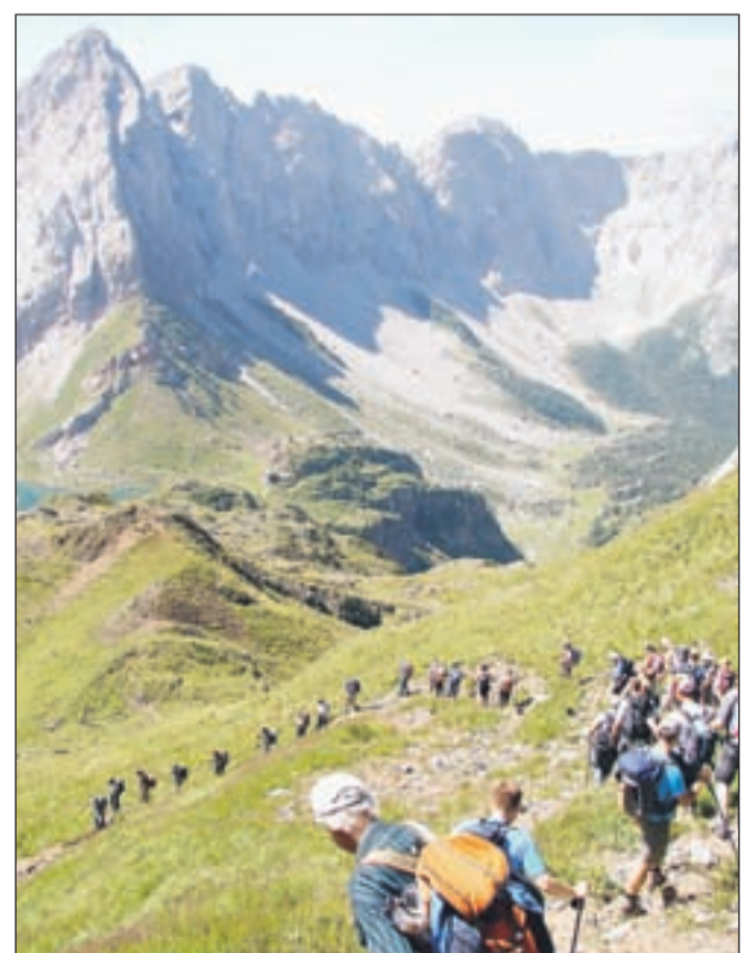
Planinci na eni od svojih planinskih tur

V letu 2010 je bilo planiranih 22 planinskih tur, realizirali so jih 17. Nekaj jih je odpadlo, predvsem zaradi slabega vremena. Lani se je pohodov udeležilo 311 pohodnikov, kar je povprečno 18 na pohod. Najpomembnejše vodilo vodniku na turi je, da se vsa skupina varno vrne domov. Kot je povedala Jana Remic, vodniki sodelujejo tudi pri drugih akcijah, kot je pomoč pri vodenju šolskih otrok, kjer so sodelovali z mladinskim odsekom; organizirajo, pomagajo in sodelujejo pri različnih prireditvah in delovnih akcijah, skrbijo pa tudi za izobraževanja in usposabljanja. Pester dejavnost je v veselje pohodnikom in planincem, zadovoljni pa so tudi vodniki. Tudi na ture letošnjega programa vabijo vse, ki radi zahajate v naravo, da se jim pridružite.