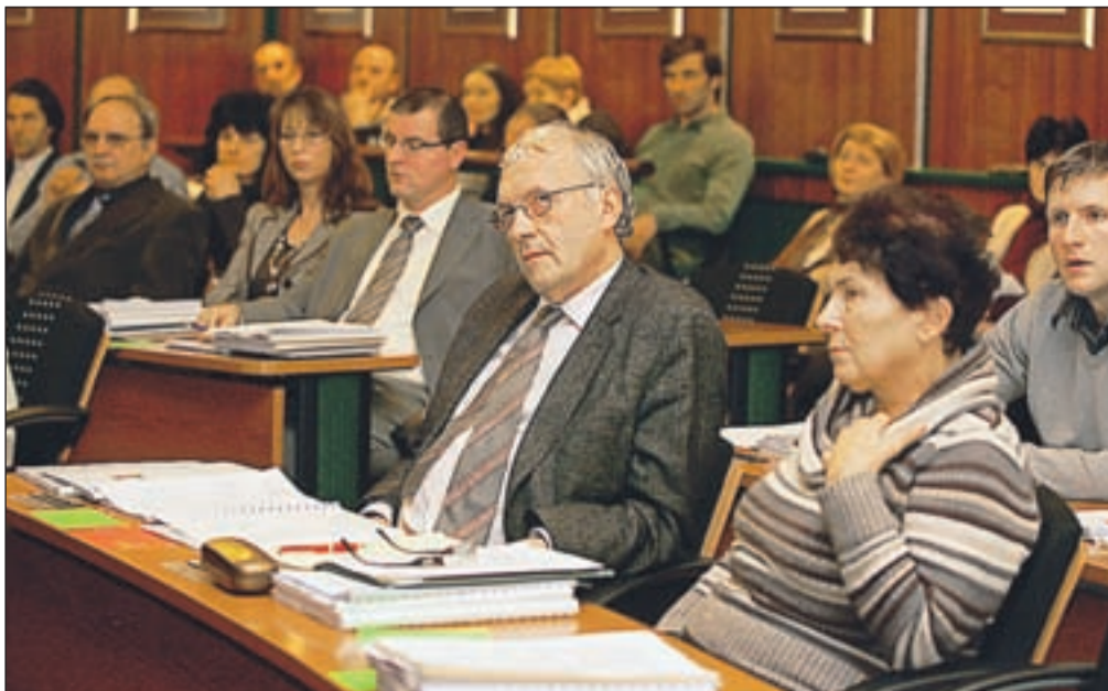
Na predlog Statutarne pravne komisije je bil osnutek proračuna tokrat samo predstavljen skupaj z izhodišči za njegovo pripravo. Svetniki so za oblikovanje pripomb želeli imeti na voljo več časa.