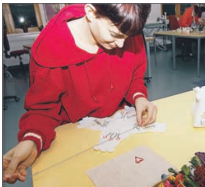
V radovljiškem Varstveno delovnem centru v teh dneh pripravljajo izdelke z valentinovimi motivi.

Trgovinca, ki je svoja vrata tik ob delavnicah Varstveno delovnega centra v Radovljici odprla decembra, je po besedah vodje prodajnega programa, Matjaža Arnola, zadovoljna z odzivom. Obisk je bil dober, najbolj pa so šli v promet izdelki nižjega cenovnega razreda. Zaradi dobrih odzivov tudi s strani varovancev delovnega centra, ki so najbolj veseli, če se proda kakšen njihov izdelek, bodo z lastnim programom nadaljevali preko celega leta. Izkazalo se je, da nekateri varovanci raje izdelujejo lasten program, medtem ko drugi želijo še naprej sodelovati tudi pri drugih delovnih procesih v VDC-ju. Tem so omogočili mesečno kroženje v centru. Matjaž Arnol poudarja, da je lastnega programa zaenkrat še vedno premalo, da bi se lahko finančno sam pokrival, je pa vsekakor to njihov cilj. Le tako bodo namreč vedno lahko zagotovili delo na lastnem programu tistim varovancem, ki si tega želijo. Da bi bili vedno aktualni, ravnokar pripravljajo izdelke na tematiko valentinovega in že tudi izdelke s spomladanskimi motivi. K. B.