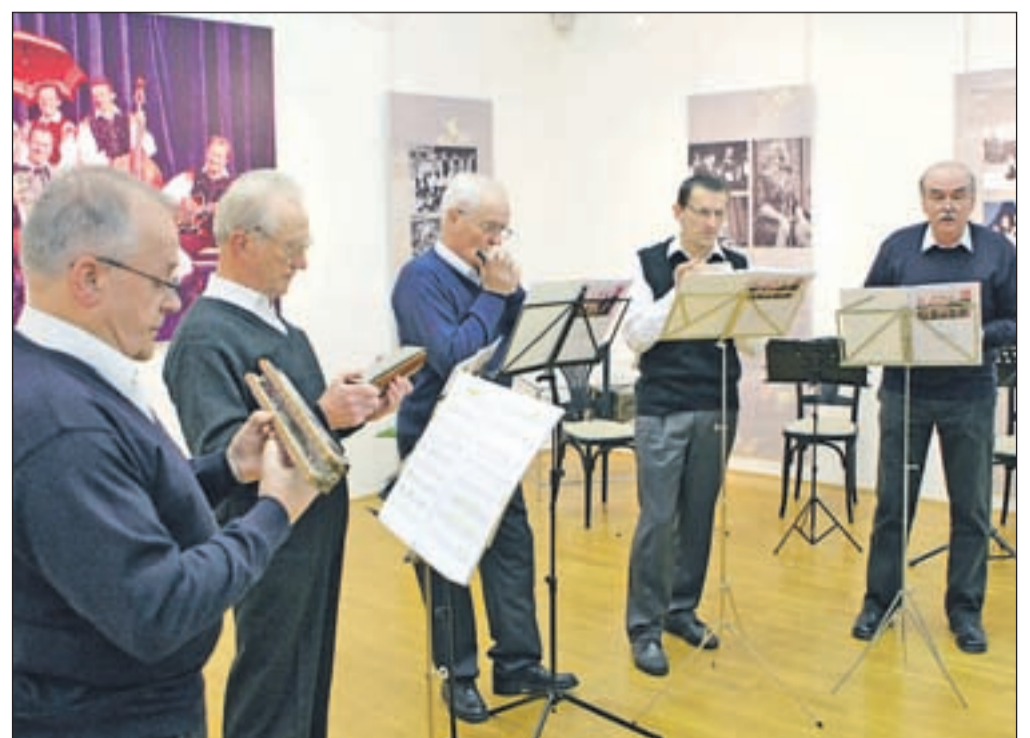
Orgličarski kvintet Veterani med nastopom pri Avseniku

pevko. Javno so prvič nastopili na koncertu Avsenikove melodije malo drugače 21. decembra lani v radovljiški Graščini. Veterani, ki na odru ne delujejo prav nič "veteransko", so odločeni, da bodo igrali, dokler bodo zmogli in jih bodo ljudje poslušali.