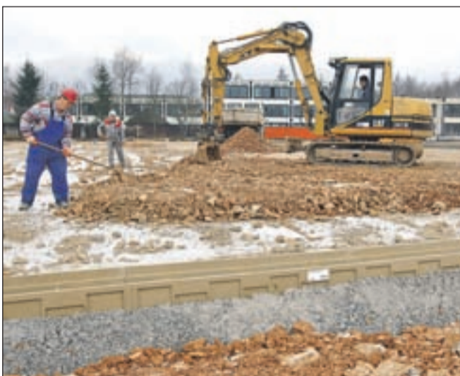
Atletski stadion ob osnovni šoli bo nared do konca šolskega leta.