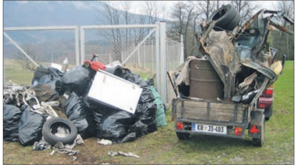
Člani lovske družine Begunjščica so na območju svojega lovišča vendarle našli tudi ostanke avtomobila. Najbolj neprijetno pa je bilo pobiranje v plastične vrečke zavrtih pasjih iztrebkov iz grmovja, so povedali lovci.