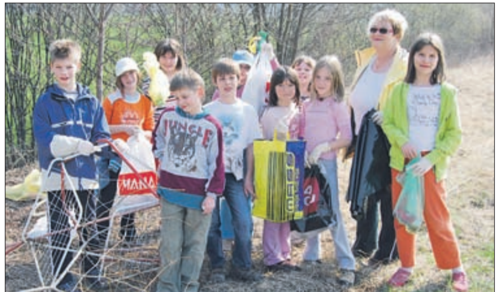
Turistično društvo, osnovna šola in krajevna skupnost Begunje so tudi letošnjo pomlad pripravili čistilno akcijo Očistimo naš kraj. Učencem, učiteljicam in članom turističnega društva so se v skrbi za prijazno okolje priključili krajanje in skupaj očistili glavne prometne poti in središče kraja. Tudi tokrat so nabrali veliko odvrženih pločevink, plastenk, vrečk in drugih odpadkov, ki sodijo vse kam drugam kot pa v naše okolje. P. K.