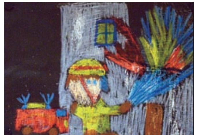
Lukova slika prikazuje gasilca med gašenjem objekta.