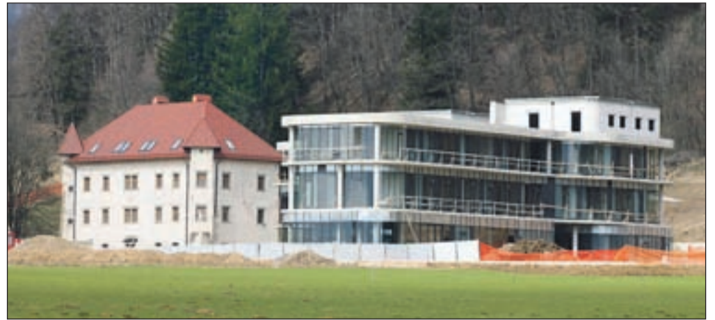
V ozadju kompleksa investitor načrtuje gradnjo manjšega igrišča za golf.

"Smo med redkimi, ki si v času krize upamo nadaljevati z investicijo. Projekt smo začeli pred štirimi leti in v tem času so se razmere zelo spremenile, čemur smo se prilagajali tudi mi. Tako smo v kompleksu zagotovili več sob - od prvotno načrtovanih 31 jih bo zdaj 43, v kletnih prostorih smo