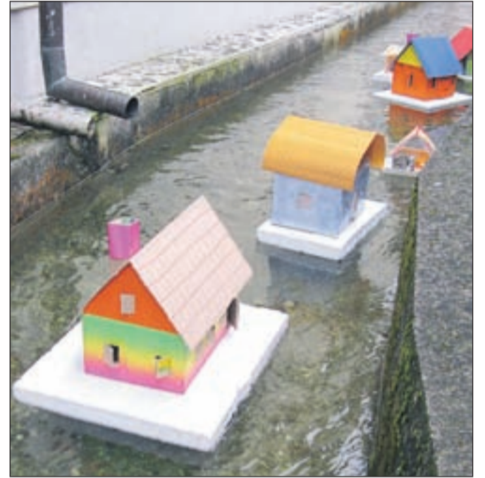
Lani se je na gregorjevo v Kamni Gorici zbralo še posebej veliko ljudi.