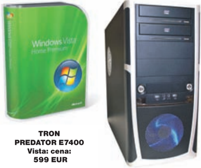
TRON PREDATOR E7400 Vista: cena: 599 EUR

Trgovina Comshop v Mercator TC Lesce ima dobro založene police s kakovostno ponudbo artiklov s področja računalniške, avdio, video, foto in navigacijske opreme. Na področju računalnikov vas bo pričakala lastna blagovna znamka Tron, odlični serijski računalniki ali računalniki po naročilu s kakovostnimi deli najboljših svetovnih proizvajalcev računalniških komponent, med prenosniki lahko izbirate med blagovnimi znamkami Acer, Apple, Asus, HP, Toshiba, Lenovo in Dell. Za vse računalnike in prenosnike ponujajo originalno Microsoft programsko opremo, monitorje, tiskalnike in multifunkcijske naprave priznanih znamk, tipkovnice, miške in spletne kamere. V Comshopu lahko izbirate še med plazmami in LCD ekrani, si kupite DVD predvajalnik ali kar domači hišni kino. Vsi mladi in mladi po srcu se razveselijo igralnih konzol in iger, ki sodijo zraven, premami pa vas tudi kvalitetna izbira fotoaparátov in dodatna oprema, ki je na voljo. Če razmišljate o mrežni opremi, tudi tu odlična kakovost in konkurenčne cene poskrbijo za nakup znamk kot D-link, Asus, Lixys ali Netgear, ki računalnike povežejo v brezžično ali žično omrežje in na internet.