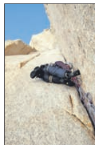
Radovljiški alpinist v vrhnjem delu stene Fitz Roya

ly-Garibotti. Nama je uspela druga ponovitev vzpona v zelo zahtevnih razmerah. Gora je bila letos zelo zasnežena, zato je bilo v steni tudi veliko ledu. Ključen je bil raztežaj v srednjem delu, kjer je bilo v široki ledeni počki težavno varovanje. Celotna stena je zelo strma, kar terja precej kondicije. Vzpon v alpskem slogu in spust je trajal 52 ur. Vrh gore sva dosegla 13. januarja ob 3. uri. Zaradi poslabšanja vremena sva se odločila za sestop po klasični smeri. Pred odhodom domov sva splezala klasično smer na 2570 metrov visoki Guillaume in pomagala reševati Kolumbijce iz stene Mocho ob gori Cerro Torre," je povedal radovljiški alpinist po vrnitvi.