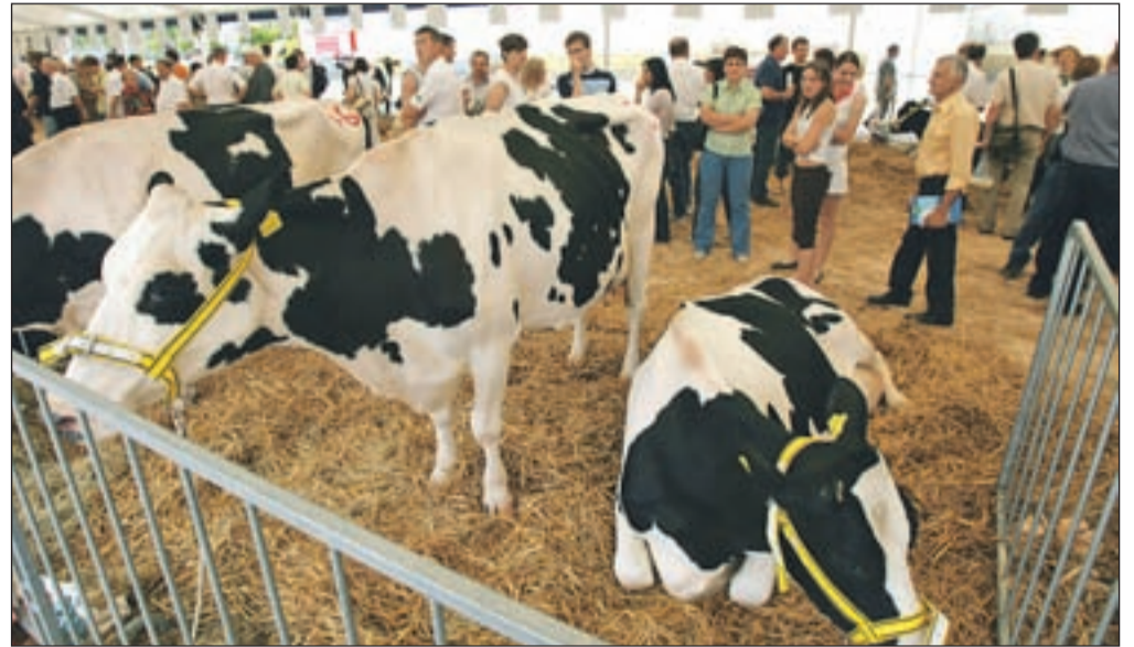
Regijske razstave govedi ni bilo že pet let, zato bo letošnja še toliko pomembnejša.

Govedorejsko društvo Zgornje Gorenjske bo skupaj z govedorejskima društvoma Škofja Loka in Kranj-Naklo-Tržič konec marca priredilo regijsko razstavo govedi, ki je ni bilo že več kot pet let. Razstava bo 28. marca na hipodromu v Lescah. "V rejsko razvitih državah so razstave vsaj vsako drugo leto, kjer je tudi priložnost za dobro prodajo živine in celo embriov. Pri nas so rejske organizacije v zaostanku in ta razstava bo prikaz napredka rejskega dela in trendov. V prihodnje želimo, da bi bile take razstave pogostejše in da bi bile organizirane avkcijske prodaje predvsem plemenskih telic. Društva imamo pri organizaciji razdeljene naloge, ustanovljen je bil organizacijski odbor, v katerem sta po dva člana iz vsakega društva, trije člani iz Kmetijsko gozdarskega zavoda Kranj ter predstavnik Kmetijsko gozdarske zadruge Sava iz Lesc ter predstavnik veterinarske prakse iz Tenetiš.