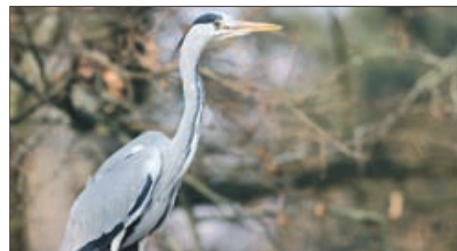
Siva čaplja gnezdi na Obli Gorici v Radovljici

Pomlad, spet doma! Tudi ljudem je prijetneje, ko se vrne ptičji pevski zbor, ki z različnimi melodijami (predvsem samčkov) označuje teritorij in vabi svojo boljšo polovico. Ko je "ženka" osvojena, so sladki napetvi vse redkejši (hm, ali to ne spominja tudi na neke druge samce?), samske pa k petju še naprej spodbujajo hormoni (testosteron). Pri