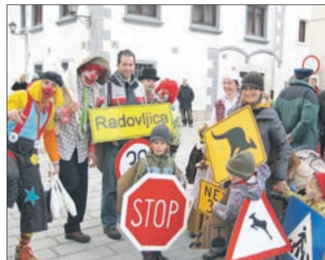
Aktualne maske na Linhartovem trgu