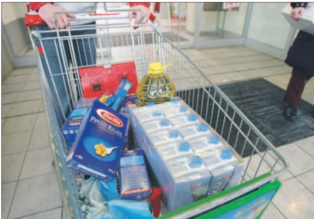
Čeprav je stanje v radovljiški občini pod gorenjskim povprečjem, brezposelnost in socialna stiska naraščata tudi pri nas.

Še junija lani je bila brezposelnost v občini na najnižji stopnji doslej: na uradu za delo so imeli v evidenci 268 iskalcev zaposlitve, kar je pomenilo 3,4-odstotno brezposelnost - precej pod gorenjskim in slovenskim povprečjem. "Sledila sta relativno podobna julij (269) in avgust (274), število brezposelnih pa je začelo naraščati septembra (300) in se konec decembra povzpelo na 352. Konec januarja je bilo na Zavodu za zaposlovanje prijavljenih 408 iskalcev zaposlitve," je povedala Mojca Klement , vodja urada za delo Radovljica. "Še pred pol leta na Zavodu ni bilo prijavljenih dovolj ljudi, da bi lahko ustregli vsem delodajalcem, ki so iskali delavce. V le šestih mesecih se je stanje postavilo na glavo. Povpraševanja je sicer še nekaj, a bistveno manj kot prej." Kot je povedal radovljiški župan Janko Sebastijan Stušek,