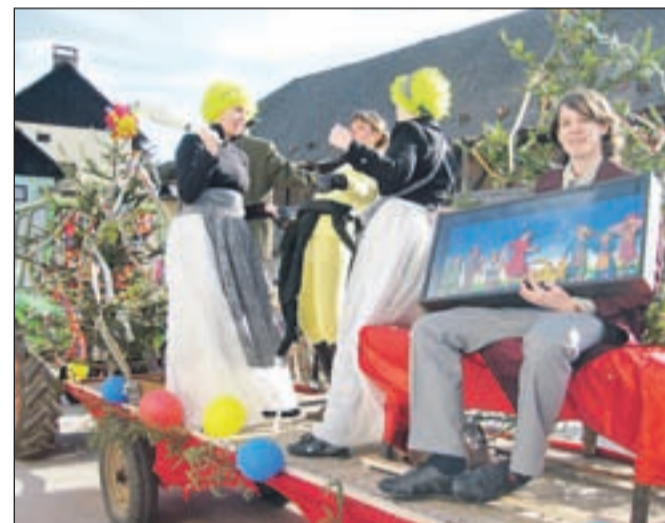
Predtrška bolha na enem od vozov v sprevodu