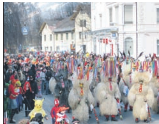
Na obisk so prišli kurenti.

Na pustno soboto se je po radovljiških ulicah trlo velikih in malih maškar. Tokrat se je imenitne prireditve, ki jo tradicionalno pripravlja domače turistično društvo, udeležilo še posebej veliko ljudi.