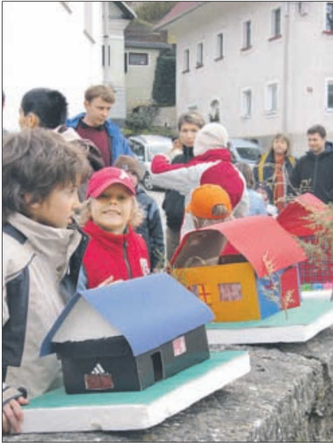
Barčice po rakah v Kamni Gorici in Kropi najraje spuščajo otroci.