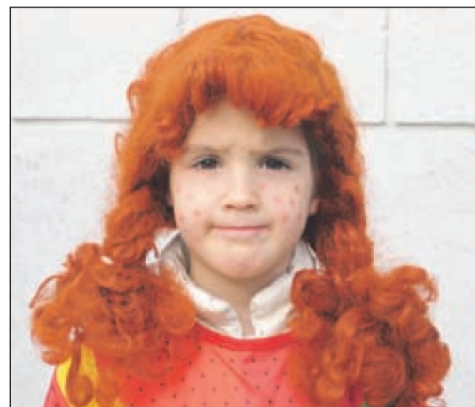
Pika Nogavička | BESEDILO IN SLIKE: MARJANA AHAČIČ