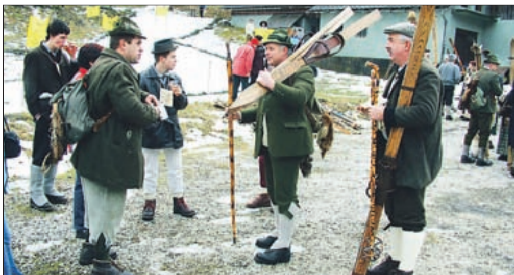
Smučarji po starem - gozdarji in lovci pred tekmo leta 2007