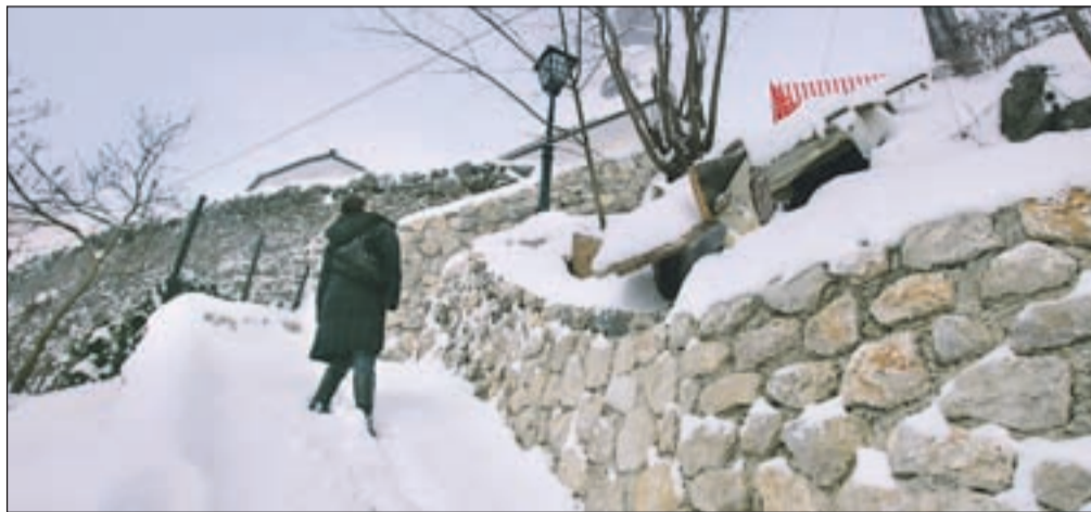
Ureditev poti s Placa proti cerkvi v Kropi je stala blizu 20 tisoč evrov.

Jeseni so se tako lotili ureditve poti s kamnitimi opornimi zidovi in stopnicami, opremili pa so jo tudi s tremi kroparski-