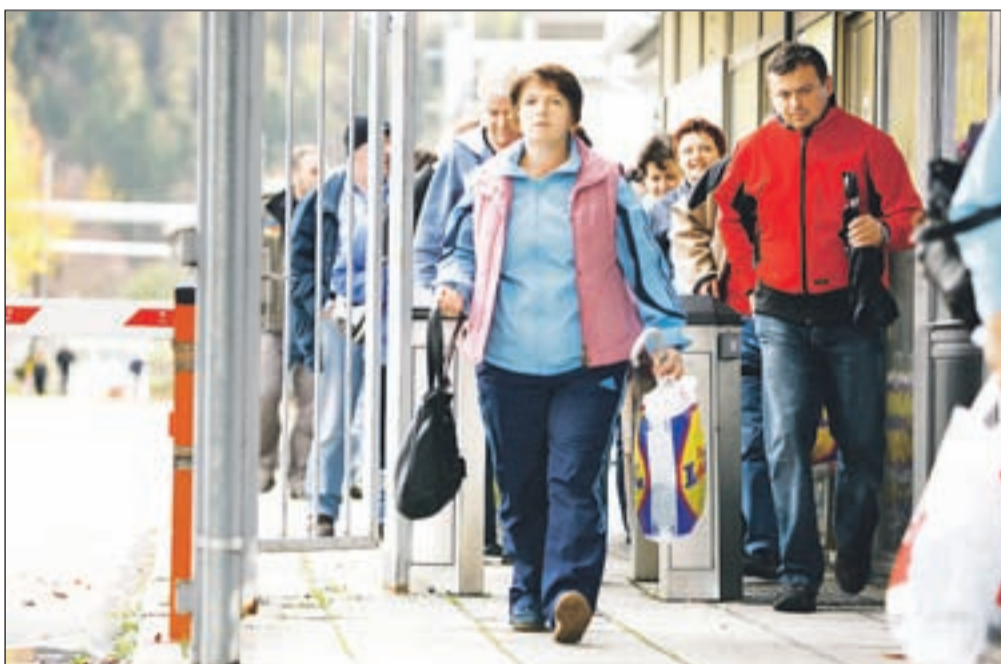
Delavci odhajajo iz Elana. Nekateri med njimi so ta teden prejeli obvestila o prekinitvi delovnega razmerja.