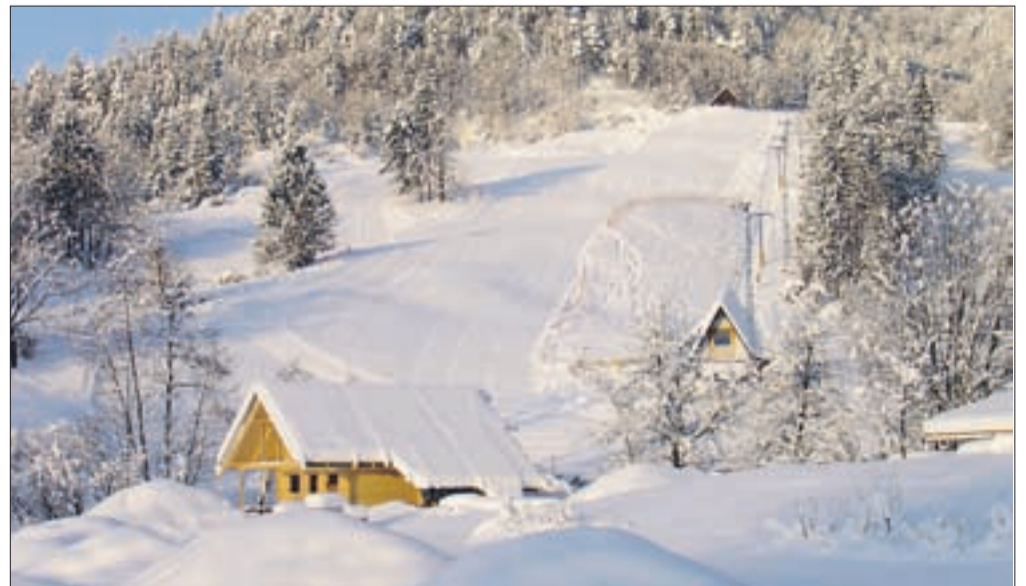
Idilčna podoba smučišča v Krpinu, kakršno je bilo sredi januarja.