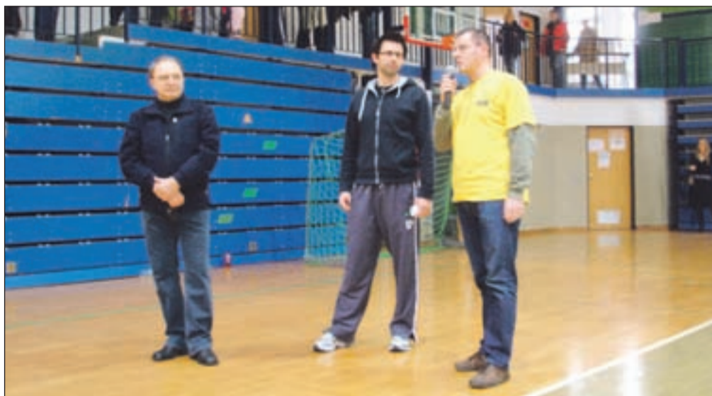
Ob začetku rokometnega turnirja

"Predvsem krepimo delovanje na področju mini rokometna na obstoječih šolah, po pravilu na turnirjih mini rokometna pod okriljem RZS v svoji tekmovalni skupini zmagujeta ekipi OŠ Radovljica in OŠ Lipnica. Ekipa