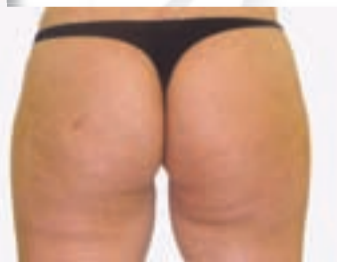
Po treh tretmajih

* Povprečno zabeleženo zmanjšanje obsega tretiranega dela telesa je 2 - 5 cm na terapijo.