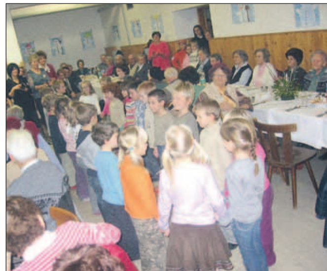
V kulturnem programu so sodelovali tudi najmlajši in s svojim prisrčnim nastopom ogreli dlani poslušalcev.