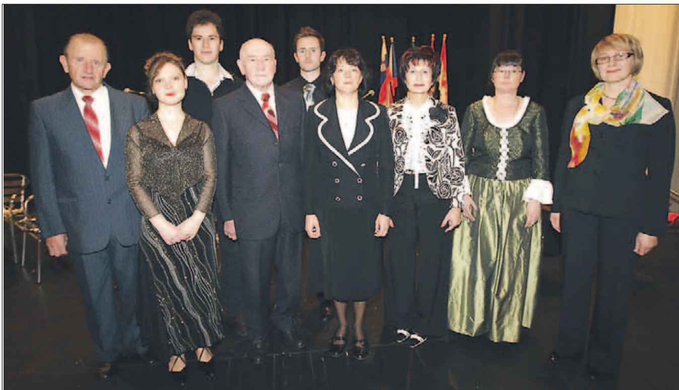
Na osrednji slovesnosti v Linhartovi dvorani je župan podelil občinska priznanja.