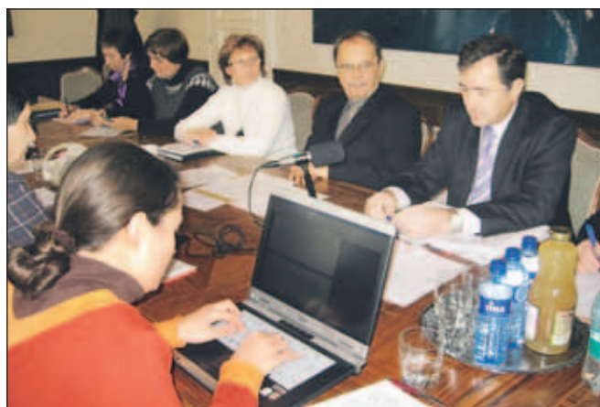
Aktualno dogajanje na področju predšolske vzgoje in varstva je občina predstavila na nedavni novinarski konferenci.

Stušek, občina za predšolsko vzgojo v zadnjih petih letih namenja več kot desetino občinskega proračuna, v letošnjem letu kar 2,5 milijona, ker je 12 odstotkov, v prihodnjem letu pa naj bi se delež povečal še za en odstotek. Največji delež teh sredstev predstavlja plačilo razlike do polne cene programa vrtec, pri čemer cena za prvo starostno obdobje znaša 476 evrov in za drugo starostno obdobje 360, deset odstotkov več kot v lanskem šolskem letu. Večina staršev je v prvem, drugem ali tretjem plačilnem razredu, kar pomeni, da za prvega otroka v vrtcu plačajo do 10 do 30 odstotkov cene, razliko pa krije občina. Za drugega in naslednje otroke so starši oproščeni plačila - njihov delež krije država, razliko pa prav tako občina.