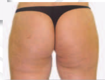
Po treh tretmajih

* Povprečno zabeleženo zmanjšanje obsega tretiranega dela telesa je 2 - 5 cm na terapijo.