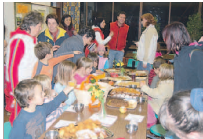
Po sprevedu je sledilo druženje s pogostitvijo.