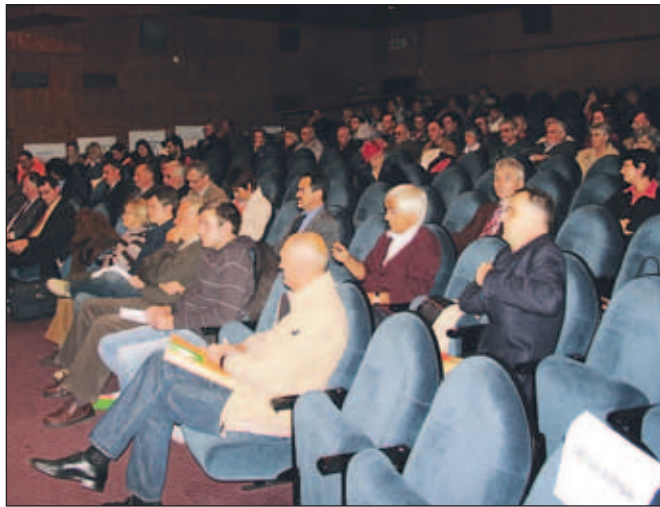
Izredna seja radovljiškega občinskega sveta je bila tokrat izjemoma v Linhartovi dvorani.