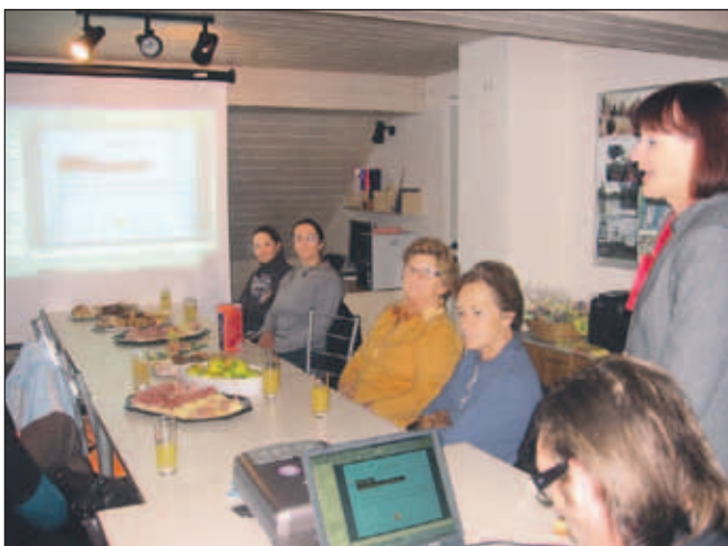
Na predstavitvi Kresničke