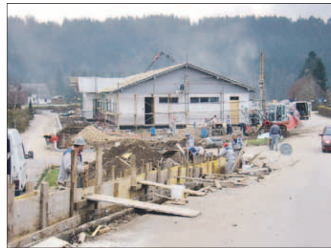
Gradnja poteka s polno paro.

Za potrebna zemljišča je Občina namenila 300 tisoč evrov, za investicijsko in projektno dokumentacijo 75 tisoč evrov, vrednost gradbenih del je ocenjena na 1,5 milijona evrov, vrednost opreme pa na 150 tisoč evrov. Tako bo za celotno naložbo namenjenih 2,1 milijona evrov.