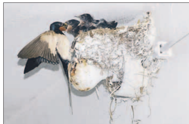
Kmečke lastovke še vedno najdejo domove na naših kmetijah.