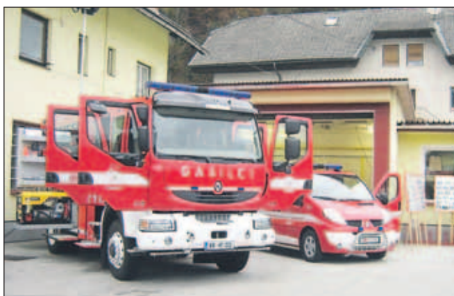
Na kraj dogodka so najprej prišli radovljiški gasilci ... in nato še gasilci iz Lesce.

lovanja evakuacijskih poti v vrtcu, delu osebja in zaposlenih ter spoznavanja gasilcev z enim izmed bolj vitalnih objektov v požarnem okolju PGD Radovljica. Vaja z naslovom "Vrtec 2008" je bila izvedena v okviru preventivne dejavnosti meseca oktobra (mesec požarne varnosti). Organizator vaje je bilo Prostovoljno gasilsko društvo Radovljica.