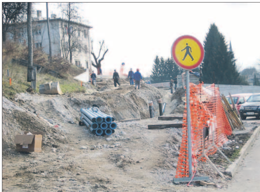
To jesen nove cestne komunikacije, čez dve leti bo na Vurnikovem trgu nova knjižnica.

Vzporedno poteka projektiranje vseh novih objektov na bodočem Vurnikovem trgu; od konca decembra naj bi bila pripravljena dokumentacija ter do konca januarja vloga za pridobitev gradbenega dovoljenja. Že to pomlad naj bi pričeli z gradnjo trga - najprej bo na vrsti garažna hiša, septembra pa stavba knjižnice, ki naj bi bila dokončana do konca maja 2010. "Približno dva meseca bomo potrebovali še za opremo, nato bo vse nared za selitev knjižnice v nove prostore," je optimističen Marčetič.