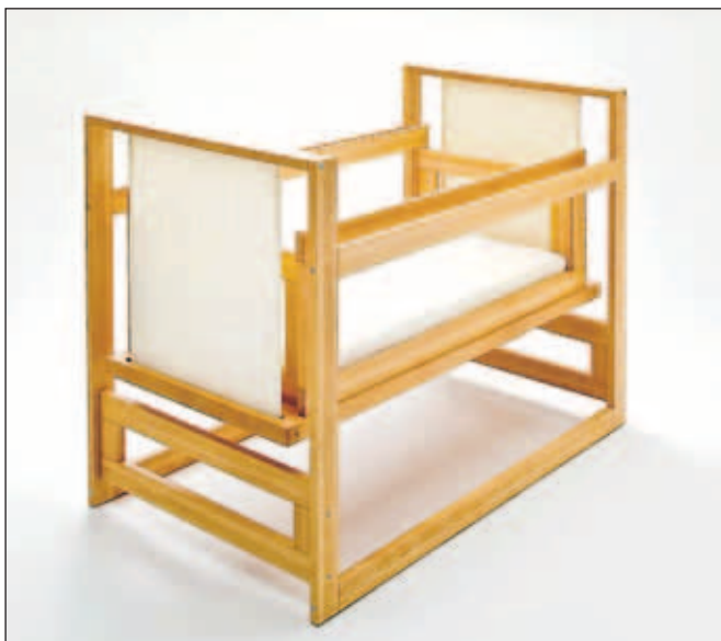
Zanimanje za nagrajeno zibko kažejo tudi v tujini.

"Trgodom, ki je najbolj poznan po blagovni znamki Slovenska postelja, je manjše podjetje, zato nam takšna nagrada predstavlja veliko potrditev, da smo na pravi poti. Znova se je izkazalo, da