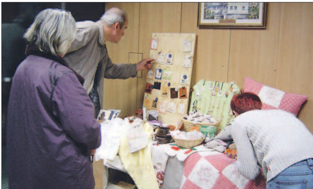
Obiskovalci so lahko kupili tudi izdelke, ki so jih naredili v VDC Radovljica in VDC Škrat Jesenice.