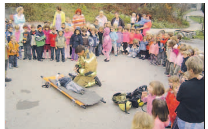
Po evakuaciji so radovljiški gasilci otrokom nudili prvo pomoč.