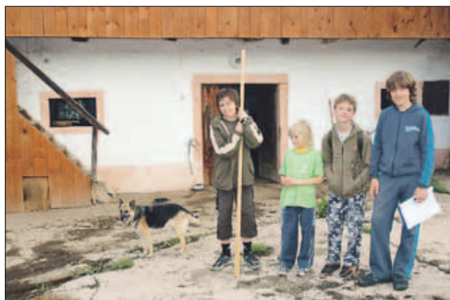
Za popis lastovk je bilo potrebno obiskati kmetije v Hrašah.

sko delo, jasno postavljeni nameni in cilji, utemeljeni rezultati na osnovi terenskih podatkov in uspešen zagovor pa je prepričal tudi komisijo," je bil vesel uspeha tudi njihov mentor Boris Kozinc.