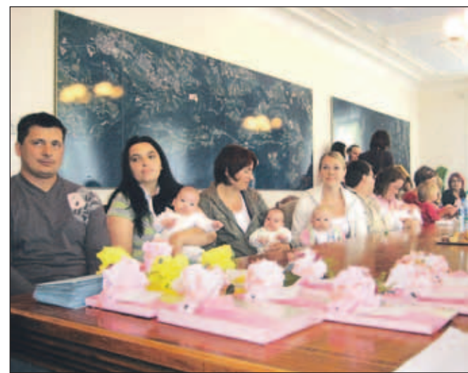
Čestitke in darila za nove občane Radovljice. Letos jih je župan sprejel že 166.