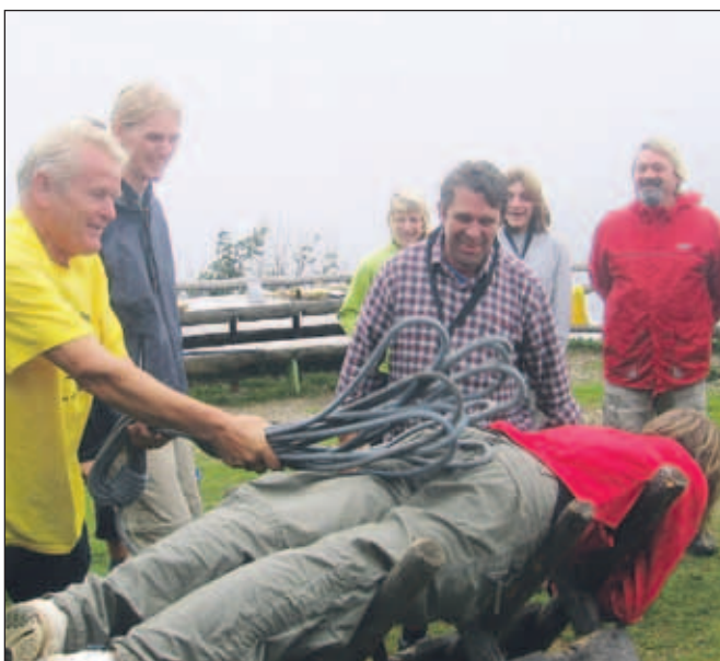
Krst novih članov orkestra

tva in še GRS! V tolažbo pa so si krščenci prislužili kos domače potice. Kot vedno je osebje Roblekovega doma dobro pogostilo orkester, pa tudi za vse ostale obiskovalce so pripravili pestro kulinarčno ponudbo.