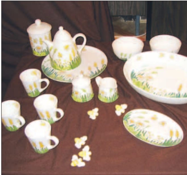
V Čebelarskem muzeju so bili na ogled izdelki, povezani s čebelami in čebelarstvom.

Na razstavi v Čebelarskem muzeju so bili na ogled izdelki, povezani s čebelo in čebelarstvom: belo glazirani krožniki, sklede, čajniki, lončki, poslikani s travami, žitom, cvetjem in drobnimi čebelami. S čebelami in