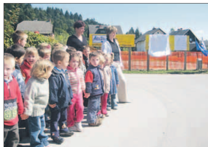
Gradnje novega vrtca so se najbolj razveselili najmlajši. V nove prostore se bodo preselili v štirih mesecih.

Celotna investicija je vredna 2,1 milijona evrov, od tega je občina za zemljišča namenila 300 tisoč evrov, za investicijsko in projektno doku-