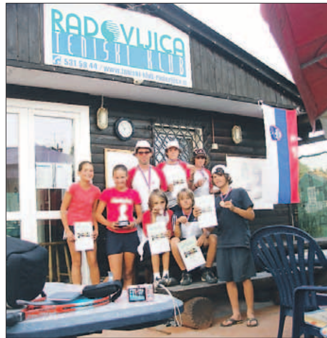
Radovljiški in jeseniški tenisači so dobro nastopili v kategoriji do 12 let.