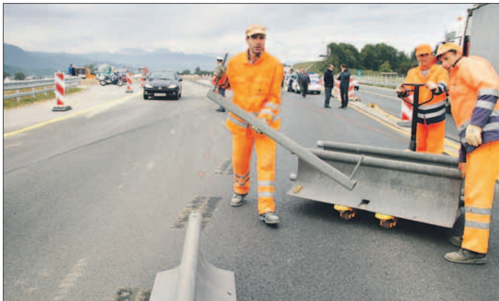
Promet je v smeri proti Kranju stekel v ponedeljek okoli desete, opoldne pa ga na novo cesto usmerili še v smeri proti Radovljici.

"Občankam in občanom se ob gradnji zahvaljujem za potrpljenje, ki pa ga bo še kar nekaj potrebno do taktat, da bodo gradbeni stroji odšli z našega območja. Upam, da se bo v prihodnje ime naše občine po medijih pojavljalo več pri pozitivnih stvareh, kot pa po zastojih pri Radovljici. Upam pa tudi to, da bomo z avtocesto nekoliko bližje Ljubljani in bodo tako tudi želje in potrebe naših krajanov kaj prej uslišane," je še dejal Jeglič. Trasa avtocestnega odseka Vrba-Peračica je dolga 9.780 metrov. Avtocesta je zasnovana kot štiripasovna cesta z izvennivojskimi križanji, odstavni pasovi in vmesnim ločilnim pasom, odsek pa je