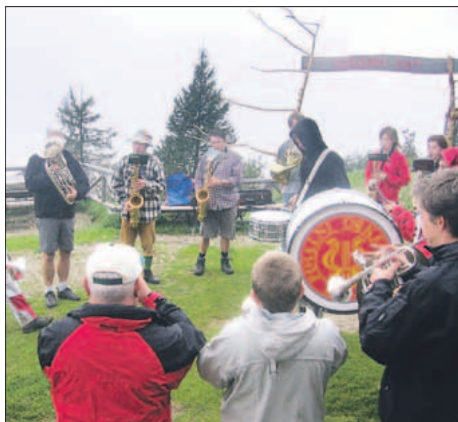
Pihalni orkester Lesce