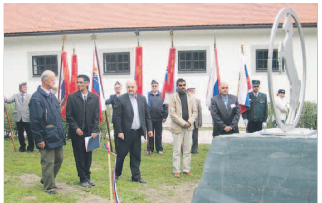
Spomenik pred Muzejem talcev: krog, ki predstavlja zemljo, in konj, s katerim so Sinti potovali po njej.