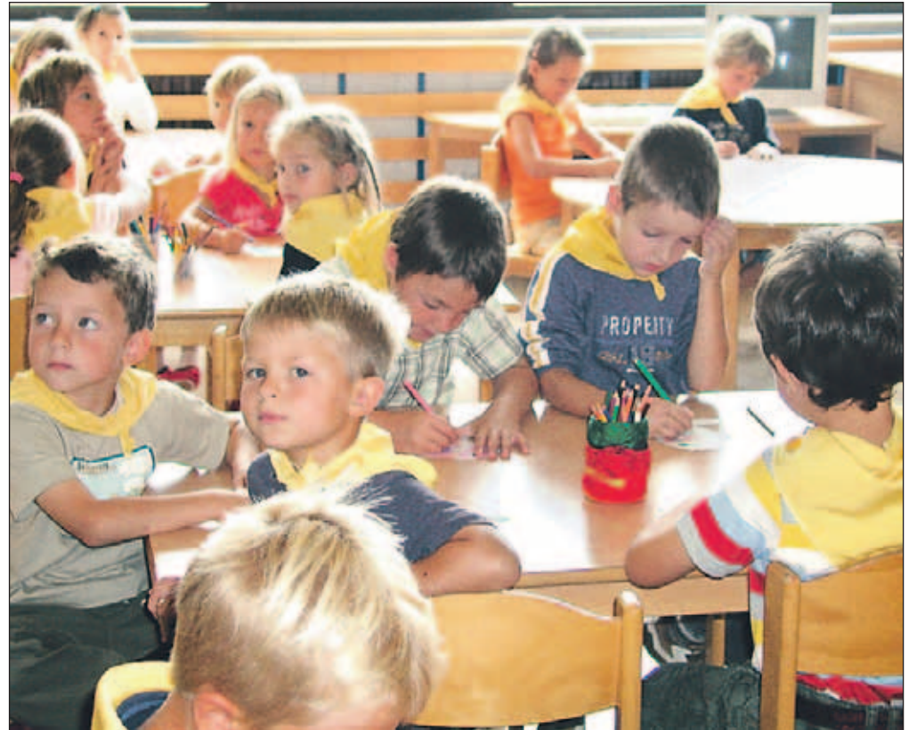
Na prvi šolski dan