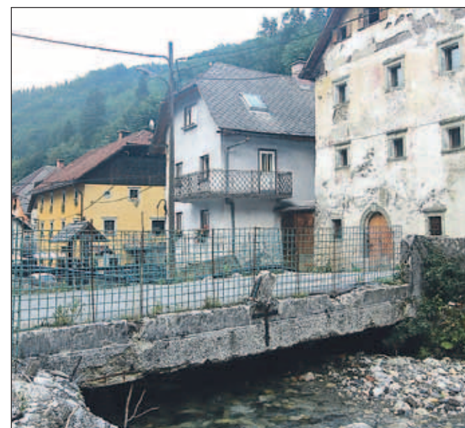
Stari Koruzni most