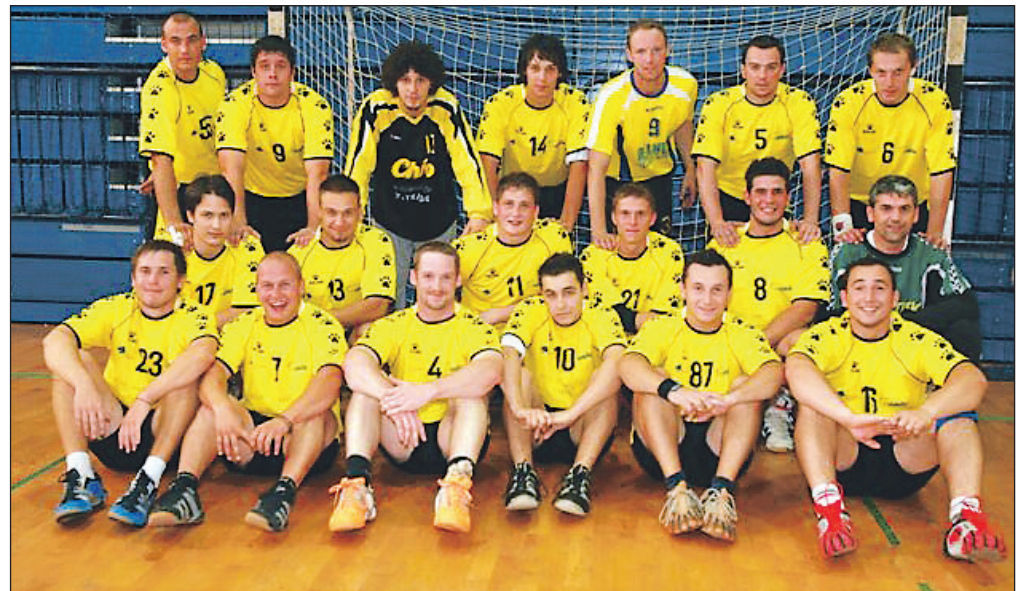
Ekipa radovljiškega rokometnega kluba