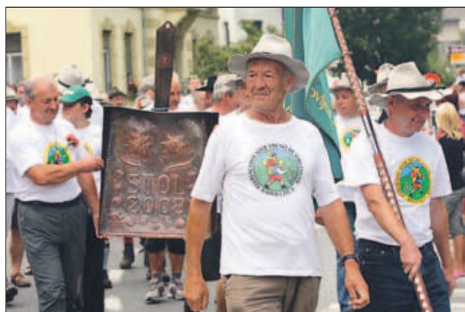
Večno mladi fantje so tokrat za simbol pohoda na Stol izbrali smetišnico.