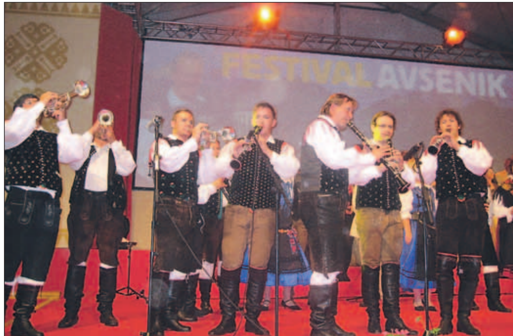
Na festivalu so nastopili številni izvajalci Avsenikove glasbe.

Festival Avsenik, na katerem so nastopili najbolj znani in najboljši slovenski ter tudi nekateri tuji izvajalci Avsenikove glasbe, poleg njih pa humoristi in mlajši ansambli, ki na svoj način posredujejo Avsenikovo glasbo, je uspel tudi zaradi dobrega sodelovanja Avsenikove s krajinami in društvi v Begunjah ter z radovljiško občino, ki je bila tudi eden od pokroviteljev prireditve, poudarja pobudnik festivala