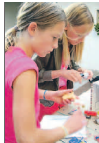
Na delavnici so nastajali unikatni kosi nakita.

Jutri, v soboto, 13. septembra, ob 10. uri v sodelova-