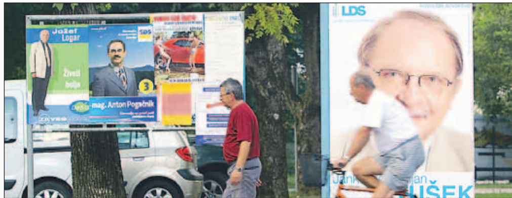
Kandidati za poslance se med volilno kampanjo predstavljajo tudi na plakatih.

Kandidate (in njihove odgovore) predstavljamo po vrstnem redu, kot bodo navedeni na glasovnici.