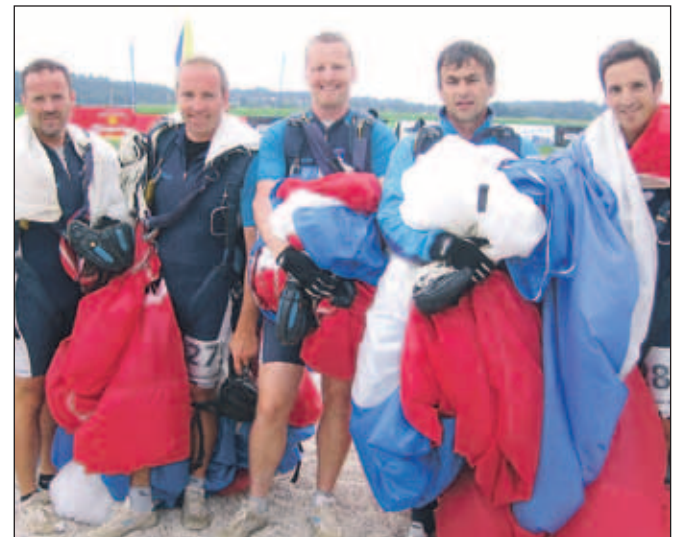
Ekipa Elana vodi v tekmovanju za svetovni pokal.