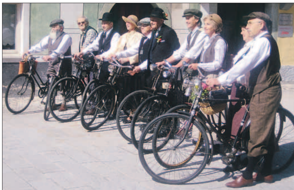
Lastniki večno mladih koles na Linhartovem trgu

starost kolesa in avtentičnost opreme kolesa in kolesarja. Prvi trije so dobili nagrade, podelili pa so tudi nagrado lastniku najstarejšega oldtajmarskega kolesa, ki je član kluba. Prva nagrada je pripadla Kamničanu s kolesom letnik 1938, drugo je prejel par iz Šenčurja na kolesih letnik 1927 in 1930, tretjo pa par iz Tržiča, njuna kolesa so letnik 1928 in 1937.