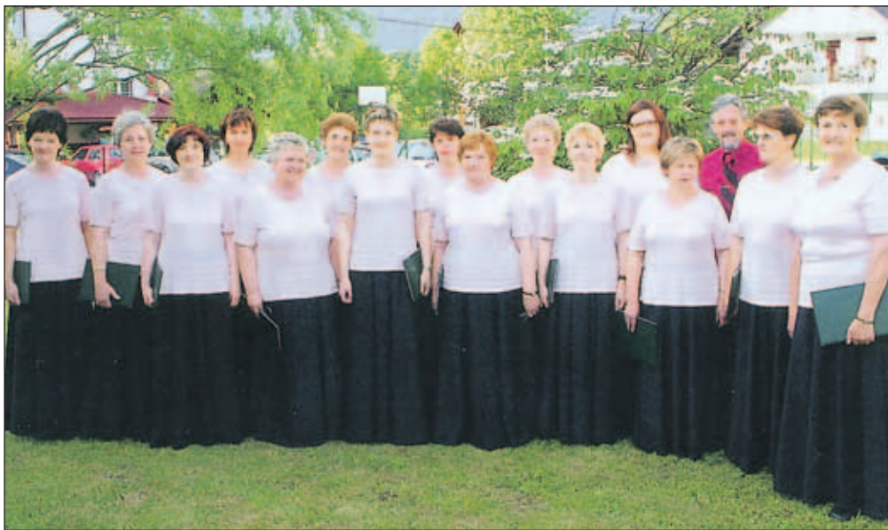
Ženski pevski zbor Almira