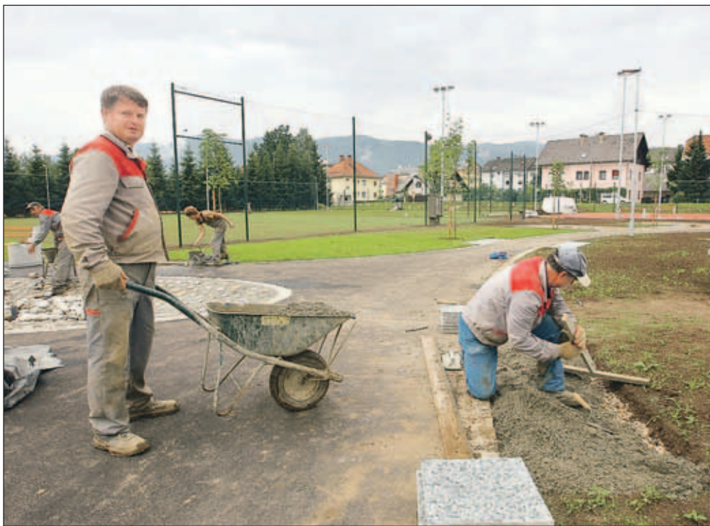
Še zadnja dela v novem športnem parku v Radovljici

Radovljica - V Radovljici so ob obstoječem športnem parku uredili nov, en hektar velik park, v katerem sta dve nogometni igrišči s tribuna, igrišče za ulično košarko, dve igrišči za badminton, igralno polje za šah in tri mize za namizni tenis ter drsališče, ki ga bodo poleti uporabljali za rokanje in za igranje in-line hokeja. Večje nogometno igrišče ima za podlago naravno travo in sistem za zalivanje z vodo, manjše pa je prekrito z umetno travo. Za drsališče bodo tehnološko opremo nabavili letos jeseni. Občina je projektno dokumentacijo za športni park naročila predlani, gradbeno dovoljenje je pridobila lani poleti, izbrani izvajalec del, Cestno podjetje Kranj, pa je z deli začel lansko jesen. Novi športni park bodo slovesno odprli v sredo, na dan državnosti, v prihodnjih letih bodo obnovili še obstoječe rekreacijske površine. Pogodbena vrednost za novi del je 1,2 milijona evrov, za obnovo obstoječega parka pa 600 tisoč evrov. Denar za