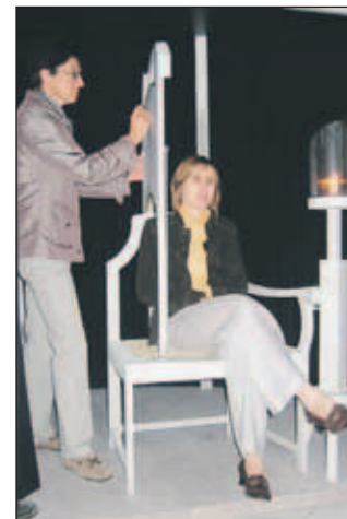
Na predstavitvi izdelovanja silhuet

Izdelovanje silhuet bodo to poletje v radovljiški graščini predstavili še štirikrat: v sobo-