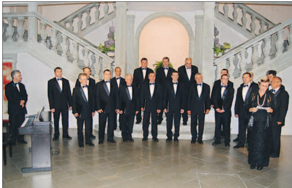
Moški pevski zbor Podnart med nastopom v Graščini