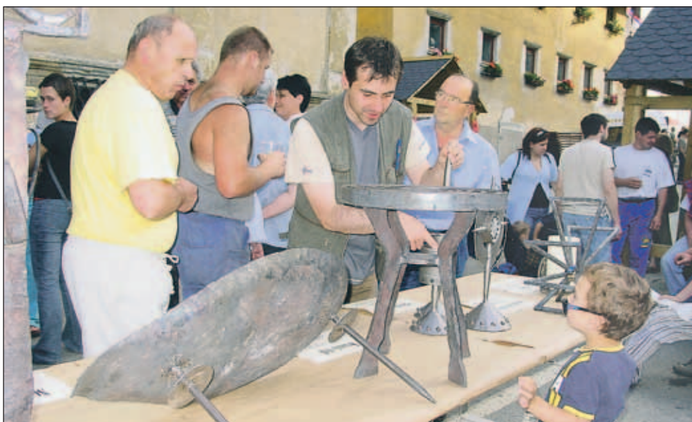
V Kropi bo letos spet Kovaški šmaren.

- ob 21. uri: kresovanje v soju ognja in najbolj skrivnostne noči: običaji ob kresu, kulinarika, plesi, glasba,