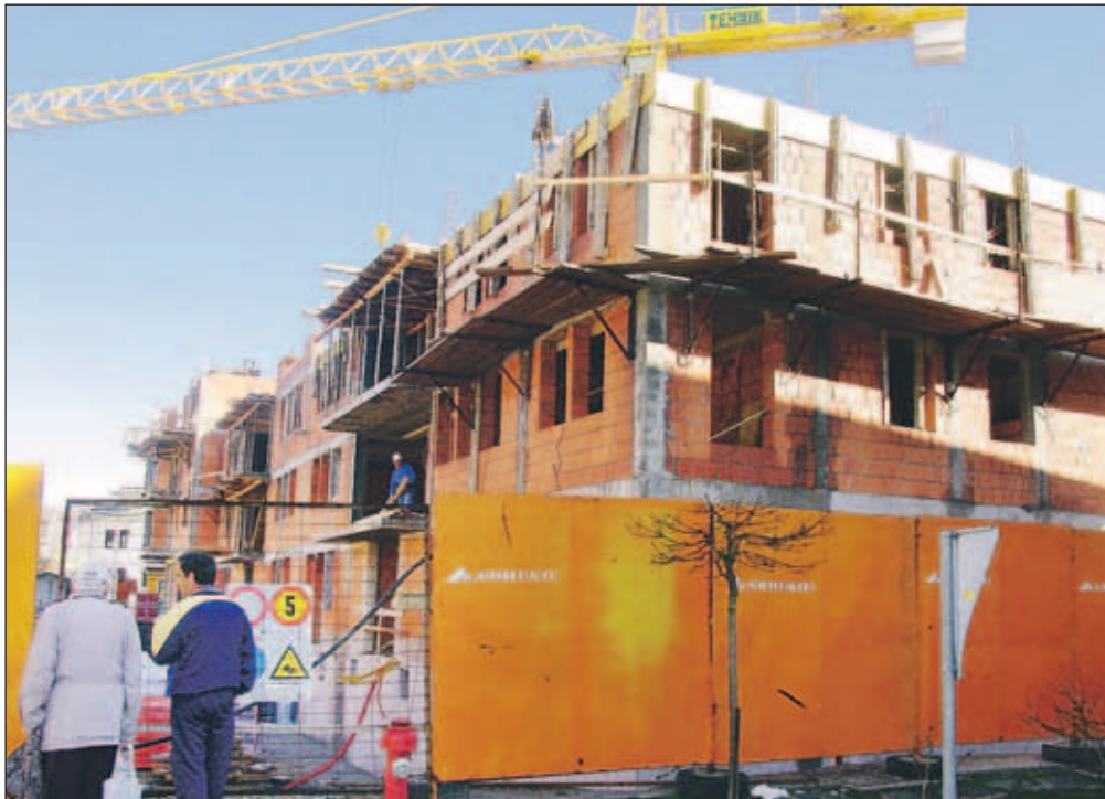
Občini primanjkuje neprofitnih najemnih stanovanj.

Radovljica - V radovljiški občini so pripravili osnutek stanovanjske strategije občine za obdobje 2008-2013 z usmeritvami do leta 2020, ki bo po sprejetju na seji občinskega sveta postala temeljni dokument pri pripravi stanovanjskih programov za posamezna proračunska obdobja. Predlagana strategija (osnutek je občinski svet že sprejel) analizira stanje v občini in izvajanje stanovanjske politike v preteklosti, predstavlja potrebe po stanovanjih, izpostavlja glavne probleme ter določa razvojne cilje in ukrepe za njihovo izvedbo. In kaj so glavni problemi na stanovanjskem področju? Občini primanjkuje neprofitnih najemnih stanovanj, pri lanskem razpisu so na prednostno listo uvrstili 62 upravičencev, dodelili so lahko le dvanajst stanovanj. Velik problem je pomanjkanje stavbnih zemljišč za stanovanjsko gradnjo, prostorska analiza je pokazala, da primanjkuje zlasti zemljišč za gradnjo objektov z večjo gostoto pozidave (vrstnih hiš, dvojčkov, blokov). Pri kmetijskih zemljiščih občina nima možnosti za uveljavljanje predkupne pravice, saj je po zakonu šele na petem mestu prednostnih