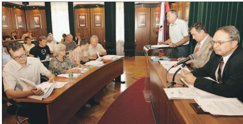
Občinski svet je na nedavni seji potrdil tudi višje cene vrtcev.

Radovljica - Občinski svet je v nadaljevanju majske seje določil nove cene programov vrtcev Vzgojno varstvenega zavoda Radovljica. Od 1. julija bo polna cena za otroka od enega do treh let starosti znašala 465,70 evra na mesec, za otroka od treh do pet let 350,22 evra, za peturni program 297,68 evra in za štiriurni program 227,64 evra. Nove cene bodo za prvo starostnega obdobja višje od sedanjih za 6,82 odstotka, za ostale programe pa za 7,99 odstotka. Z novim šolskim letom se bodo cene spet spremenile, takrat se bo za otroka od enega do treh let starosti zvišala na 476,38 evra oz. za 2,3 odstotka, za otroka, starega od tri do pet let, na 359,87 evra, za štiriurni program na 233,91 evra in peturni program na 305,89 evra oz. za 2,76 odstotka. Svetniki SDS so ob tem predlagali, da s podražitvijo za julij in avgust ne bi obremenjevali staršev in da naj bi razliko kril občinski pro-