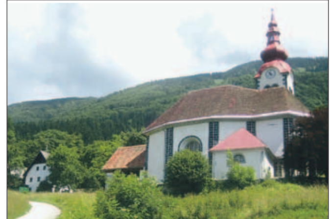
Cerkev sv. Lucije

najst odraslih, ki hodijo v službo. Čistega kmeta ni več, kmetijstvo je skoraj popolnoma propadlo. Mladi so se od vojne naprej odseljevali ali so zaposleni drugje," je povedal iskriivi gospod iz hiše številka ena.