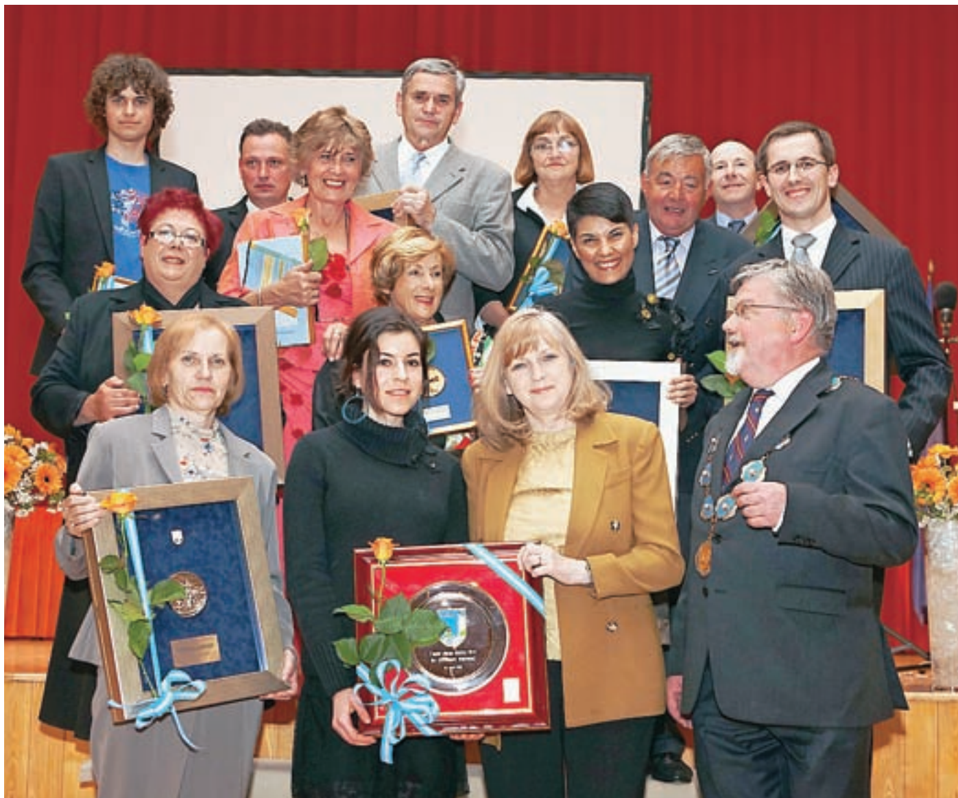
Letošnji občinski nagradenci in nagrajenke so priznanja prejeli na osrednji slovesnosti 10. aprila.