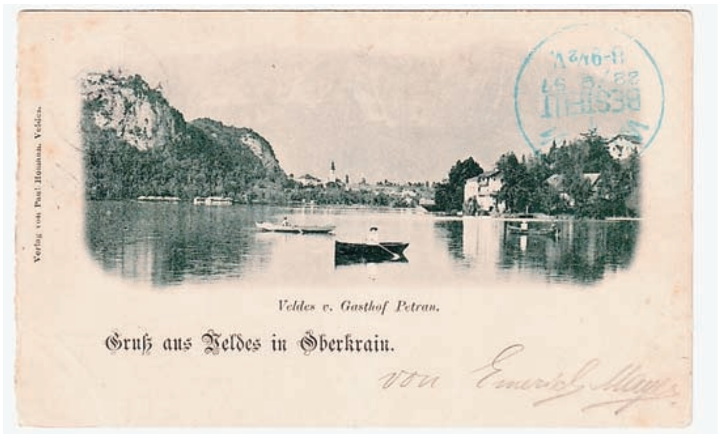
Pavel Homan je že leta 1897 založil razglednico z naslovom Pozdrav z Bleda na Gorenjskem , ki jo hrani Gorenjski muzej v Kranju.

Lepe praznike vam želi uredništvo Blejskih novic.