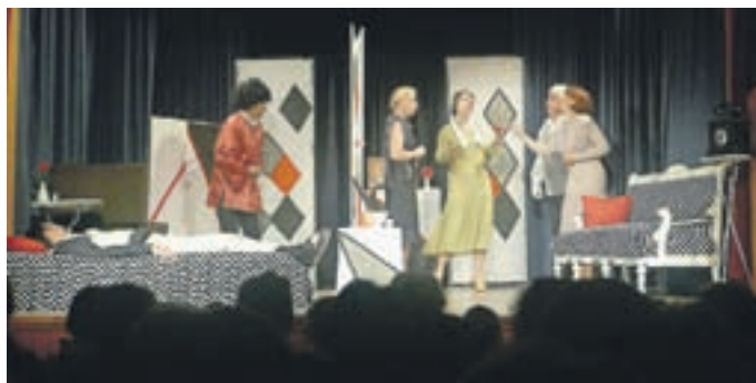
Prizor s predstave Ti nori tenorji / Foto: dokumentacija Gledališča Belanskega

Matija Milčinski, samostojni svetovalec za gledališko in lutkovno dejavnost