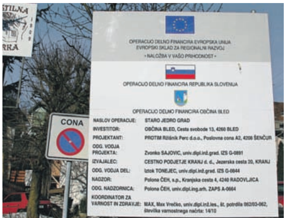
Obnova starega dela vasi Grad (gre za enega najstarejših delov Bleda) se je začela že lani, nadaljevala pa zgodaj spomladi. Grad bo dobil novo podobo.

Oglasno trženje: Jure Tomažin, tel. 04/201-42-33, 031/378-741, jure.tomazin@g-glas.si