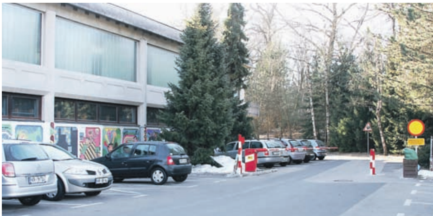
Blejsko osnovno šolo letos čaka energetska sanacija, ki jo bodo speljali s pomočjo švicarskih finančnih skladov, s svojimi sredstvi pa bo Občina na novo uredila tudi prepotrebno parkirišče in s tem povečala predvsem varnost otrok.