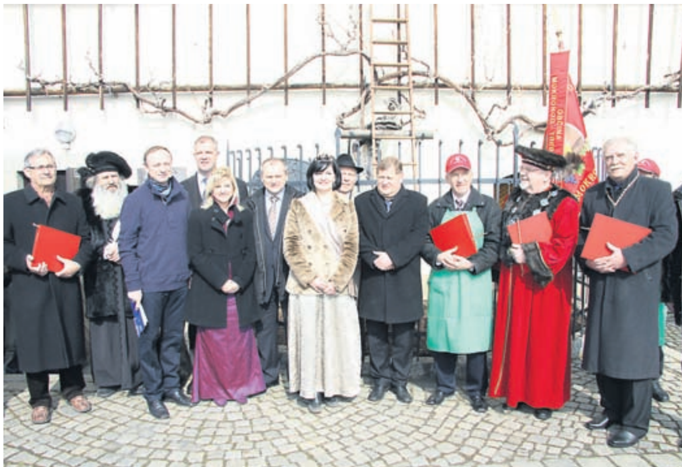
Ob predaji trte, v sredini letošnja vinska kraljica

Blejski grad bo odslej bogatejši za najstarejšo trto na svetu, na gradu bo trta našla posebno mesto. Svojo tisočletnico bo grad praznoval maja.