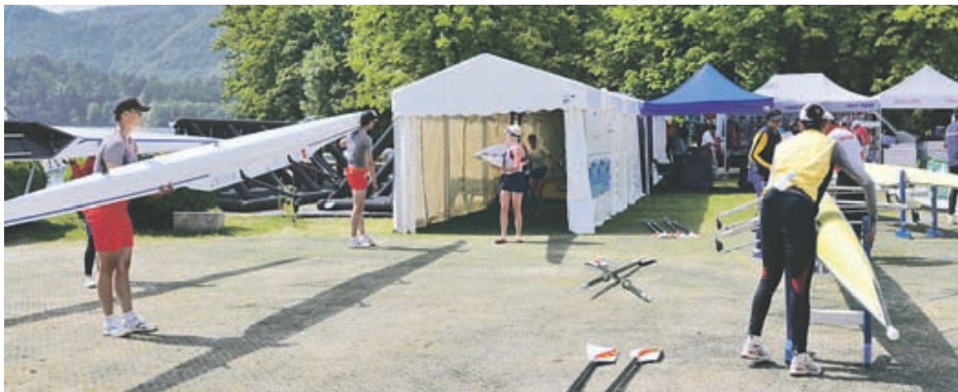
Priprava na tekmovanje