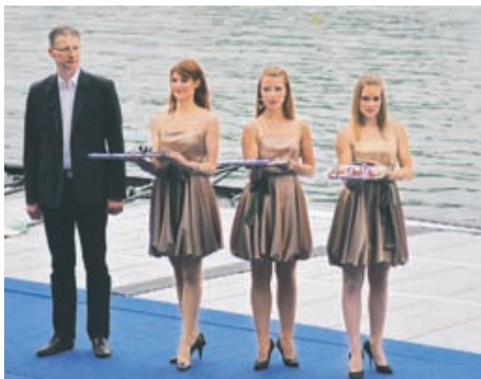
Minister Igor Lukšič na podelitvi priznanj / Foto: Veronika Bakač