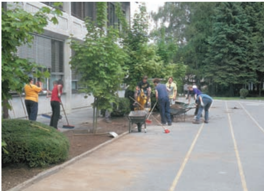
Urejanje cvetlične grede ob šoli