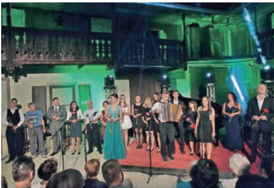
Poletni koncert Pa se sliš'

Največji kulturni dogodek letošnjega leta je bil poletni koncert Pa se sliš'. Že nekaj let je zorela ideja, da bi v čudovitem ambientu župnijskega posestva pod zvezdnatim nebom predstavili naše znane krajane. Tiste, ki živijo z glasbo in za glasbo, ter tiste, ki jim je glasba velik hobi. Ideja je dozorela in v toplem avgu-