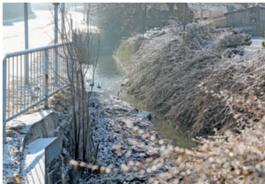
V letu 2016 je bila pretočnost potoka Belca praktično 100-odstotna vse leto, letos pa je bila struga v delu Predoselj suha približno četrtino leta.

Z zagotavljanjem dobre pretočnosti se lahko v veliki meri izognemo presuševanju struge. S planirano izgradnjo kanalizacijskega omrežja se bomo znebili nemalokrat neznosnega vonja po fekalijah, ki so žal še vedno prisotne in smo za njihov izpust v prvi vrsti krivi sami. Vse krajanje naprošamo, da sami naredijo, kar je v njihovi moči, za dobrobit potoka, predvsem pa v sušnih obdobjih ne izrabljajo potoka za lastno korist, vsaj v tolikšni meri, da zagotovimo normalno pretočnost skozi obe vasi Suha in Predoslje. KS Predoslje, foto: Tina Dokl