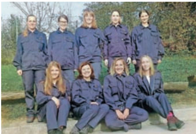
Na državno tekmovanje so se uvrstile članice A...

Ob nešteto dejavnostih v domačem kraju so bili gasilci PGD Predoslje uspešni tudi na tekmovanjih.