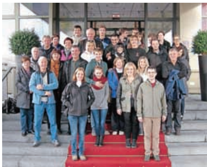
Člani KUD Predoslje so se odpravili na izlet v München.