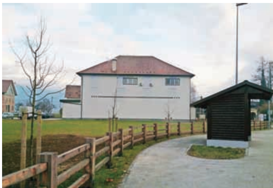
... in po obnovi.