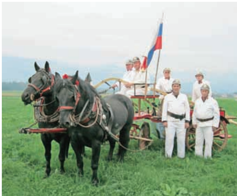
Veterani s staro ročno gasilsko brizgalno iz leta 1905

Med člani prostovoljnega gasilskega društva Predoslje imajo posebno mesto njihovi vetera-