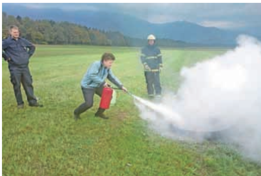
Prikaz uporabe gasilnika