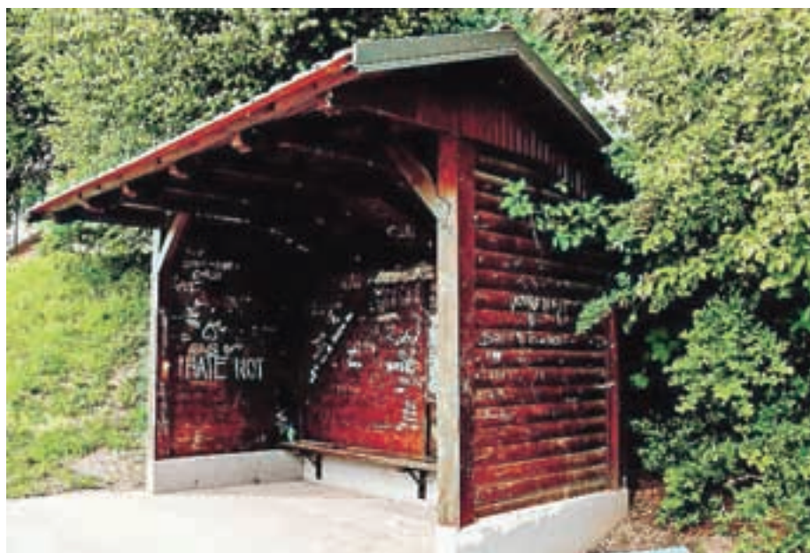
Avtobusna postajališča pred obnovo ...