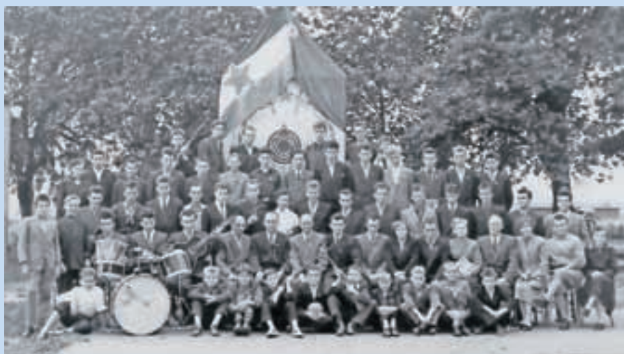
Strelci Predoselj leta 1953