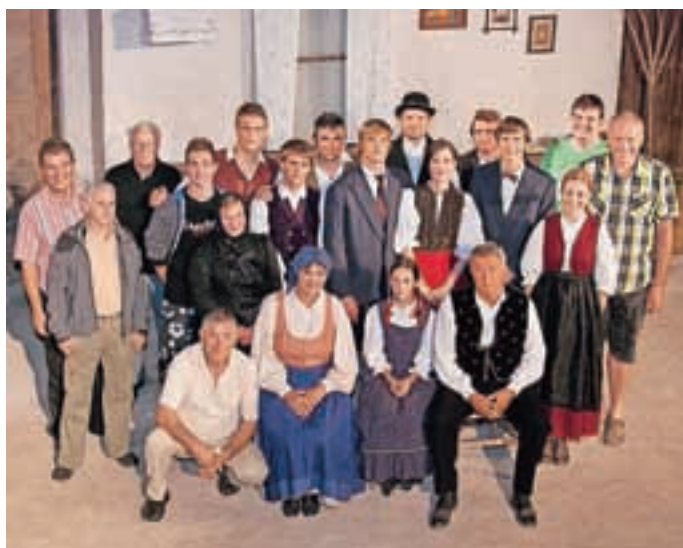
V začetku julija je premiero doživela Lucija.