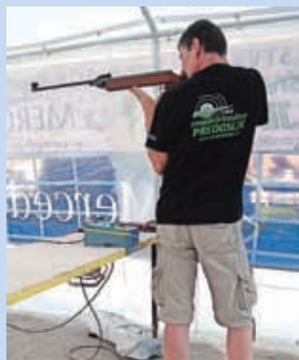
V sklopu Naaaj dneva so izvedli nagradno streljanje.