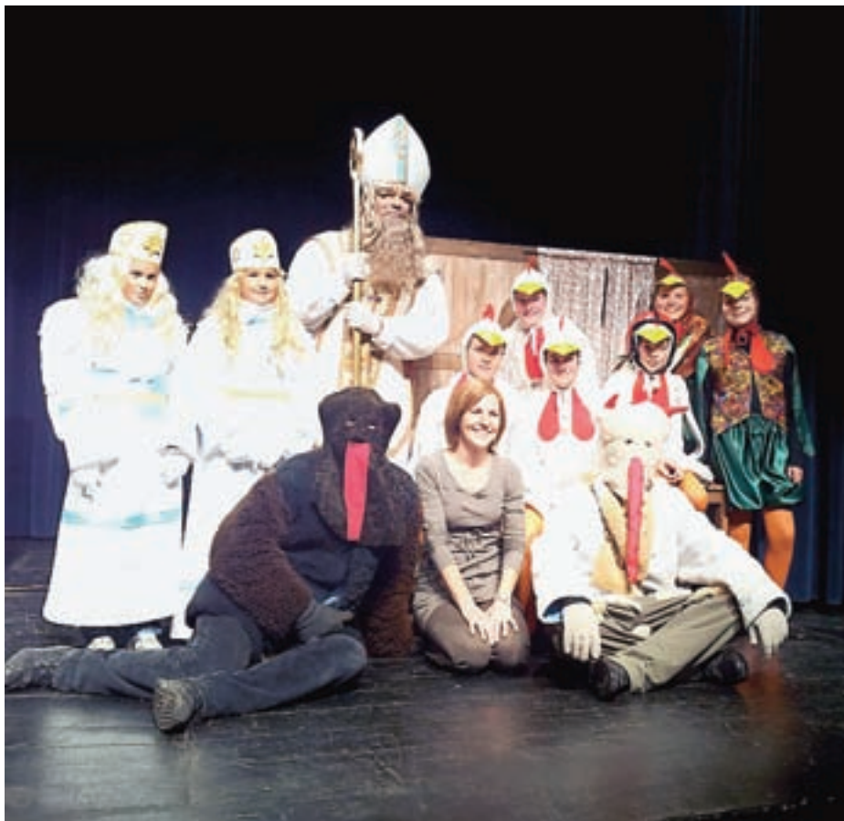
Po predstavi otroške skupine kulturnega društva je otroke razveselil še sveti Miklavž.

Mladi igralci so s predstavo že gostovali v Kamniku, Komendi in Kranju, čakajo pa jih še ponovitve na Jesenicah in na Visokem.