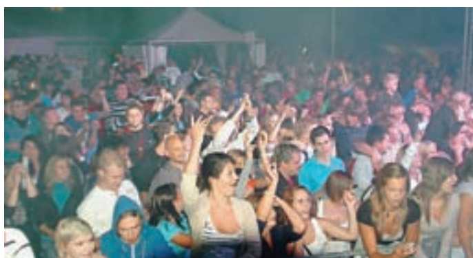
Žur je trajal ...