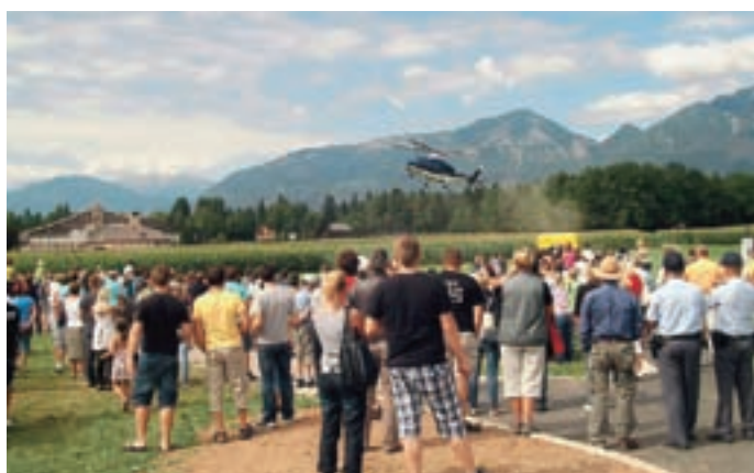
Predstavili so se nam policisti, gasilci, reševalci ...