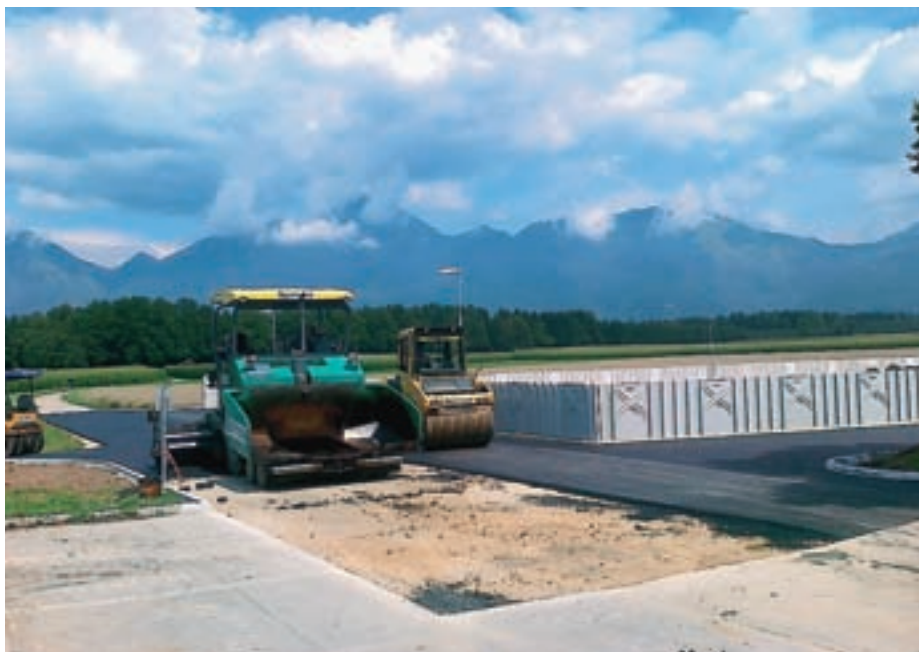
Z izgradnjo parkirišča pred novim pokopališčem je skorajda končan projekt pokopališča.

Ravno pri obnovi ceste se je pokazalo, da večina živih mej globoko posega v cestno telo, zato svet Krajevne skupnosti Predoslje apelira