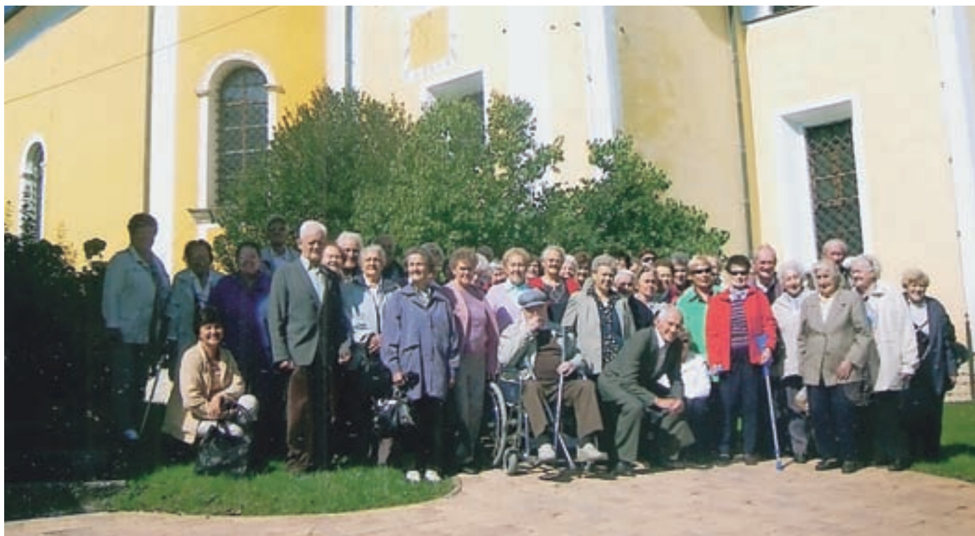
Za starejše in bolne so septembra organizirali izlet, primeren za njihove moči. Ogledali so si cerkev na Ponikvi in rojstno hišo z muzejem Antona Martina Slomška.

Upokojenci nismo za staro šaro in ne preživljamo svojih dni le ob televizorjih oziroma premišljevanju o boleznih, ki nas tarejo, ampak svoj dragoceni čas porabimo koristneje.