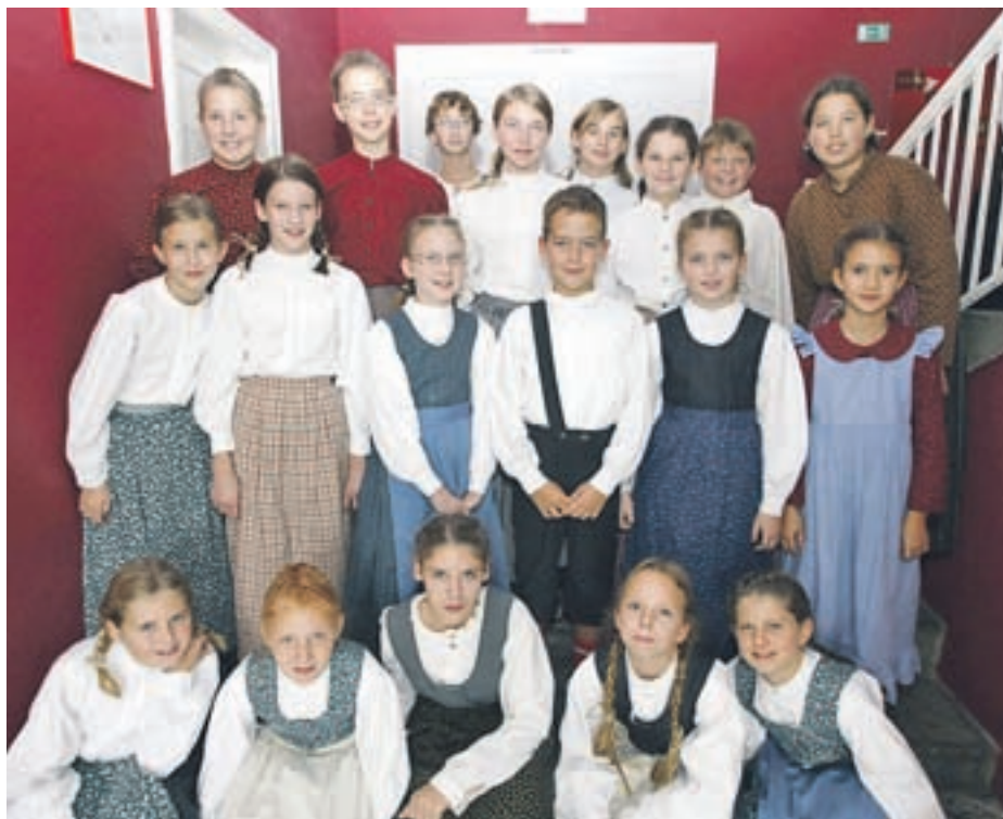
Nastopila je tudi Mlajša otroška folklorna skupina OŠ Predoslje.