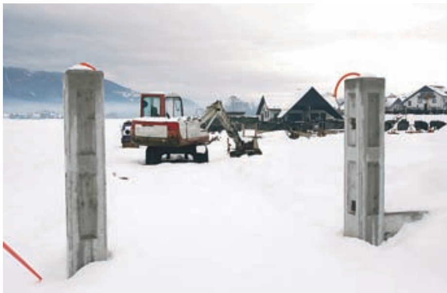
Ureditev pokopališča v prihodnjem letu predvideva tudi izgradnjo ločilnice odpadkov.

Ureditev pokopališča, ki bo končana predvidoma marca prihodnje leto, obsega tudi izgradnjo ločilnice odpadkov. ”Zato bi krajane prosila za doslednost pri ločevanju, saj stroški odvoza močno bremenijo finančno stanje pokopališke uprave,” je opozorila predstavnica sveta krajevne skupnosti, zadolžena za stike z javnostjo, Eva Gašperlin . To velja, je nadaljevala, tudi za ločevanje odpadkov na ekoloških