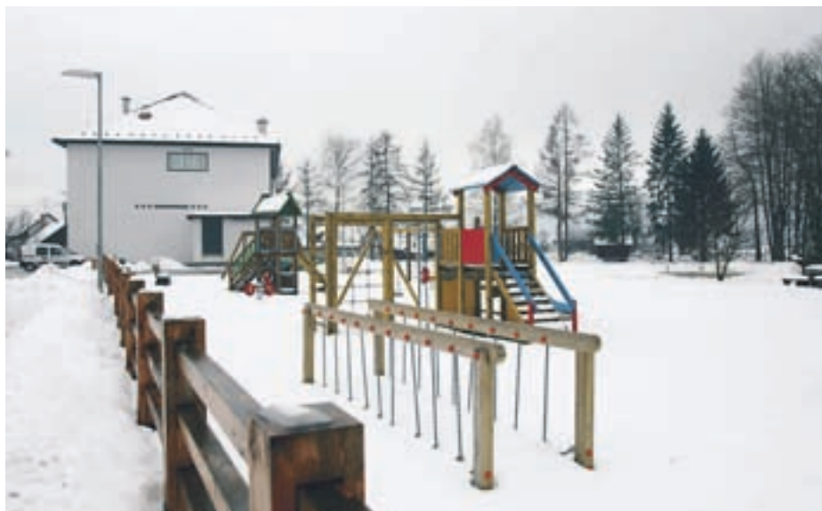
V Predosljah so za otroke uredili nova igrala.