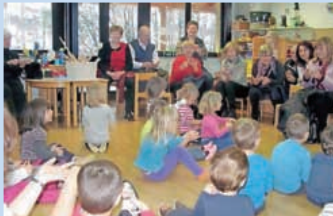
Tik pred prihodom Miklavža smo v goste povabili babice in dedke.

Seveda se s tem december še ni končal. Kje pa, šele začelo se je! Te dni nam pridni starši pripravljajo veliko presenečenje. Kaj vse, ne vemo, vemo pa, da bo veselo, prijetno in da bomo strašansko uživali.