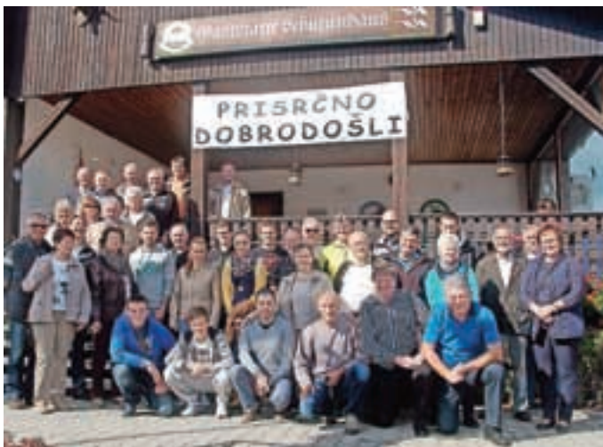
Skupinska slika iz Amberga