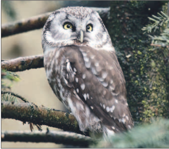
Kocconogi čuk