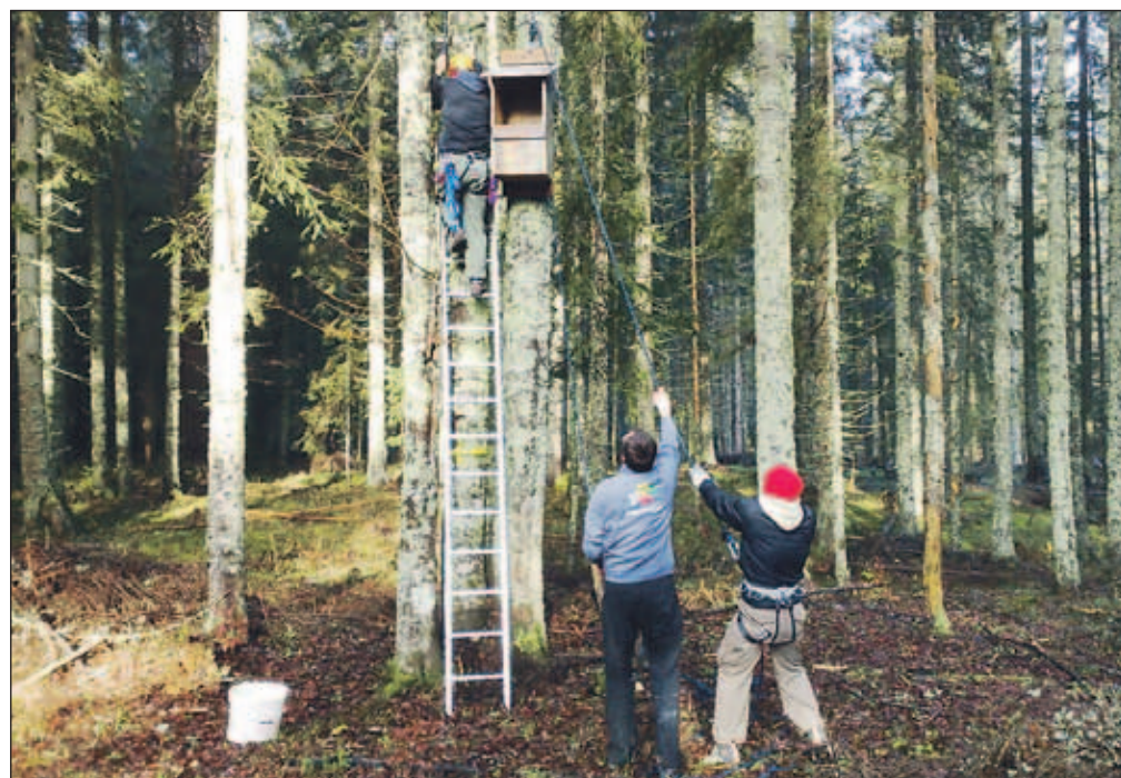
V začetku novembra so na Jelovici postavljali gnezdilnice za kozačo in kocconogega čuka.

Na zavodu RS za varstvo narave upajo, da bodo ptice izkoristile možnost, ki so jim jo ponudili za gnezdenje. "Spomladi bomo preverili, koliko in katere gnezdilnice si bodo sove izbrale za gnezdenje. Spremljanje stanja zasedenosti gnezdilnic načrtujemo tudi v prihodnje. Posredno bomo tako pridobili tudi nekatere podatke o teh dveh vrstah."