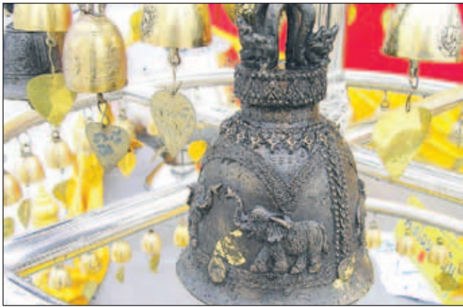
Zvončki v budističnem templju v Bangkoku