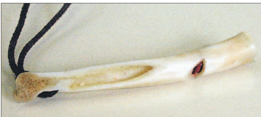
Gozdni jereb je zadnjih petnajst let popolnoma zavarovana vrsta, s pomočjo piščali pa zdaj te skrivnostne ptice le opazujejo in proučujejo.

To soboto in nedeljo, 4. in 5. oktobra, bo več kot 50 tisoč ljudi po vsej Evropi svojo pozornost namenilo pticam. Lani so jih opazovali več kot tri milijone! Organizirane aktivnosti bodo pripravili partnerji svetovne zveze za zaščito ptic BirdLife International, ki ga v Sloveniji zastopa Društvo za opazovanje in proučevanje ptic Slovenije. Letos bomo posebno pozornost namenili pticam selivkam in njihovim selitvenim potem. Nekatere prav zdaj zapuščajo Evropo in so namenjene v Afriko, medtem pa k nam prihajajo prvi gostje s severa, ki bodo zimo preživel pri nas. Na Gorenjskem pripravljajo izlet na Trbojsko jezero, začel se bo v nedeljo ob 9. uri pri ribiški brunarici v Prašah.