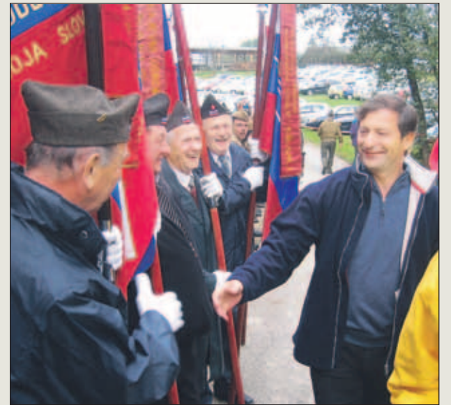
Karel Erjavec pozdravlja praporščake: "V DeSUS-u varujemo vrednote NOB."

"Karli so ponavadi Veliki, če pa je zraven še Viktor, je to zagotovo zmogovita formula. Šalim se. Da ne bo pomote in bodo spet vsi rekli, kako samozavesten sem in kako se hvalim."