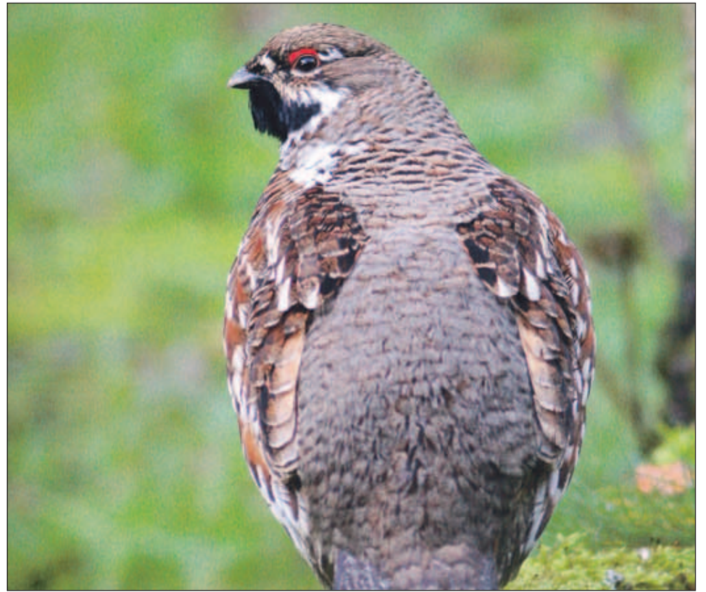
Gozdni jereb, skrivnostni sorodnik divjega petelina, ruševca in belke