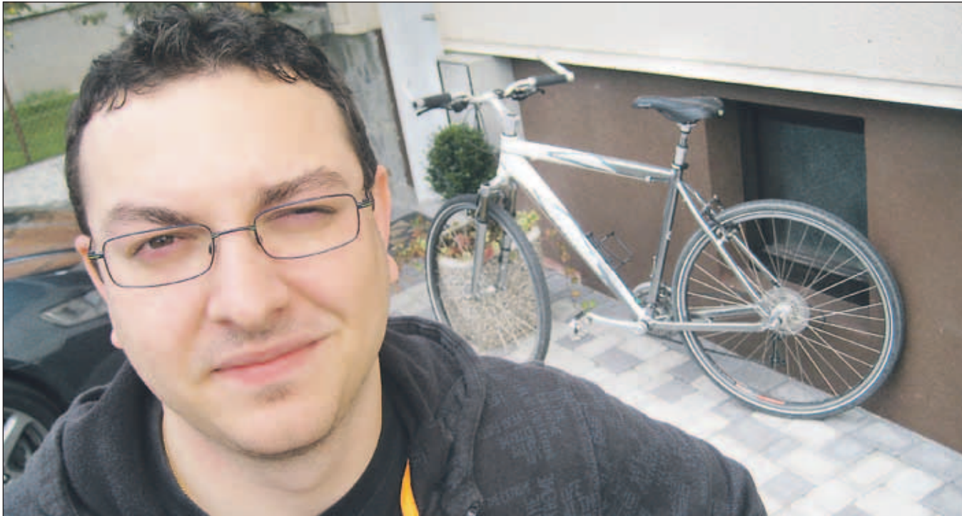
Grego s kolesom na potep

"V Sloveniji me predvsem zanima kulturna krajina. Potovanje v tujino je povezano s službo, če ostane kaj časa, si najraje ogledam arheološka najdišča."