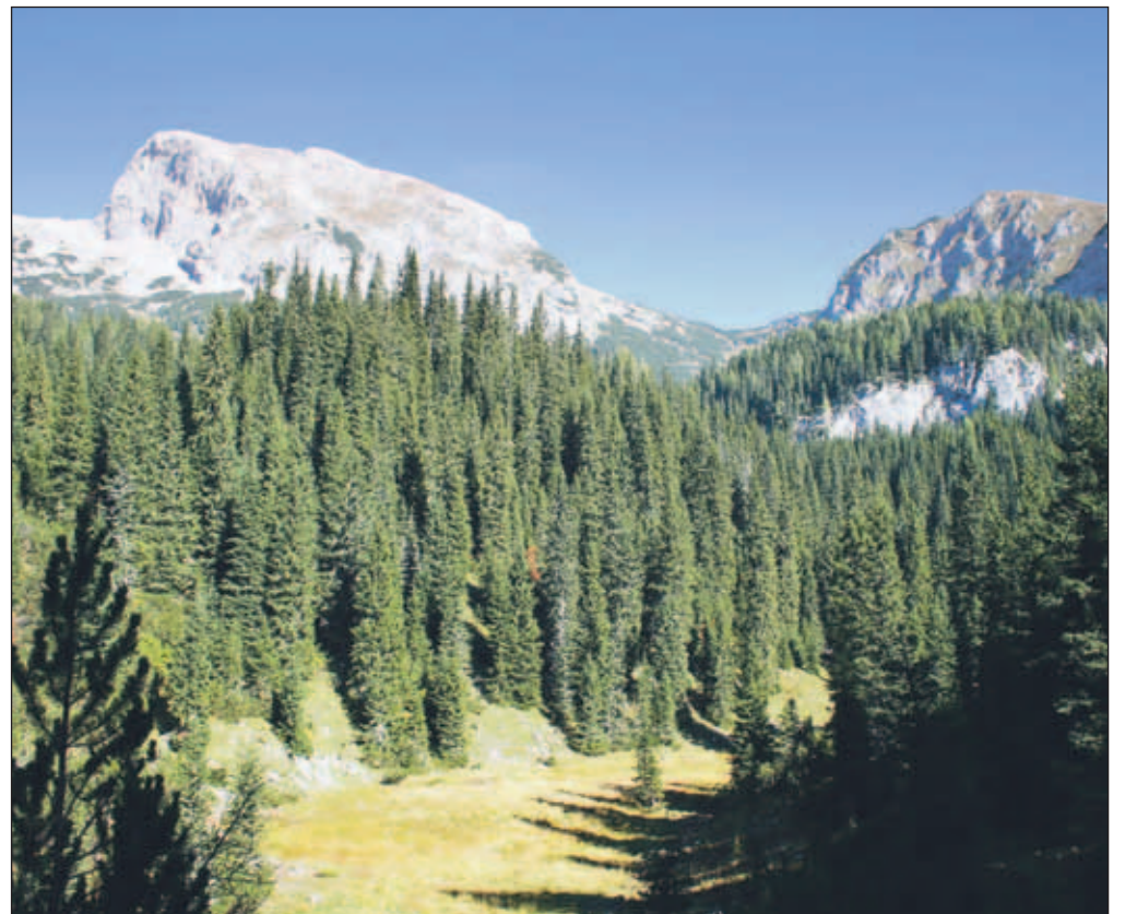
Najraje ima gozdove z jasami in bujnim grmovjem, kjer se mozaično izmenjujeta star in mlad gozd.