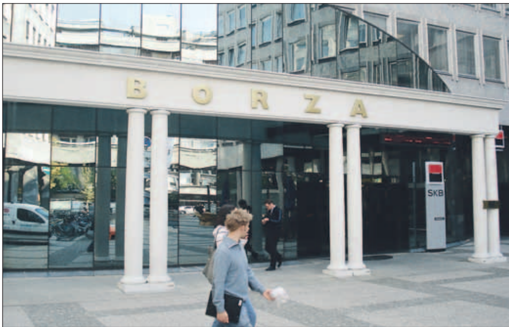
Posledica finančne krize se odraža tudi v padanju delniških tečajev na Ljubljanski borzi.

Posledice finančne krize posredno občuti tudi Slovenija. "V GBD delimo usodo ostalih investitorjev. Vrednost lastnega portfelja se nam je znižala, promet na borzi je manjši, naročil je manj, več pa je truda, da lahko uspešno upravljamo premoženje. Tu pridejo do izra-