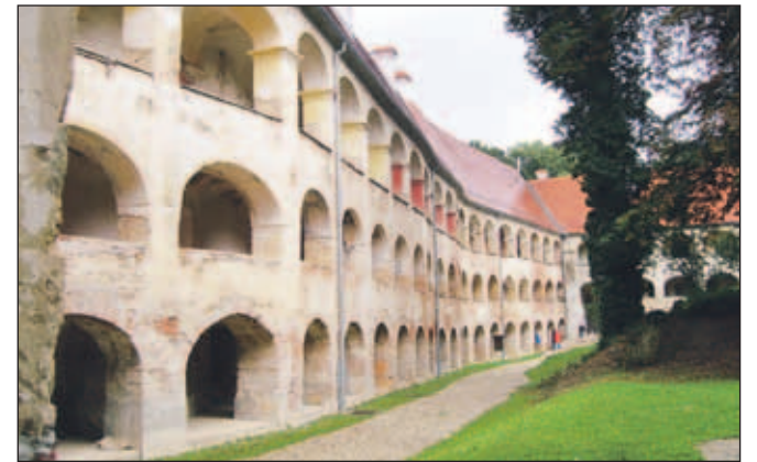
Grad Grad na Goričkem