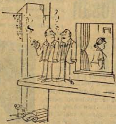
— To je edini prostor, kjer lahko v miru pokadim cigareto.