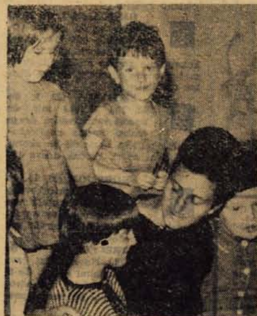
Otroci se najraje zberejo okrog vzgojiteljice, ki ve na moč veliko pravljic

zaradi bolezni, drugi zopet zaradi predolge in prenaporne poti. Svoj drugi »dom« so ti otroci našli v mogočnem in zelo prijetnem poslopju — v dražgoški šoli. Prostrani pašniki in njive, bližnji gozdovi, gorski zrak in poljetje, vse to je za otroke vir zdravja, ki si ga med sivimi zidovi prav gotovo ne morejo pridobiti. To in pa družba svojih sovrstnikov jih bo vrnila v mesto nasmejanih obrazov, s katerih se dolgo ne bo izgnila barva prijetnega gorskega sonca.