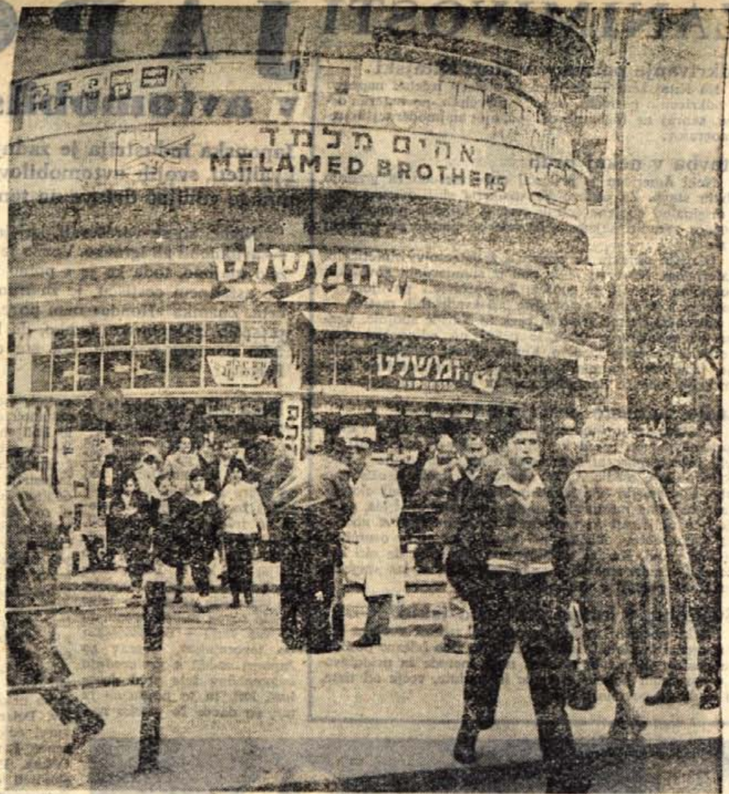
Moderne četrti v izraelskem mestu Tel Avivu, ki je središče dežele. Življenje v tem mravljišču je podobno življenju v drugih sredozemskih mestih.

Izraelci so morali reševati številne težke probleme. Če v Tel Avivu ne bi zapazili hebrejskih napisov, bi lahko to mesto šteli med najlepša mesta ob Sredozemlju. Stanovanjske četrti ležijo ob morju. Niso zelo oddaljene od širokih bule-