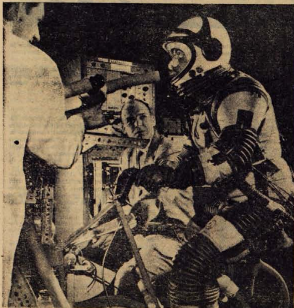
Potovanje z motornim kolesom na Mesec prav gotovo ni mogoče. Toda človek, ki ga vidite na sliki, je popolnoma opremljen za vožnjo na Luno. S pomočjo raznih pripomočkov preizkušajo v nekem ameriškem letalskem laboratoriju porabo kisika ob večji globlinosti. Astronavt ima na sebi naprave, ki jih bodo imeli tudi ameriški astronauti, ko bodo čez štiri leta začeli svojo vožnjo po vesolju

Strokovnjaki velikih evropskih avtomobilskih tovarn so zaskrbljeni. »Čez dve leti«, pravijo, bodo Japonci našli največji nasprotniki na evropskih cestiščih.