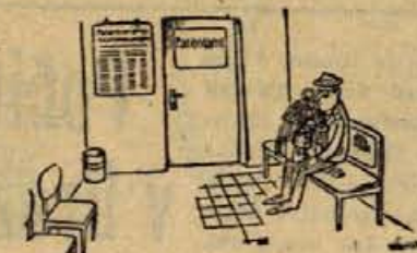
V patentnem uradu