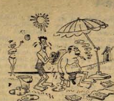
— Ali je tako bolje, tovariš šef?