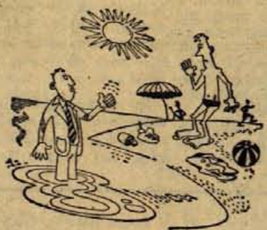
— Ne čudite se, enkrat so mi že ukradli obleko!