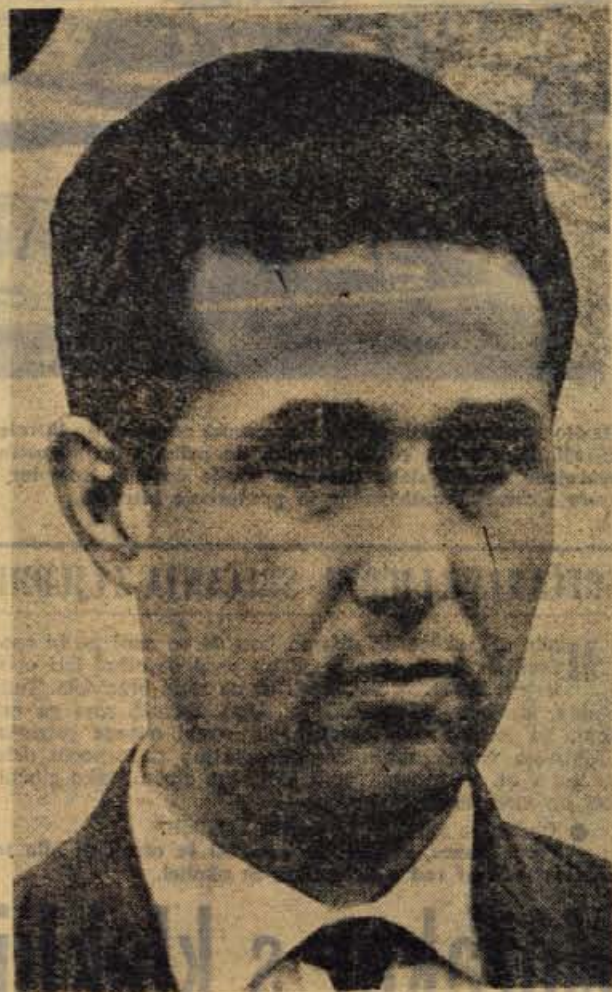
BEN BELA, predsednik alžirske vlade, je še vedno legendarni junak alžirskega naroda

stvu so Alžirci napravili najbolj revolucionarni skok naprej, ko so zapuščeno zemljo evropskih priseljencev prepustili delavcem v upravljanje. Tako se je na alžirski vasi začela najprej alžirska socialna revolucija.