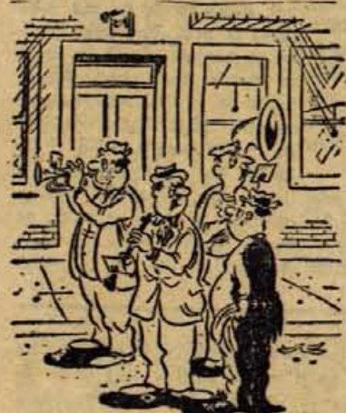
— Ne, mi ne potrebujemo dirgenta!