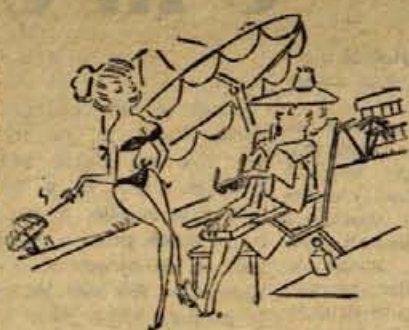
— Kaj še vedno nosite črnino za vašim pokojnim možem?!