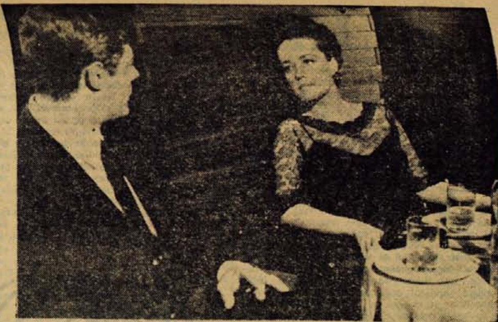
Jeanne Moreau in Marcello Mastroianni v Antonionijevi »Noči«.

Antonionijeva pozornost in prizadevanje je usmerjeno k dvema ciljema: h kritičnemu prikazovanju sodobne družbe in k problemom posameznika, njegovega čustvenega in miselnega sveta. Družbena