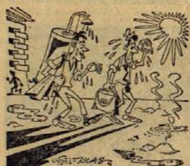
— Kaj hočeš, delam honorarno in nimam časa, da bi se šel kopat.