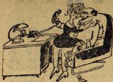
— Kliče te mož, želi zvedeti, če sem te zaposil!?

RIBI (20. 2. do 20. 3.) Položaj na čustvenem področju bo precej nejasen. Zato povzemi iz zaključkov, ali se še spleča noreti za to osebo. Navežeš nove stike, s katerimi se odprejo nove možnosti.