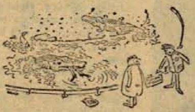
— Kaj ne vidite, da je prepovedano hraniti živali!

R ad sem kritiziral. Na prvem podjetju. V tem podjetju so bile sestanku podjetja sem se nepravilnosti z devizami. Enkrat so spravil na direktorja. Ne bile, enkrat pa jih — iz nepojasnjenega vzroka — ni bilo. To se dvajsetih, zakaj je letno 6 mesecev na službenem potovanju, zakaj vatnih računih v raznih bankah po