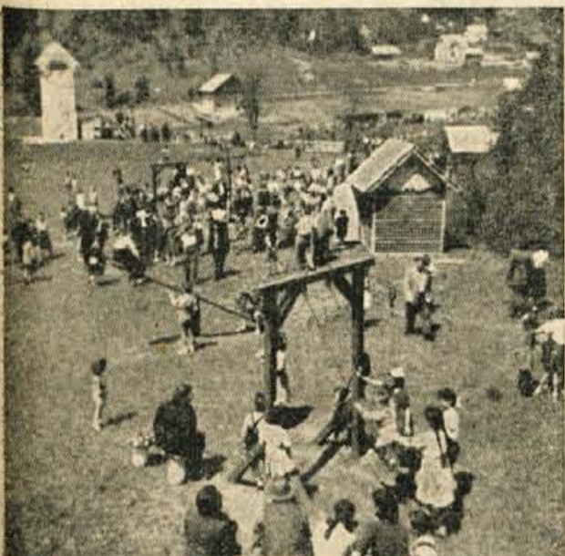
Naši otroci nas osrečujejo

Razen prireditve, ki bodo v nedeljo, tudi drugi dnevi Tedna niso izvenili v prazno. Člani ZB so že 1. junija priredili pionirski izlet na Doslovsko planino. V sredo so pionirji tekmovali s skiro-kolesi. Dječaki brezniške gimnazije so si v četrtek ogledali hidrocentralo v Mostah. Bilo pa je tudi več predavanj, zdravstvenih in vzgojnih ipd. Če bo še nedeljska prireditev tako lepo uspela, bo Teden matere in otroka v Žirovnici dosegel svoj namen.