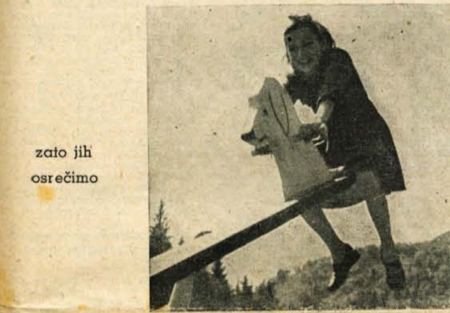
zato jih osrečimo