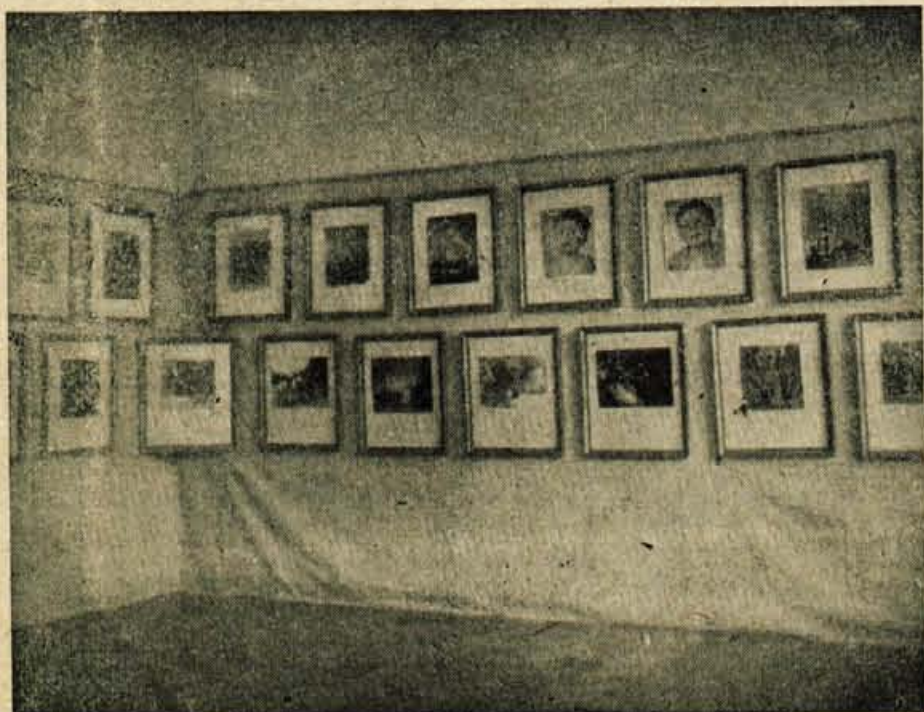
Z razstavo naših fotoamaterjev