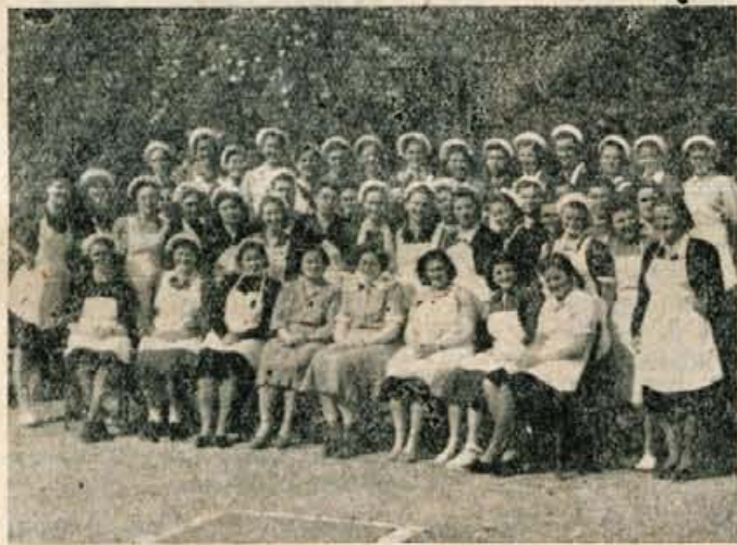
Spomin na prvi gospodinjski tečaj v Inteksu

Gmotna šibkost nam ni dopuščala, da bi ob zaključku tečaja priredile razstavo. Pripravile pa smo s kulturnim programom vred tudi zakusko, oziroma skromno večerjo za tiste, ki so bili najbolj zainteresirani (Nadaljevanje na 4. strani)