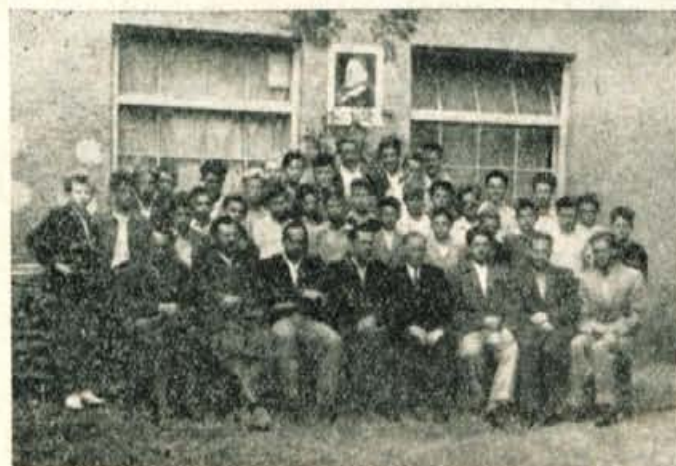
Ob otvoritvi Puškarske šole v Kranju: prvi učenci skupaj z vodstvom šole, predstavniki oblasti in Zveze vojaških voj. invalidov

Godba na pihala v Tovarni športnih čevljev v Zireh je v nedeljo prvič gostovala v oddaljenem zadržnem domu v Hotavljah. Pred nedavnim osnovano godbo sestavljajo mladi godbeniki, zato je bil program še nekoliko enoličen, izvajali pa so ga precej dobro. Koncertu je sledila zabava.