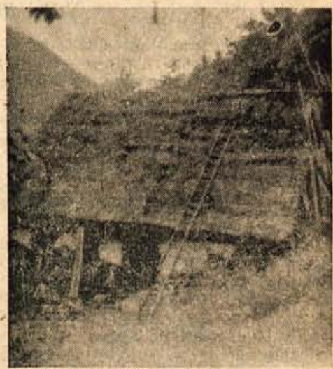
Hiša tehnike »Črni dvor«

zasilnim izhodom, vse stoji na istem mestu. Ta spomenik je tedaj v dobrih rokah, ni potreben boljše oskrbe, vsaj trenutno ne. Klet služi za hišno shrambo, ali notranja oprava pri tem ni nič prizadeta. Hiša je krita s slamo. V primeru požara bi bila v nevarnosti tudi tehnika.