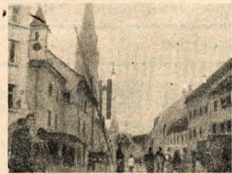
Gasilske vaje v Kranju

S svojo marljivostjo in požrtvovalnostjo so zgradili gasilske domove, ki so bili mnogokrat edina svobodna tla, razkatero je bilo mogoče izpregovoriti tudi svobodno besedo. Zato je in bo dolžnost množičnih organizacij OF, vključno sindikatov, da izkazujejo gasilcem svoje