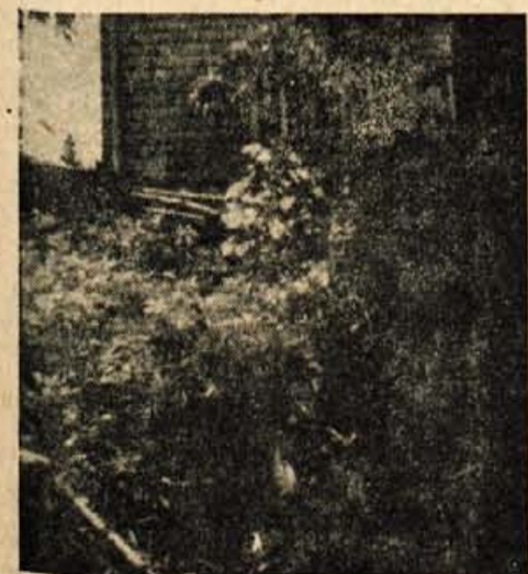
Zasilni izhod tehniko Gorenj. odreda na Martinj vrhu