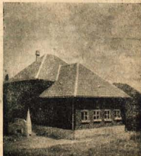
Šolsko poslopje na Martinj vrhu