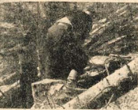
Posek je silno važen. Brigadirja iz frontne brigade „Lidije Sentjurčeve“ izpod Storžiča pri tem delu