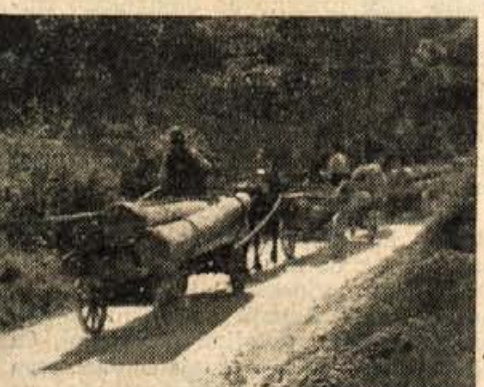
Vozniki prevažajo hlodovino iz Puterhofa v Trzič. Tudi „furmani“ so vsi zaposleni in na tej sliki jih je zajel naš fotoreporter kar celo vrsto