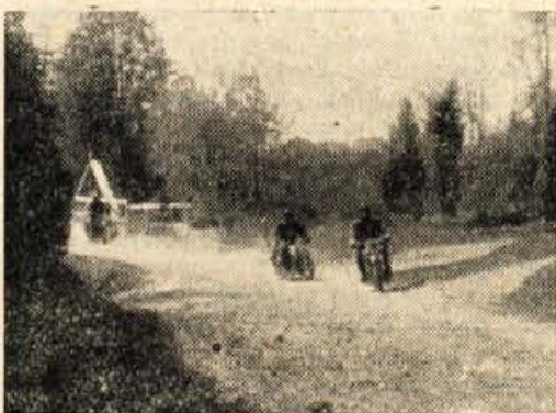
Prizor iz moto-dirke v Kranju

Pozdravu zastavi je sledil nagovor tov. ravnateljice. Po nagovoru so nastopajoči izpraznili igrišče, nakar so prikoralaki v treh kolonah pionirji. Izvajali so zadovoljivo vaje s palicami. Opazilo pa se je, da manjka poedincem smisel za