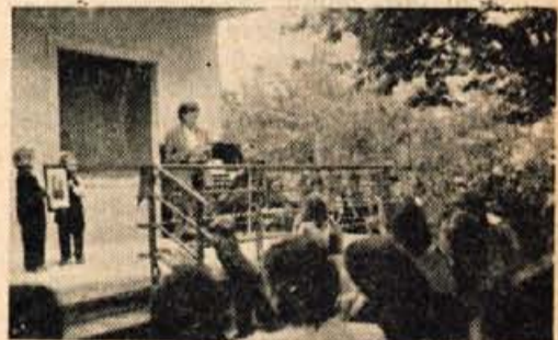
Ob otvoritvi DID-a na Planini

Tako je v partizanih dočakala pomlad 1945, tisto veselo pomlad, ki nam je prinesla tako dolgo pričakovano svobodo. Toda ona ni bila tako srečna, da bi prišla v dolino z armado osvoboditeljico.