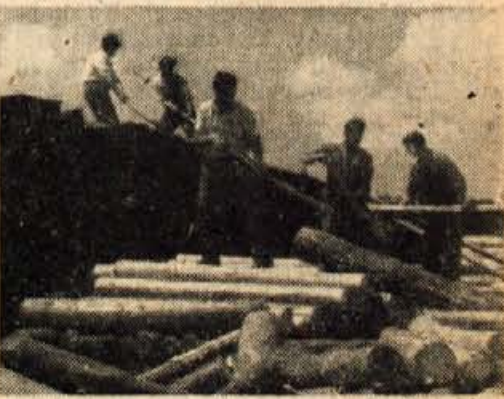
Les se takoj odpravlja dalje. — Frontovci pri nakladanju vagonov v Naklem

Za izvedbo preostalega plana je potrebno treba še uporne borbe. Potrebno je odvreči misel „prišli smo za 20 dni“. Ne! Vsak kmet, delavec, ve, kadar se resno loti določenega dela ne bo prenehal jutri, ko se je morda naveličal, ampak bo delal dokler ne bo gotovo. Ker je na iniciativo KP prevzela tako veliko in važno nalogo Osobodilna fronta, ne bomo in ker tudi nikoli nismo obstali na pol poti, ampak se bomo le še uporneje spoprijeli z planom in tekmovanje prenesli na vsakega brigadirja kot je to v Dolžanki. Zato je za vse produktivne brigadirje, ali one, ki ob tej veliki in važni nalogi direktno ali indirektno sodelujejo — edino geslo: „Končali bomo — toda takrat, kadar bomo ne samo dosegli, ampak tudi presegli določen skupni gozdarski plan v (Nadaljevanje na drugi strani)