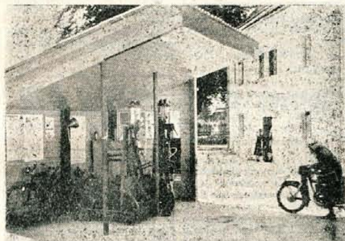
Provizorična bencinska črpalka nasproti hotela »Razor«