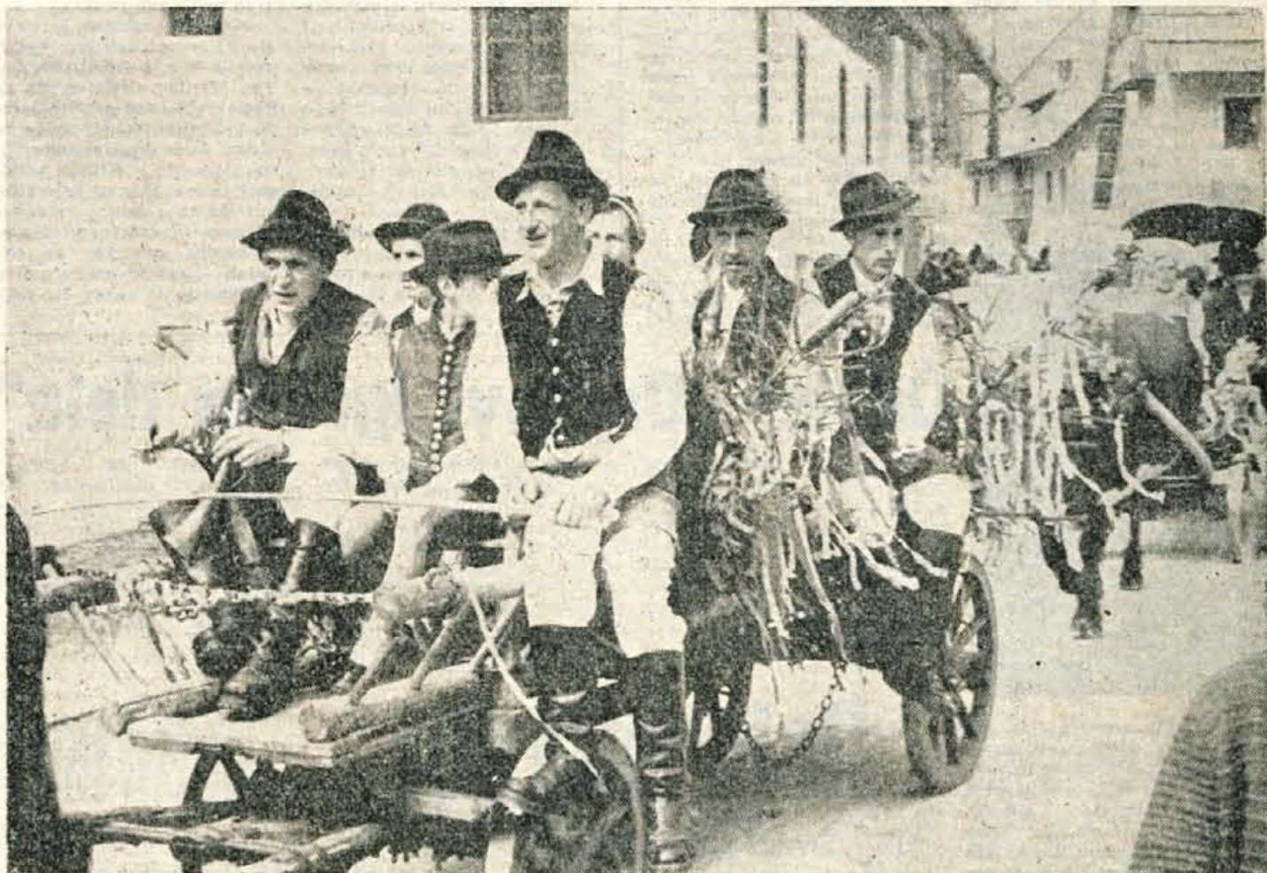
Prireditve, kakršne so se v zadnjih letih na Gorenjskem že precej uveljavile (Kravji bal in Kmečka oheet v Bohinju, Ovčarski bal na Jezerskim in Pastirski rej v Planici), so za turizem nedvomno velikega pomena, saj privabijo veliko domačih in tujih turistov, ki si z zanimanjem ogledajo bogastvo gorenjskih narodnih noš in običajev, ki v poslednjih letih vse hitreje izgirajo. In prav zato, da tudi znanec ohrani vsaj delček življenja naših prednikov, so te prireditve še pomembnejše. — Na sliki je prizor iz Pastirskega reja, ki je bil v nedeljo ob vznožju 125-metrške skakalnice v Planici. Na prireditvi, ki prikazuje spomladanski odhod živine v planino in jesenski prihod živine iz planine ter številne običaje in narodne plesse v zvezi s tema dvema pastirskima praznikoma v Ratečah, so nastopali najstarejši Ratečani in Ratečanke v narodnih nošah, tudi po 80 in 90 let stari, ki so ta pastirski praznik še sami doživljali

Organi okrajnega ljudskega odbora v Kranju so pripravili potrebne podatke za sejo Sveta za plan in finance, ki bo v četrtek, 25. avgusta. Razpravljali bodo o izpolnjevanju gospodarskega načrta v našem okraju. Tako je predvidena razprava o finančnem stanju OLO in ObLO ob zaključku letošnjega prvega polletja, za tem poročilo in razprava o izpolnjevanju proizvodnih nalog po količini v gospodarskih organizacijah kakor to predvidevajo postavljeni gospodarski načrti, o izpolnjevanju izvoza, o zaposlovanju in podobno. Prav tako je na dnevnem redu seje predlog o načinu dajanja posojila uslužbencem OLO za gradnjo stanovanj, predlog o kreditu v višini 15 milijonov dinarjev Tovarni hladilnih naprav v Skofji Loki in druge zadeve.