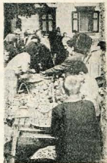
Gneča na »tržnici« pod koštanjem v Kranjski gori

Kranjska gora je torej v teden dni s turisti v glavnem polno zasedena, bolj, kot bi bilo pričakovati z ozirom na ne najboljše vremenske pogoje. To nam potrjuje tudi samo kratek sprehod skozi naselje: na vsakem