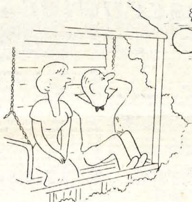
Kakšna lepa mesečina — škoda je le, da sva poročena