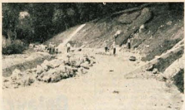
Delavci pri zidanju podpornikov. Dela za odvajanje vode se vršijo višje na pobočju. Povsem na levi je vidna ogrožena hiša