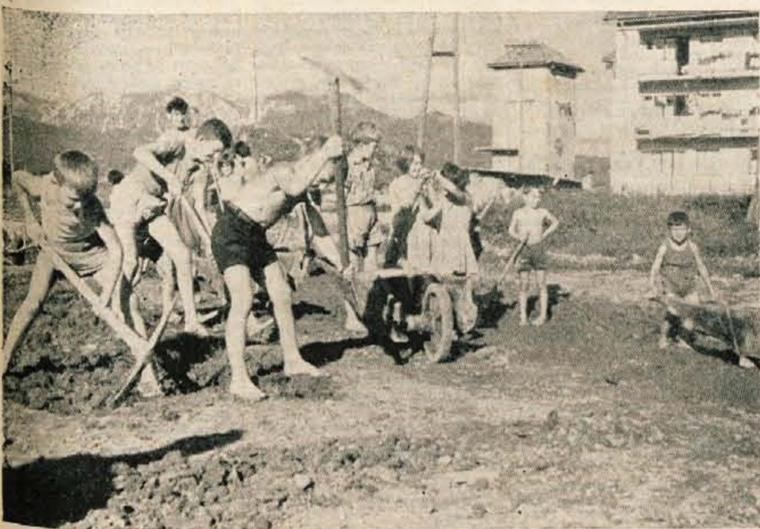
Takole delajo pionirji na Zlatem Polju

Na Zlatem polju nastajajo nova igrišča - Pionirska delovna brigada s 44 pionirji