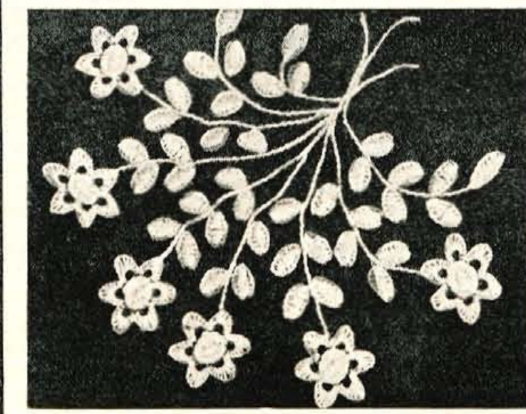
nje (na primer: na vinsko rdeči podlagi beli ali sivi šopki, ali na olivno zeleni blede rumeni šopki, ali na modrem prtu beli ali svetlo modri).