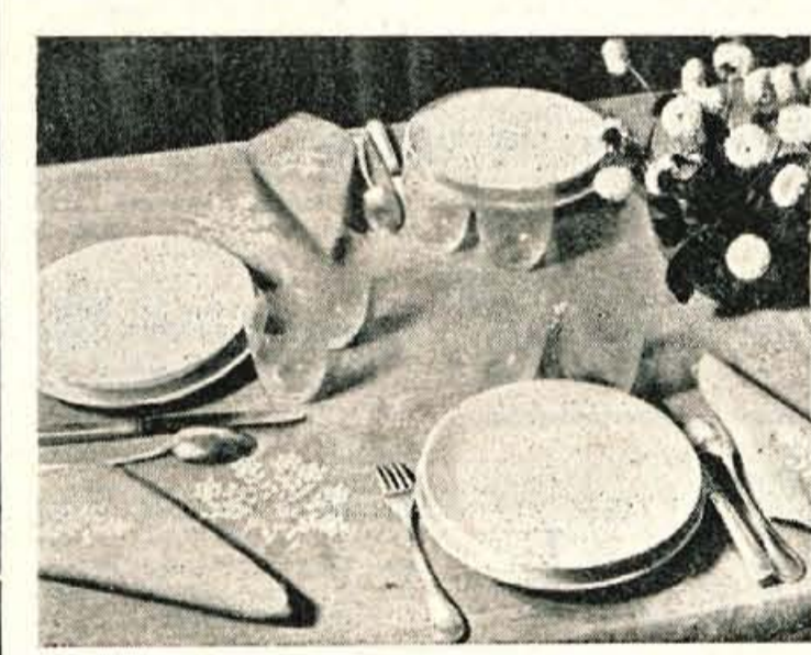
Mogoče imate pravkar dopust in se utegnete nekaj ur pomuditi tudi pri vezanju. Na pri iz lanenega platna brez kakšnega posebnega reda izvezite nekaj šopkov s svetlejšo nitjo za veze-