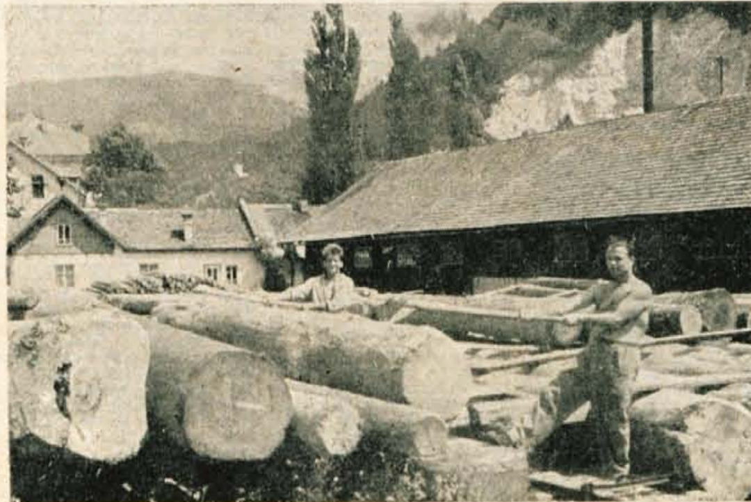
V lesni industriji, zlasti v gozdarstvu, se zelo počasi uveljavlja sodobna tehnika in mehanizacija sploh. Nekateri trdijo, da je to posledica premajhnih investicij, ki so določene tem dejavnostim. Na sliki: Pred žago LIP Tržič ob tamkajšnji železniški postaji