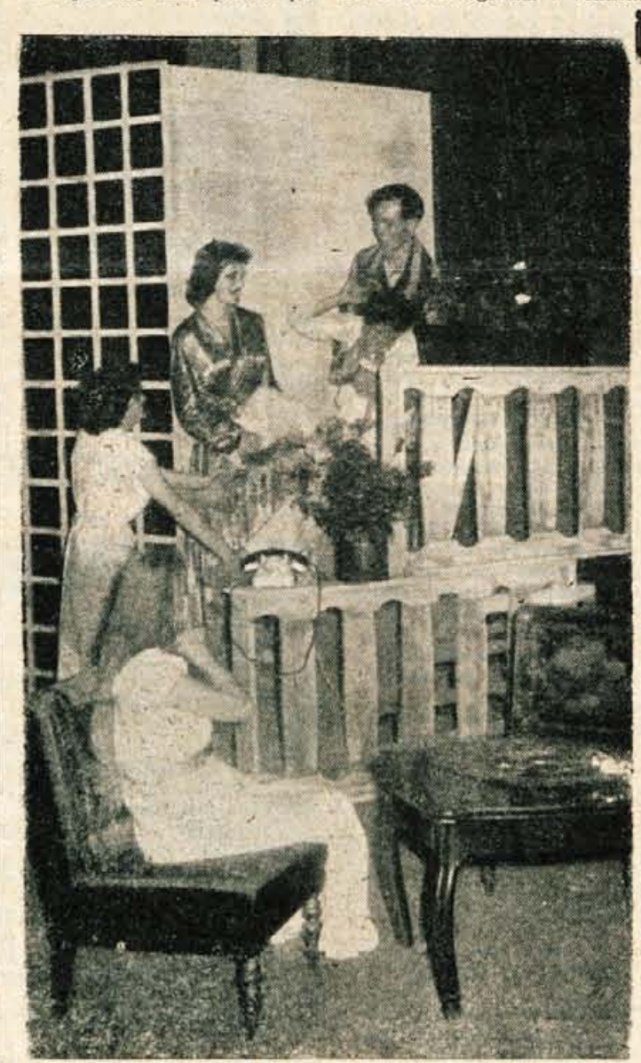
Prizor iz prvega dejanja Pugettovih Srečnih dni v tržiški uprizoritvi