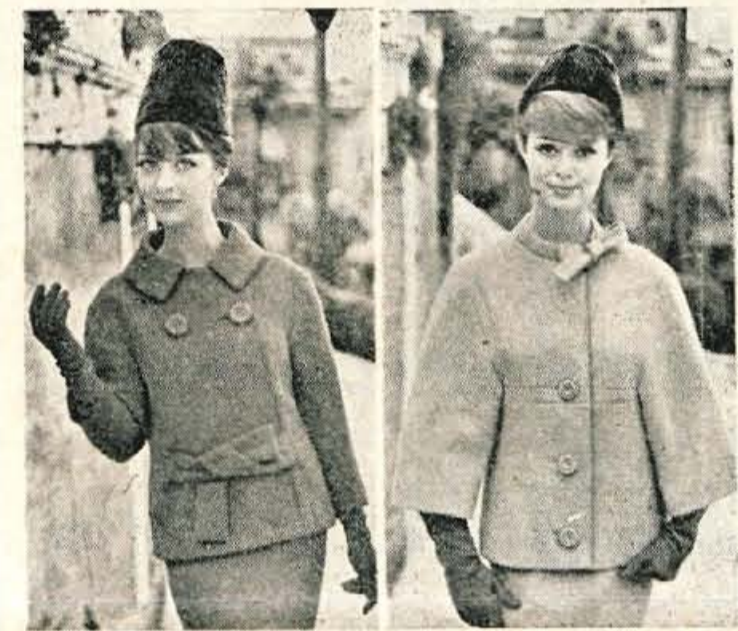
Klasični ženski kostimi so še vedno primerni za nekatere priložnosti, vendar zanje ne moremo več reči, da so zelo moderni. Zamenjali so jih dvodelni kompleti, ki jih odlikuje več ženskosti in domišljije. »Boucle« tkanina bo v jesenskih modelih pogosto zastopana, iz nje sta tudi modela na naši sliki.