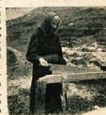
njena je tudi še sušilna jama. Na sliki je stara ženica pri trenju lanu, v ozadju pa se vidi del sušilne jame.

Zanimivo je tudi, da je Dovje še do danes ohranilo domačo platnarstvo. Tu še zdaj sejejo lan, ki so ga drugje pri nas že skoraj popolnoma opustili. Ohran-