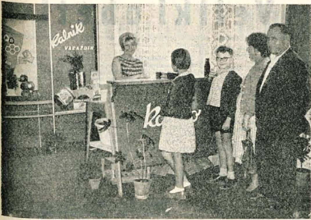
KRANJ, 9. avgusta — Danes zvečer so se vrata X. jubilejnega Gorenjskega sejma zaprla. Predvidevanja glede obiska so se uresničila, saj si je razstavišne prostore ogledalo nad 100.000 obiskovalcev (številka uradno še ni potrjena). — Na sliki: Pred paviljonom tovažne »Kalnik« iz Varaždina je bilo vse dni živahno. Sadne sokove, zlasti pa »Kalko«, so številni obiskovalci sprejeli z velikim veseljem