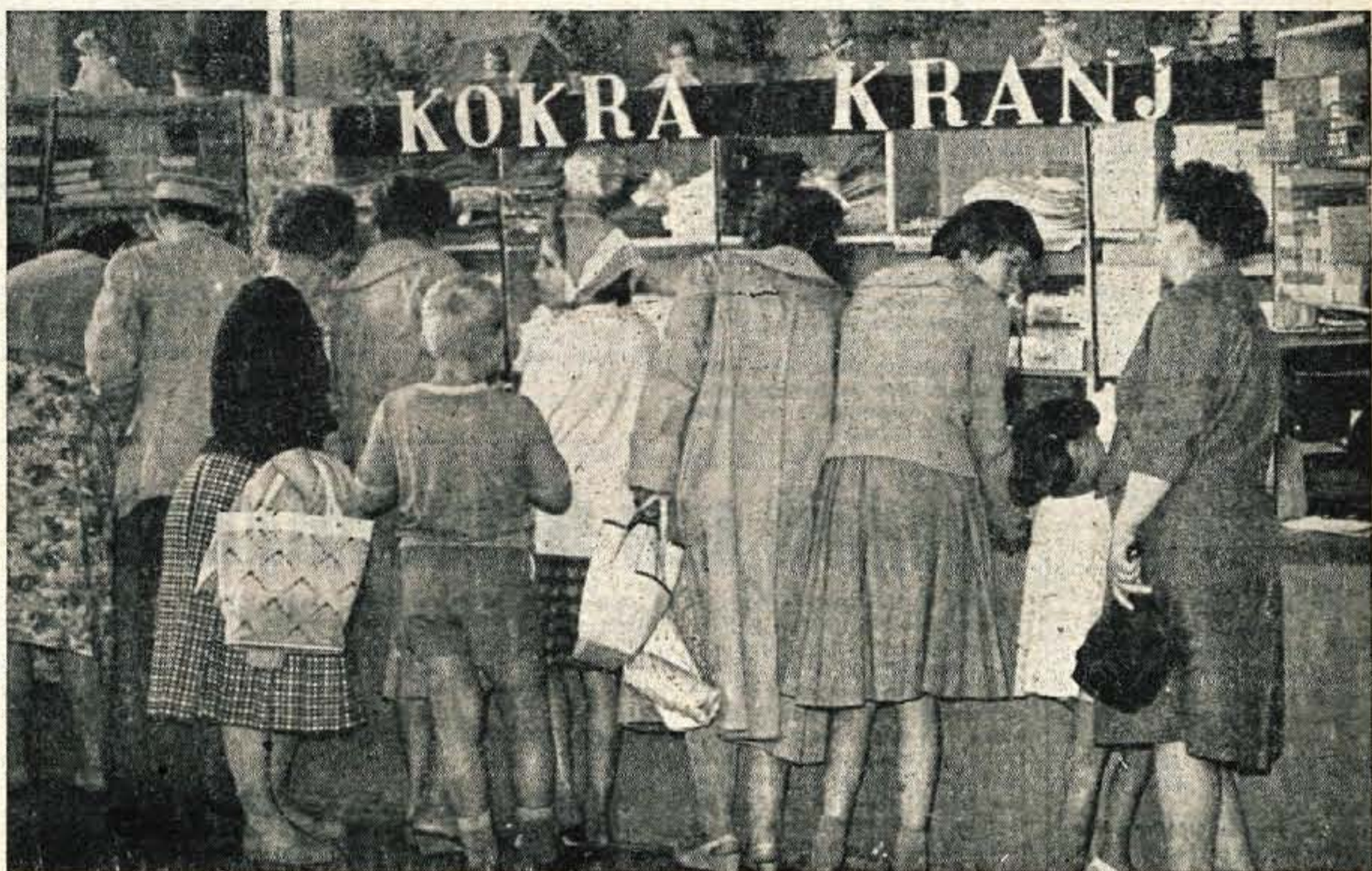
Vse dni sejma pred paviljoni ni zmanjkalo kupcev. Podjetja so prodala toliko blaga, da ga jim je zadnje dni celo primanjkovalo

Take in podobne so težave, ki spremljajo pozitivne napore občinskih organov, da bi kar najbolj prilagodili delovni čas na ljudskem odboru potrebam in željam prebivalstva. — l.e.