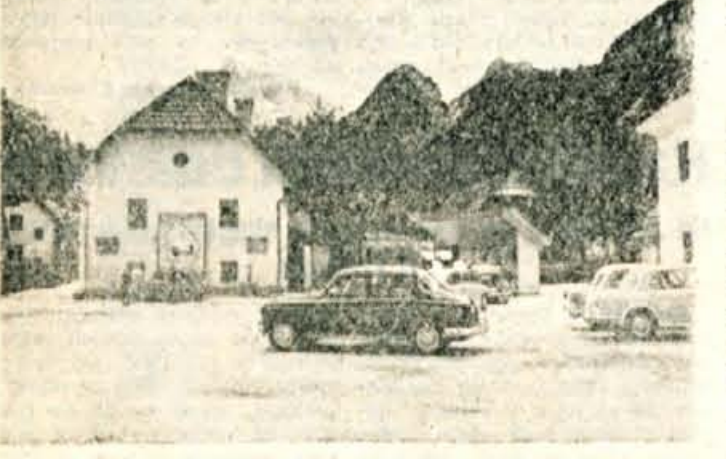
V Kranjski gori je običajno vsak dan zelo živahen promet skozi vse leto. Kot vidite na sliki, je vsak dan pred bencinsko črpal- kovo nasproti Razorja vedno precej motornih vozil. Zato je tudi povsem upravičena gradnja mo teta in parkirnega prostora

»Ker ste končali triletno vajeniško šolo, bi morali v najslabšem primeru dobiti prejemke nekvalificiranega delavca. V tem primeru, ker ste praktični izpit opravili uspešno, to je polovica izpita, vam prav gotovo pripa- dajo prejemki polkvalificiranega delavca. - Vsekakor je začelno, da izpit za kvalifikacijo čimprej opravite.«