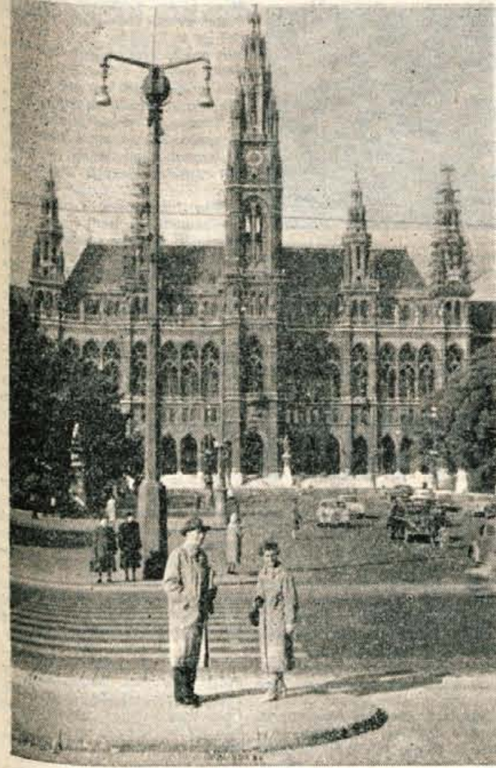
DUNAJ — občinsko poslopje (Retovž)

Kapitan Lund je pristavil, da obstoji okoli 350 vrst morskih psov, od tega pa je le nekaj dvajset vrst nevarnih za ljudi. Dolžina te pošasti je različna — od pol metra do šestnajst metrov. Največji morski pes, tako imenovani orjaški kitajski morski pes, je prav nedolžen, ker se preživlja samo z morskimi živalcami.