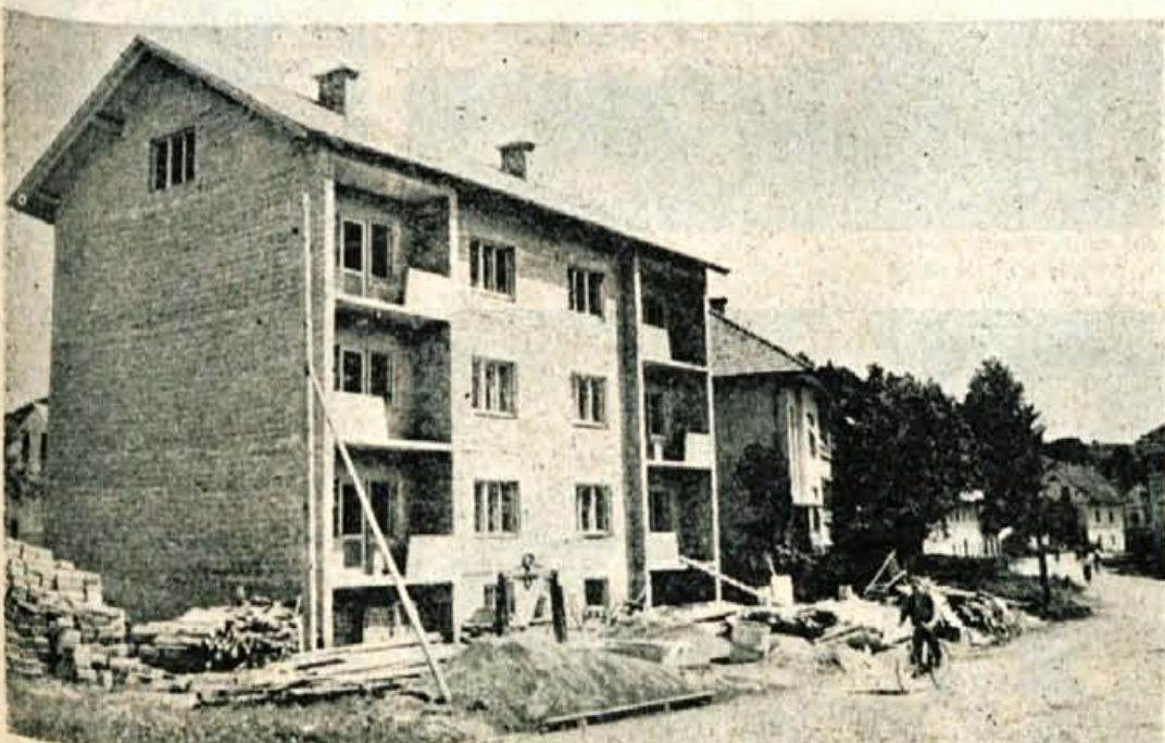
Tudi v Zireh rastejo novi stanovanjski bloki

V II. dekadi so mladi graditelji stadiona v Kranju dosegli naslednje rezultate: kranjska MDB »Slavec Ivo-Jokl« je dosegla 139 odstotkov delovnega učinka, medtem ko je bila mariborska MDB Karel Destovnik-Kajuh za 13 odstotkov slabša. Brigadi sta dosegli 132,5 odstotka povprečnega delovnega učinka. Za delo na trasi in v taboru sta bili obe brigadi že drugič priznani za udarni.