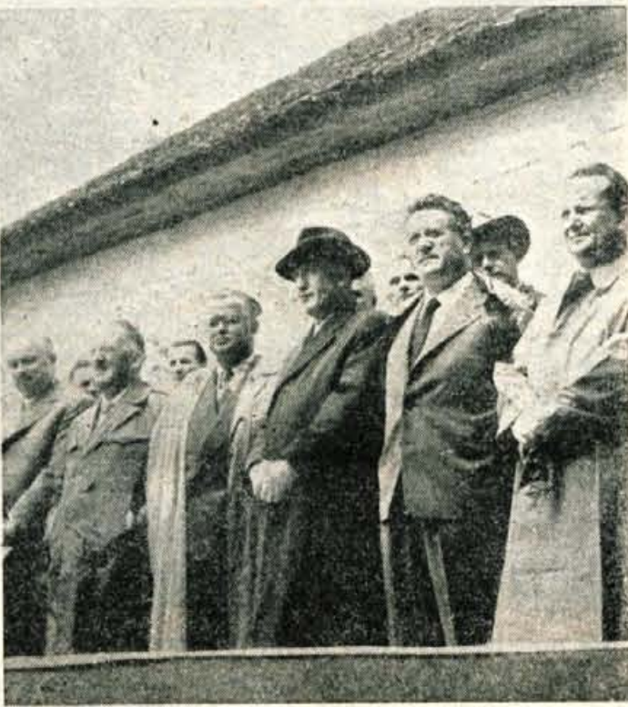
Govor na svečani tribuni med proslavo

(Nadaljevanje s 1. str.) čanja družbenega proizvajalca v Jugoslaviji sodi med najvišje na