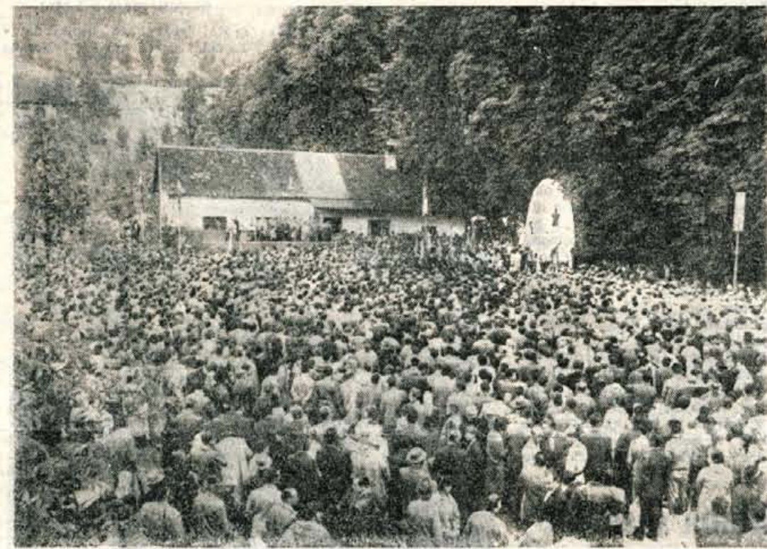
Nad 10.000 ljudi na svečani proslavi v Begunjah

dogodkom, proti vsaki taki politiki, ki bi gradila na oboroževanju le kot dežela z neodvisno in samostojno mednarodno politiko,