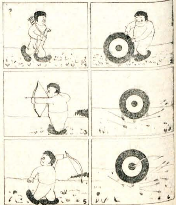
Binček - strelec

»V šoli si zelo dober uče- nec. Kateri predmet imaš najraje?« »Tehnični pouk, na drugem mestu pa je matematika. Ze- lim si, da bi nadaljeval šol- lanje na Srednji tehnični šo- li.« »Čitaš »Mlado rast?« »Da, redno. Včasih tudi so- sodelujem s krajšim prispev- kom.« »Zeliš še kaj povedati za za konec?« »Vesel bi bil, če bi v »Mla- di rasti« objavljali slikanico v nadaljevanjih.«