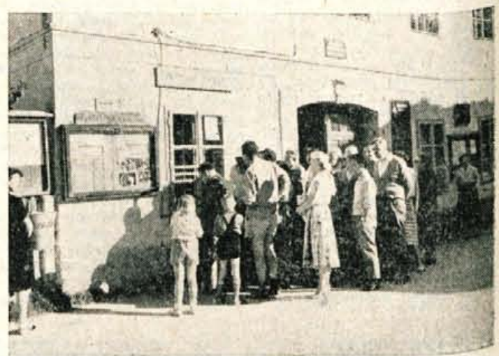
Vsakanjanja vrsta pred prodajalno tobaka v Kranjski gori. Le na kaj čakajo turisti? Na — dnevno časopisje! Zalostna je ta slika za turistični kraj kot je središče gornjesavske doline.

500.000 DINARJEV NOVATORJEM Jesenice Člani delovnega kolektiva Zvezarne Jesenice so v prvi polovici letošnjega leta prijavili že 40 tehničnih izboljšav, ki jih je posebna ocenjevalna komisija pregledala.