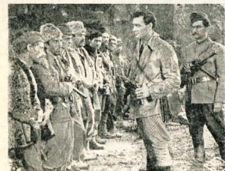
'Kota 905' je naslov jugoslovanskega celovečernega filma, katerega premiera bo v kranjskem Storžiču že v prihodnjih dneh.