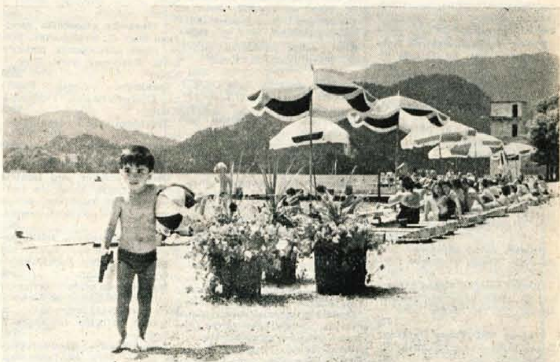
Turistična sezona je v polnem razmahu. To kaže tudi ta posnetek z novega blejskega kopalnišča, ki so ga do letošnje kopalne sezone dokončno uredili. Kopalcem sicer v teh dneh precej nagaja vreme, vendar izkoristijo vsako sončno uro za kopanje in sončenje

trgovski mreži in gostinske usluge), saj predstavljajo ti 67,3% skupnih izdatkov, vendar so letos močno porasli tudi neblagovni izdatki (za 50,4%, blagovni pa le za 4%), ki predstavljajo letos že 32,7% vseh izdatkov, medtem ko so jih lani predstavljali le 25,3%. Zanimivi so tudi podatki o hranilnih vlogah in potrošniških kreditih. Hranilne vloge so v prvem tromesečju letos porasle za 116 milijonov dinarjev (za 39,3% v primerjavi z lanskim prvim tromesečjem), število vlagateljev pa se je zvišalo za 1.645. Potrošniški krediti pa so v prvem tromesečju letos porasli za 166 milijonov dinarjev. Največ potrošniških posojil je bilo najetih za industrijsko blago in motorna vozila z dvoletno odplačilno dobo.