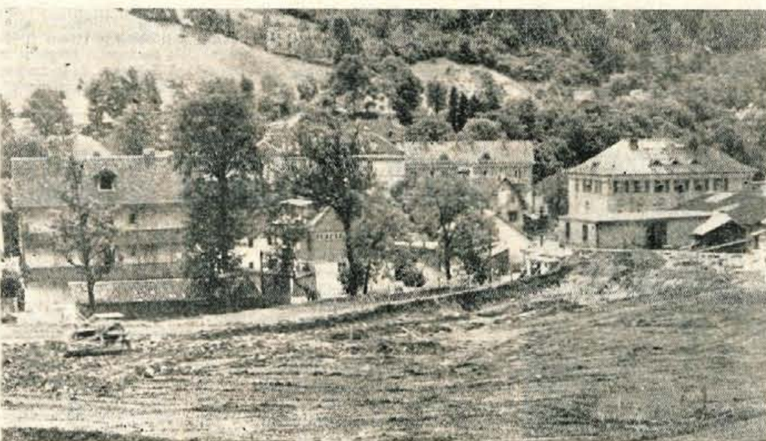
Zdravstvo je v Trzličju že nekaj let na dnevnem redu. Problem pa postaja zaradi slabih pogojev iz leta v leto večji. Prav zaradi tega so Trzličjani s tolikšno večjim veseljem sprejeli novico, da so v njihovi komuni končno vendarle pričeli z gradnjo novega zdravstvenega doma (na sliki).