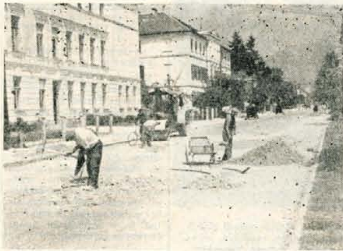
V številnih mestih in predelih Gorenjske so se letos lotili z vsemi silami ureditve cest. — Na sliki: Radovljica bo že zaradi novih cest povsem spremenila nekdanjo podobo

Kot prejšnja leta bodo tudi letos svoj krajevni praznik kar najsvetlejeje proslavili z različnimi kulturnimi, športnimi, zabavnimi in drugimi prireditvami. V nedeljo bodo na tem področju odkrili številna spominska obeležja. Preko tedna pa se bodo vrstile številne športne prireditve — tako tekmovanje v streljanju, sledil bo šahovski turnir, na katerem bodo sodelovala moštva iz Šenčurja, Predoselj, Velosovega in Kamnika. Istega dne bo izvedena tudi simultanka. Sledile bodo tudi dramske prireditve v Šenčurju, kulturni spored bodo izvedli tudi v Olševku in Srednji vasi, v petek pa bodo gasilci iz Šenčurja in Srednje vasi izvedli veliko nočno gasilsko vajo. V soboto bo dramska prireditev tudi