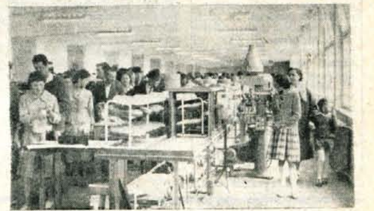
Gostje in domačini so si z zanimanjem ogledali delovne prostore v novem objektu »Peka«.