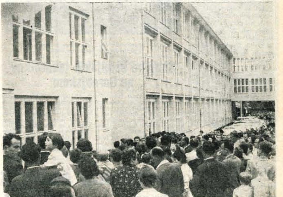
Nedelja, 3. julija, je bila za Tržičane, zlasti pa za člane delovnega kolektiva tovarne čevljev »Peka« veliki dogodek. Ta dan so hkrati s počastitvijo Dneva borca otvorili nov tovarniški objekt, ki bo kolektivno omogočil proizvodnjo po tekočem traku.