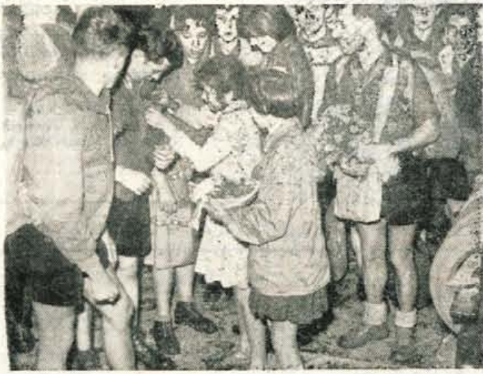
Kranjske tabornice so vsem šestnajstim gostom pripele v pozdrav šopke rdečih nageljnov

NEPAL, 5. julija — Nepalско zunanje ministrstvo sporoča, da je LR Kitajska pristala na to, da bi v kratkem sklicali prvi sestanek komisije za obmejne zadeve, katerega naloga bi bila, določiti meje med obema deželama. Komisijo so ustanovili na podlagi kitajsko-nepalskega sporazuma, podpisanega marca letos v Pekingu. Po njegovih določbah bosta Kitajska in Nepal poslala vsaka po pet zastopnikov, ki bodo proučevali obmejne probleme. Znano je namreč, da se je LR Kitajska opravičila pred tem spričo incidenta, do katerega je prišlo prejšnji mesec na meji med obema državama. V spopadu je izgubil življenje nepalski oficir, medtem ko so Kitajci 10 Nepalcev ugrabili.