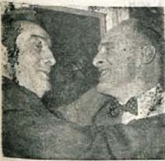
RENÉ CLAIR SPREJET V AKADEMIJO

Znani francoski filmski režiser René Clair (desno) je bil pred kratkim sprejet v francosko Akademijo. Na sliki: Njegov stari prijatelj Marcel Pagnol, katerega delo je Clair smenal, mu prisrčno čestita ob njegovi izvolitvi.