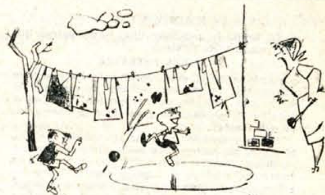
»Brez skrbi, mama, jutri bova imela pri njih doma povratno srečanje!«