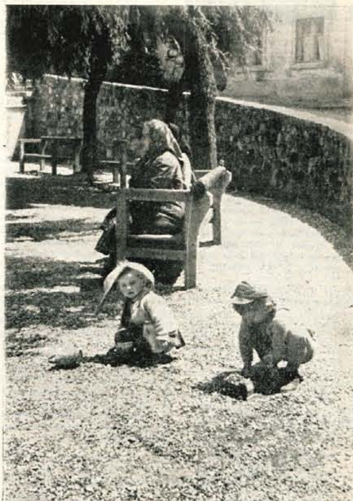
BABICA IN VNUČKA — Babica, ki je na stara leta bolj kot marsikdo, potrebna počitka, ima največkrat odgovoren posel z unučki. Prav zaradi tega bi morali vse bolj misliti na ureditev otroških igrišč in vrtcev

kmetijske gospodarske organizacije so sicer do neke mere že sprejele sistem nagrajevanja, potem pa so nastopile težave z evidenco, in drugič, delavci in uslužbenci s postavkami tega sistema v večini primerov niso seznanjeni. Samo en konkreten (Nadaljevanje na 6. strani)