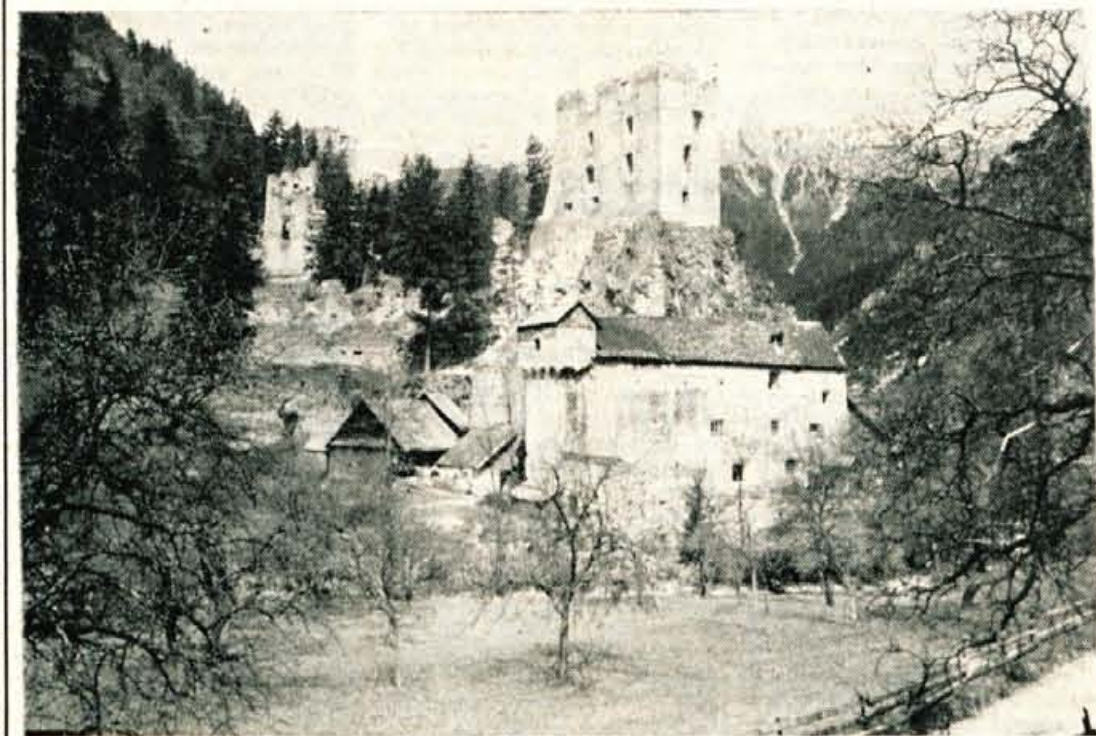
Grad Kamen v dolini Drage pri Begunjah je bogat kulturni spomenik Gorenjske. Prav zaradi tega bodo že 15. junija spet pričeli s konservatorskimi deli. Ko bodo dela končana, bo grad prav gotovo še bolj mikavna turistična točka kot je bila že doslej, zlasti še, ker predvidevajo, da bi postala celotna dolina narodni park

Posvetovanje je bilo pripravljeno brez vnaprejšnjega predvidenega dnevnega reda, kot nekaj družabni pomenek, kar je močno sprostito razpravo in pripomoglo h kopici zelo umestnih in dobrih predlogov za delo organizacij SZDL, o katerih bomo še poročali.