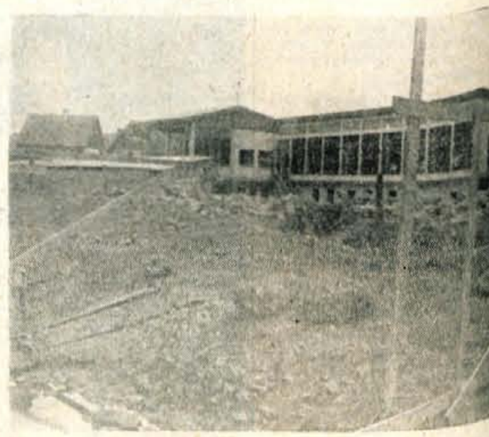
Kopalna sezona se je že začela. Na novem kopalnišču na Sori v Skofji Loki pa je še vedno vse razrito. Pravijo, da bo vse ob pravem času narejeno. Upamo, da ne bo ostalo samo pri besedah