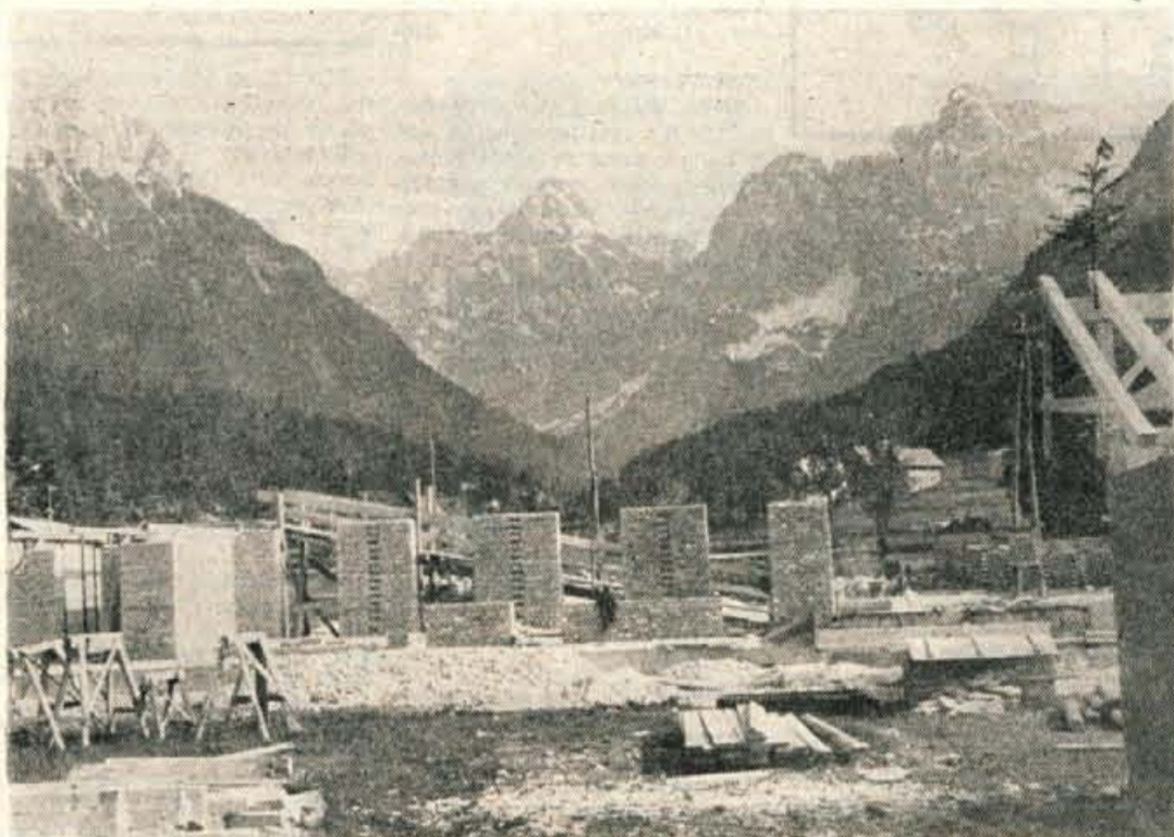
Iz hotela, ki ga gradijo v Kranjski gori, bo lep pogled na Razor in na Prisojnik, kot kaže ta slika

Ko smo se razgovarjali v hotelu Zlatorog in gledali v skalnato Komarčo, ki je komaj do zelenela do vrha, se je pogovor ustavil ob teh posebnostih naših krajev oziroma ob različnih zahtevah in okusih gostov. Nekateri si ob dopustu zaželijo zabave, godbe in življenja. Drugi obratno: želijo miru in počitka. Po takih zahtevah gostje v inozemstvu tudi izbirajo kraj dopusta. Morda pa smo prav sami pozabili na take posebnosti, na različne okuse in potrebe gostov, se premalo prilagojevali njihovim zahtevam, vsaj v propagandi v privabljanju gostov.