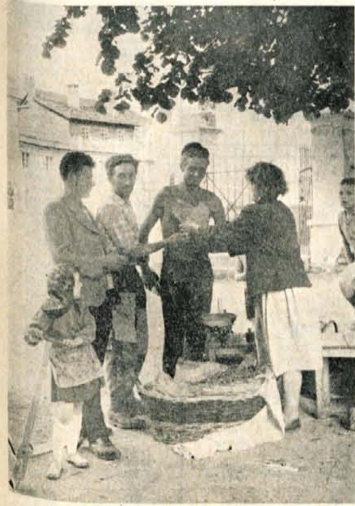
Za turizem v bohinjskem in gornjesavskem kotu je še zmeraj dokaj neurejena preskrba z zelenjavo, sadjem in drugimi povratninami. Tudi ta prodajalca češenj, ki smo jo videli v Kranjski gori, je pravkar prispela z vlakom iz Brd in prodaja češnje karna cesti

Tudi del sredstev od davka na maloprodajni promet bi občine morale nameniti za modernizacijo trgovine. S tem bi se doslej zares zelo aktualen problem financiranja investicij v trgovini občutno izboljšal.