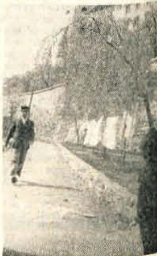
Škofjeloški grad obiskujejo številni domači in tuji turisti. Dnevno obišče muzej preko 100 ljudi, zato obešeno perilo ob poti, ki vodi na grad, zares ne pristoja tamkajšnji okolici

jekta je zares potrebna, saj ima Kranj samo eno provizorično strelišče za vojaško puško v Struževem. To pa je bilo gradeno pred 35. leti za pešične strelce, kolikor jih je bilo takrat v Kranju. Danes pa ima kranjska občina že 24 strelskih družin z 25000 strelci, to je polovico vseh družin in strelcev na Gorenjskem.