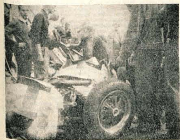
Pred dnevi smo poročali, da je bilo 7 mrtvih in nad 30 ranjenih pri avtomobilskih dirkah v Aix-les-Bainsu, ko je britanski voznik zapeljal na lesen most in se je ta podrl ter pokopal pod seboj njega in množico gledalcev. Na sliki: kraj nesreče

KAMENJE IZ GUME Po sredini avtomobilske ceste je vrsta kamnov, do katerih smejo voziti vozila, ki vozijo v nasprotno smer. Dogaja se, da voznik zapelje na to kamenje in takrat se zgodi nesreča. Da se to ne bi dogajalo, so postavili na francoskih avtomobilskih cestah gumijevo kamenje, čez katero zapelje avto brez vsake nevarnosti, vendar vozilo poskakuje in tako opozarja voznika.