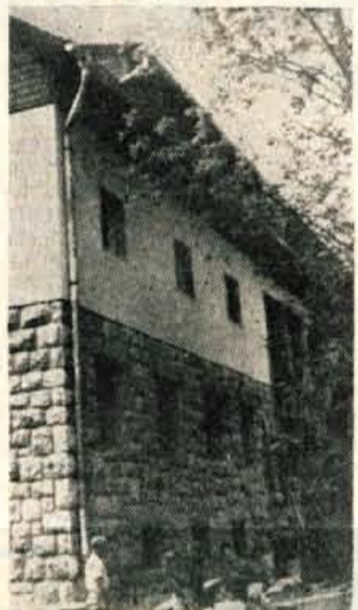
Po dolgih letih so to pot vendar boljše izgledi, da bo dependansa hotela Zlatorog v Bohinju kmalu dograjena

Najbolj nas je zanimala gradnja tako imenovanega hotela, kjer bo 60 postelj in ustrezno