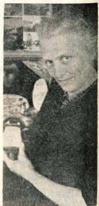
haja tudi neka študentka, ki zna dobro angleško in menda tudi druge jezike.« —l. c.

naših krajev. Tujci pa, ne vem, zelo so varčni, malo kupujejo.« »Koliko blaga ste prodali lani?« »Teško povem kar tako. Zlasti še, ker razen teh spominčkov prodajam tudi cigarete, znamke, razglednice itd. V tistih mesecih sezone sem prodala skupno, pred leti tudi za 2 milijona dinarjev.« »Imate plačano od prometa v odstotkih, po učinku, kot to pravijo?« »Ne. Imam samo stalni mesečni honorar.« »Kako se sporazumevate s tujci. Znaite tudi kak tuj jezik?« »Ne. Tujih jezikov ne znam. Vendar mi to ne dela težav, ker je prav tu zraven turistična pisarna, kjer znajo jezike, če pride kak tujec. Poleti v glavni sezoni pa pri-