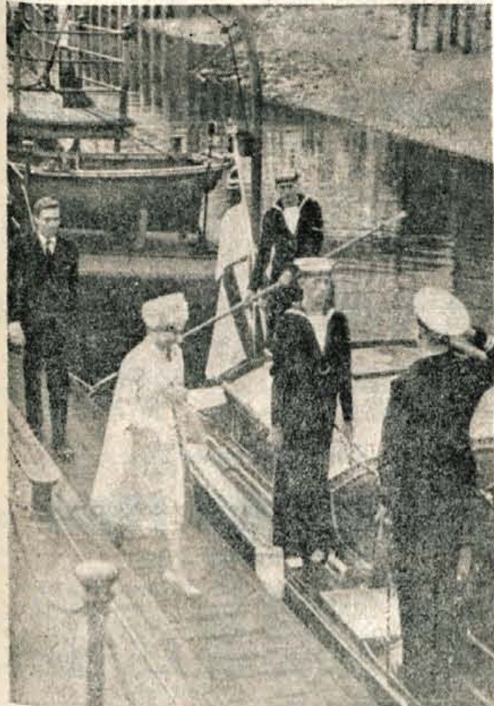
Mladoporočnica: angleška princesa Margareta in bivši dvorni fotograf Antony Armstrong — Jones, sta po poroki, ki si je 6. maja letos, v trijumfalnem sprevodu skozi gost spalir tisočev Londončanov prispela do čolna, ki ju je prepeljal na kraljevsko jahto »Britannia« na poročno potovanje