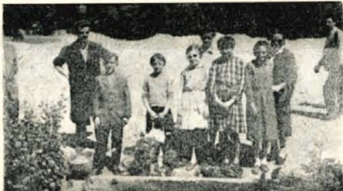
Tovarna »Tiskanina« iz Kranja je denarno pomagala pri gradnji nove šole na Trsteniku. V znak zahvale so tamkajšnji pionirji prinesli v soboto, dne 21. maja, gorsko evetje in kamenje prav iz Krvavea.

Na zadnji razširjeni seji sekretariata Občinskega komiteja LM v Škofji Loki so razpravljali o pripravah za praznovanje Dneva mladosti in počastitve 15. obletnice osvoboditve. Glavna in zaključna prireditev bo 29. maja na telovadišču TVD Partizan, kjer bodo športne igre. V svečani paradii pod geslom »Mladina, šport, kultura«, bo sodelovalo preko 1000 mladincev in brigadirjev. 25. maja bodo šli mladinci na razne izlete v partizanske in druge kraje. Na te svečanosti Dneva mladosti bo mladina povabila vse predstavnike družbenih in političnih organizacij v občini.