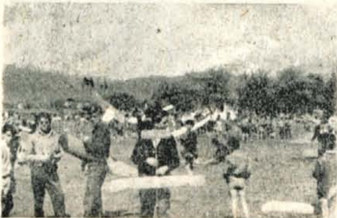
V Lescah so nastopili tudi modelarji

GLAVNI UREDNIK: Slavko Beznik Tel.: uredništva 475, uprave 397 — Tekoči račun pri Komunalni banki v Kranju 607-70-1-135 — Izhaja ob ponedeljskih sreдах in sobotah — Letna naroč. 900 din, mesečna 75 din.