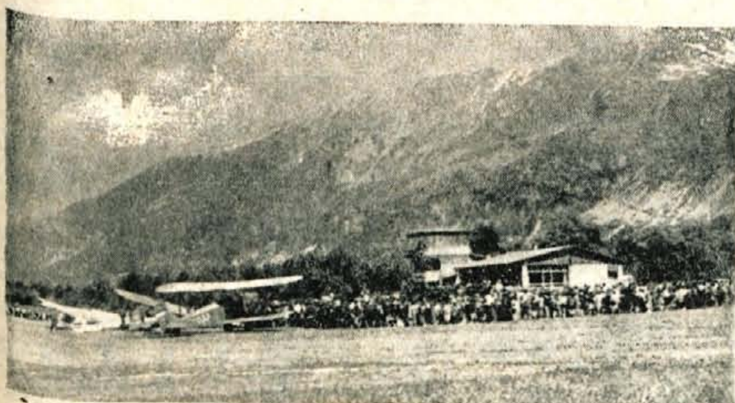
V počastitev 50-letnice jugoslovskega letalstva in praznovanja Dneva mladosti na letališču v Lescah pri Bledu

To je bil prvi, poskusni sestanek te vrste. Glavni cilj tega je,