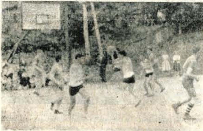
Vajenci so v Skofji Loki tekmovali v najrazličnejših panogah