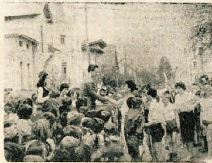
Pisana množica Rodavljčanov je skoraj eno uro čakala na nosilce štafete in jih sprejela z navdušenim aplavzom

gospodarstva pospešeno nadaljnje razvijanje trgovine in gostinstva, ker obe panogi zaostajata za splošnim razvojem in bo treba v prihodnje prav na ta področja osredotočiti vse napore, da bo celotno delovanje trgovine in gostinstva v prihodnje vsklajeno z potrebami gospodarstva in zahtevami potrošnje. V ta namen bo potrebno zlasti stremeti za realizacijo smernih družbenega plana na področju (Nadaljevanje na 4. strani)