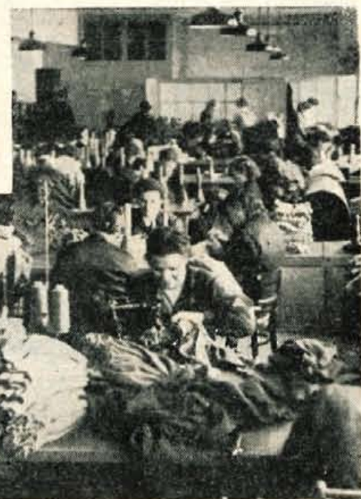
Priprave na Dan mladosti

Zanimanje za razpravo in sklepe na ponedeljkovi seji zbora proizvajalcev kranj. okraja je v vseh delovnih kolektivih tekstilne stroke veliko — Na sliki: v pletilskem oddelku »Spika«