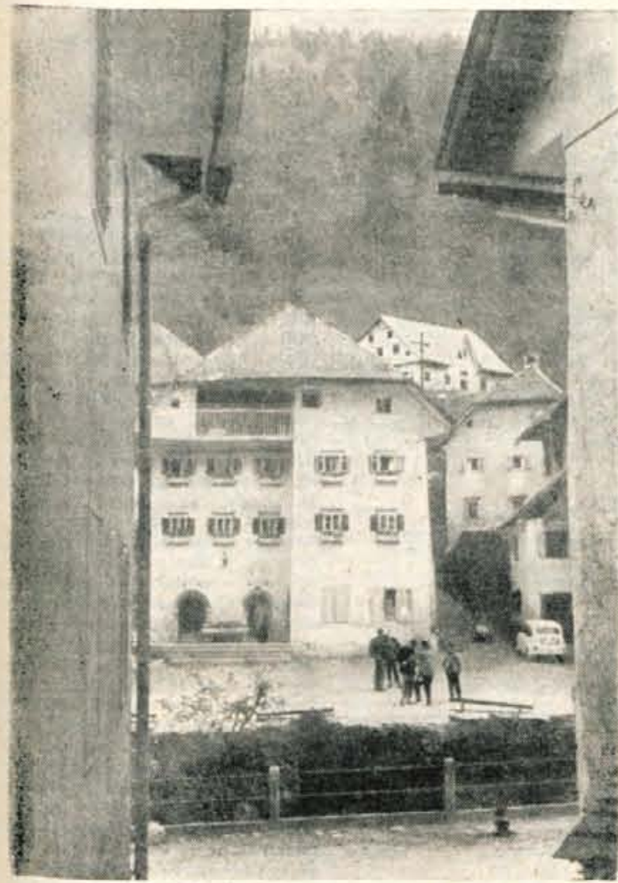
V radovljiški občini Kropa s svojimi zgodovinskimi znamenitostmi privlači iz leta v leto več domačih in tujih turistov