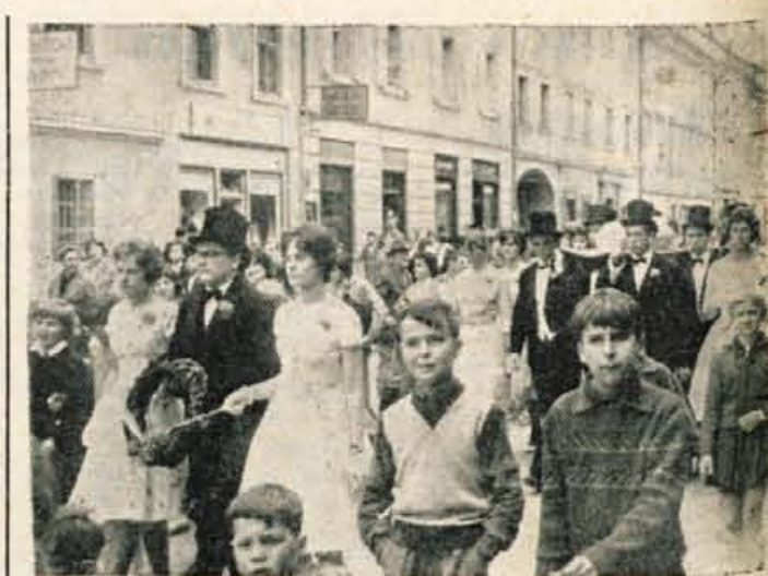
... Inu, končno je pršou čas, ko so maturantje nehali klopiti nucač. To pot pa ta prvokrat ne bodo polagali mature, ampak ta mal doktorat. Po ta novim temu pravjo zaključen izpit. Če majsko solnce ne bo preveč prpekalo, inu če bodo fanije in dekleta pametni, tudi ta nov zaključen izpit ne bo mladih butije preveč zmatral. — Na sliki: ponedeljkov pogrebni sprevod kranjskih maturantov