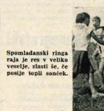
Iz ljudske zakladnice