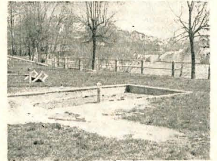
Zanemarjeno in zapuščeno otroško igrišče v Škofji Loki je že dlje kamen spotike. Ker ni nikogar, da bi ga vzdrževal, se tudi otroci nimajo kje zabavati.