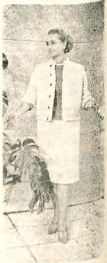
Prikupen kostim, primeren za hladno pomlad ali pa jesen.

Krompir srednje velikosti skuhamo, olupimo ter stisnemo v pire. Dodamo očiščenega olivnega olja ter en beljak. Dobro zmešamo, naneseemo toplo na obraz in vrat, pustimo učinkovati 20 minut, nakar masko odstranimo z mlačno vodo.