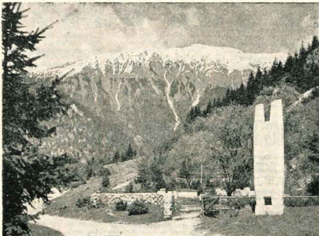
Pred otvoritvijo muzeja talcev

V letošnjem letu pa se te organizacije razen drugega postavljajo tudi nekateri nove naloge. V prvi vrsti mora utrjevati pri ljudeh samozavest v pogledu dosedanje mednarodne pomoči. Naša dežela je ekonomsko vedno močnejša. To je naš uspeh in naš ponos. Zato je treba predvidevati, da bo tudi dosedanja pomoč iz mednarodne organizacije vedno manjša, oziroma, da bo usahnila. To bo zlasti važno za sedanje mlečne šolske kuhinje, ki jih bo treba postaviti na lastne noge. Take in podobne naloge so pred dnevi pretresali tudi na plenumu Okrajnega odbora RK v Kranju. Toda ugotovili so, da bo to izvedljivo le, če bodo pri tem sodelovale vse družbene in politične organizacije, zlasti pa SZDL, sindikalne organizacije itd. Organizacije RK so že v zadnjem letu zelo razširile krog sodelavcev zlasti na zdravstvenem socialnem področju. Vendar je tu še dokaj neizkoriščenih možnosti. Gre za skupne interese, za skupno izboljševanje življenjskih razmer, za preprečevanje vsakega zla. Čast in dolžnost vsakega državljana je, da sodeluje in pomaga pri uresničevanju teh ciljev. K. M.