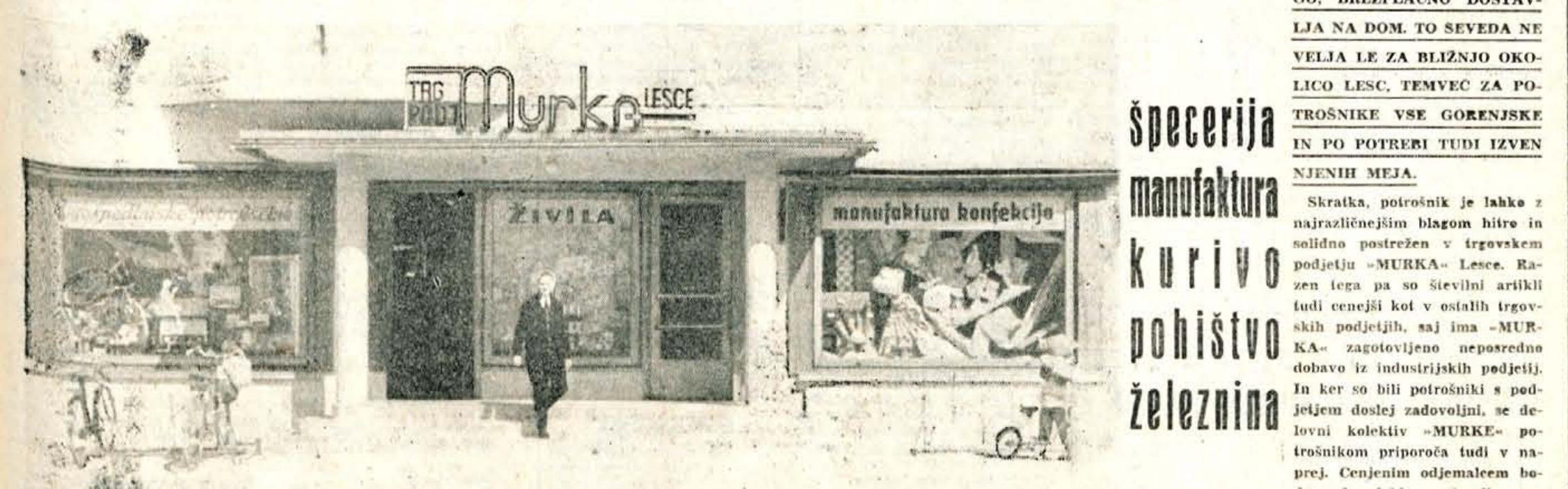
V zadnjem času je za potrošnike že samo preurejeno pročelje »MURKE« mikavno