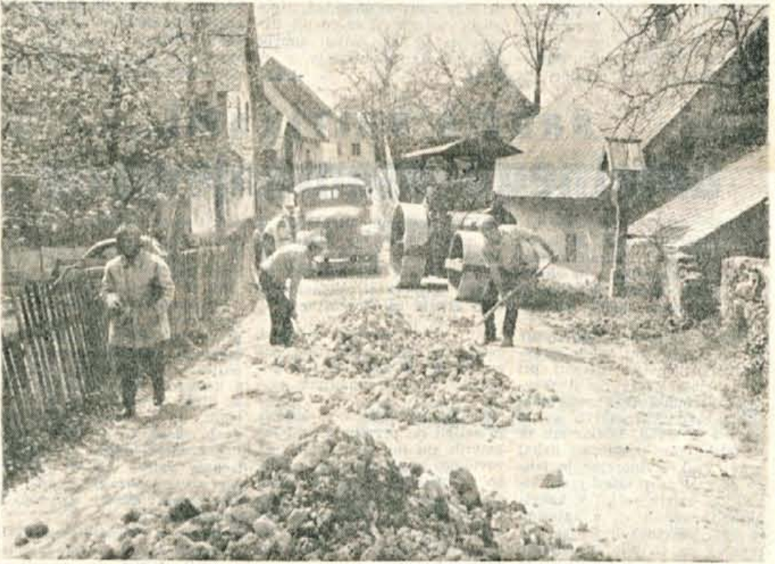
CESTA SKOZI BEGUNJE DOBIVA NOVO PODOBO

ljudje poslovno po opravkih v mesto, vsak dan bolj narašča. S tem jje seveda močno ogrožen javni promet na cesti predvsem zato, ker ti avtobusi še nimajo povsod svojih postajališč tako na podeželju kakor v mestu samem. Predvsem je treba urediti postajališča na cesti I. reda, ki je najbolj prometna. Ponekod so že pričeli z gradnjo postajališč, vendar bo treba dela pospešiti, saj je turistična sezona pred durmi. Bilo bi prav, da bi pri gradnji pomagali domačini s prostovoljnim delom.